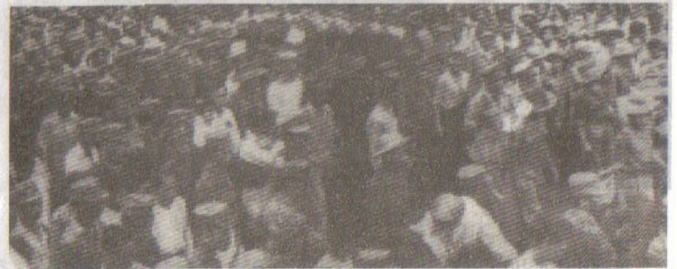
လက်ဗိုလ်ချုပ်အောင်ဆန်း၏ ရုပ်တုလုပ်ငန်း၊ နေအိမ်မှ ဂျူဗလီခန်းမသို့ သယ်ဆောင်လာစဉ်