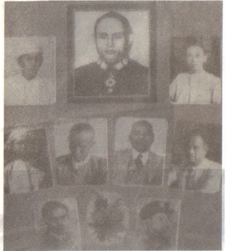
ဗိုလ်ချုပ်အောင်ဆန်းနှင့် လုပ်ကြံခြင်းခံရသော အာဇာနည်ခေါင်းဆောင်ကြီးများ