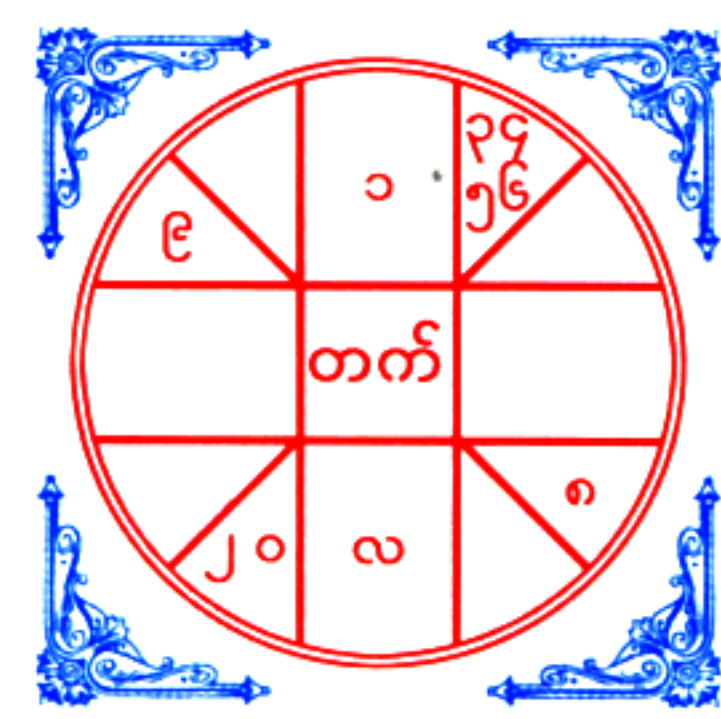
၁၃၇၃-ခု၊ သာသနာတော်နှစ် (၂၀၅၅)