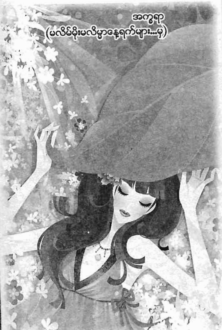
အကွရာ (မလိမ်မိုးမလိမ္မာနေရက်များ...မှ)

မင်းကိုချစ်တဲ့စိတ်ကြောင့်ပဲ ငါဟာ ဟန်ဆောင်မှုကို ဖက်တွယ်ခဲ့ပေါ့ ဒါဟာ... လိမ်လည်မှုတစ်ခုဆိုပေမယ့် “အချစ်နဲ့စစ်မှာ မတရားတာမရှိ” ဆိုတဲ့ စကားကလည်းရှိတယ် မဟုတ်လား...!