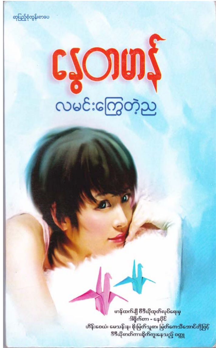
ဆုပြည့်စုံထွန်းစာပေမှ ၂၀၁၀ပြည့်နှစ်၊ ဧပြီလတွင် ထုတ်ဝေသည်။