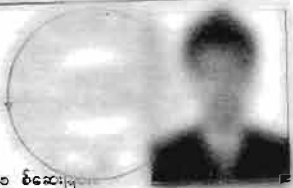
“ ထောက်ခံချက် ”