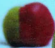
စဝဲရ် တဲက