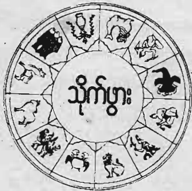
အိုယွန်းယုဉ်စာပေ