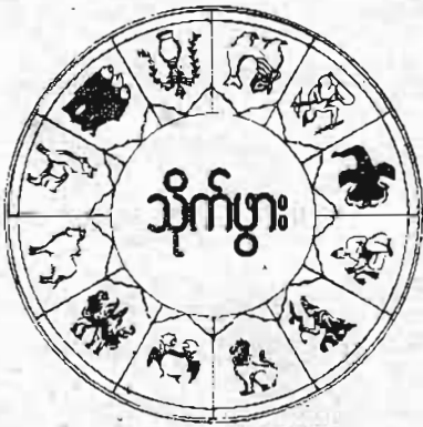
အိုယွန်းယုတ်စာပေ

တစ်ခါတရံမှာ...ဒီလို ထူးခြားဆန်းကြယ်တဲ့ ဖြစ်ရပ်မျိုး တွေလည်း ရှိတတ်ပါတယ်...။