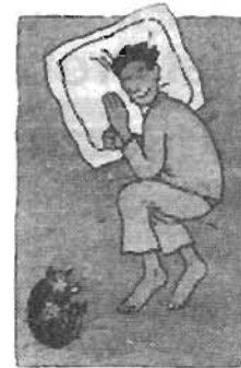
ယောက်ျား