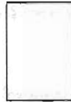
ဖူးစာ (ကျား)

ထို့နောက် ဘေးဘက်တွင်လည်း ရိုးရိုးဖယ်တောက်ခုံတစ်ခုချထားလေသည်။