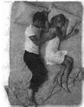
ကောင်မလေးကဗျာ

ဟုစသည်ဖြင့် တစ်ယောက်တစ်ပေါက်ပြောဆိုရင်း ကဗျာကို ဖတ်လိုက်ကြလေသည်။