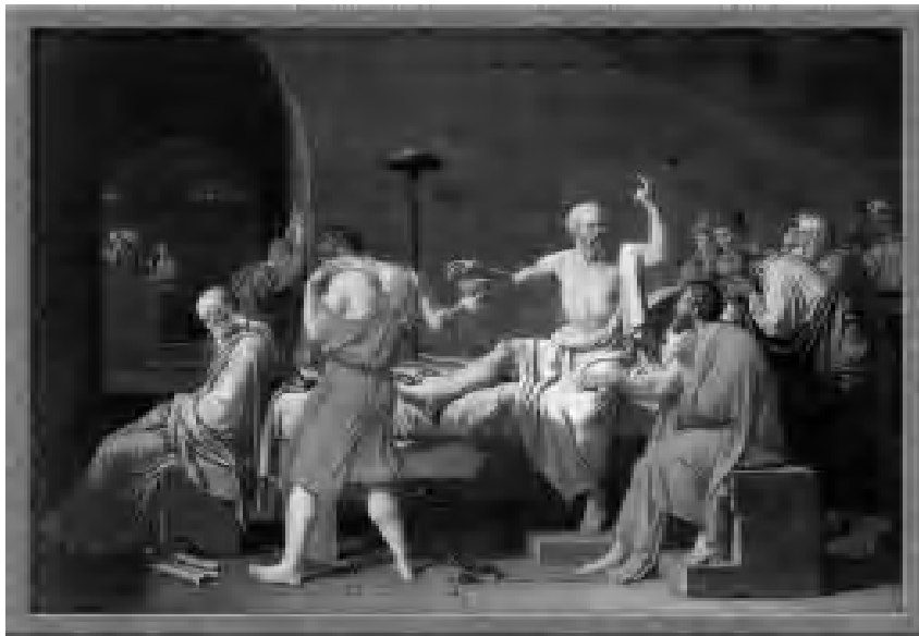
"Death of Socrates" by Jacques Louis David, 1787.