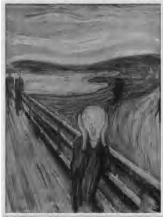
Munch's The Scream (1893)

မြင်သာ ထင်ရှားသည့် ကြားခံပစ္စည်းဖြစ်သည်။ ဖုံးကွယ်ထားသော အသံများကို ဖွင့်ဟပြမည့် အနုပညာများရှိ နေသ၍ တိတ်ဆိတ်ငြိမ်သက်မှု၏ အသံများကို ကျွန်မတို့ ကြားနေရမှာပါပဲ။