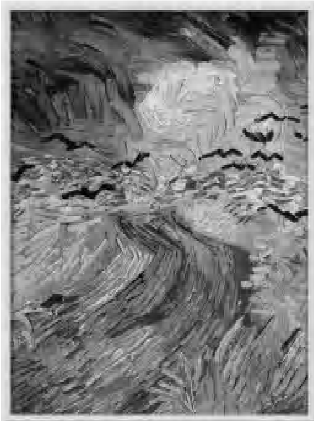
Crows in the Wheat Fields by Van Gogh,1890

ရင်ထဲက အသံကို ကျွန်မနားထောင်ကြည့်သည်။ တိုင်းမ် မဂ္ဂဇင်းထဲမှ မြင်ရသော ဓာတ်ပုံအချို့မှ ကွပ်မျက်ခံရခါနီး လူအုပ်စုများ၏ နောက်ဆုံး ဓာတ်ပုံတို့ကို ကြည့်သည့်အခါ သူတို့၏ရင်ထဲက အသံကို နားထောင်ကြည့်သည်။ သူတို့ကွပ်မျက်ခံရတော့မည်ကို သူတို့သိသည်။ သူတို့၏မျက်လုံးထဲမှာ ကျွန်မမြင်ရသောအရာသည် ရင်ထဲက အသံကို ပြောနေကြသည်။