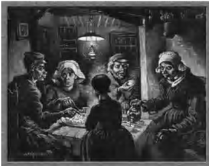
The Potato eaters by Van Gogh, 1885