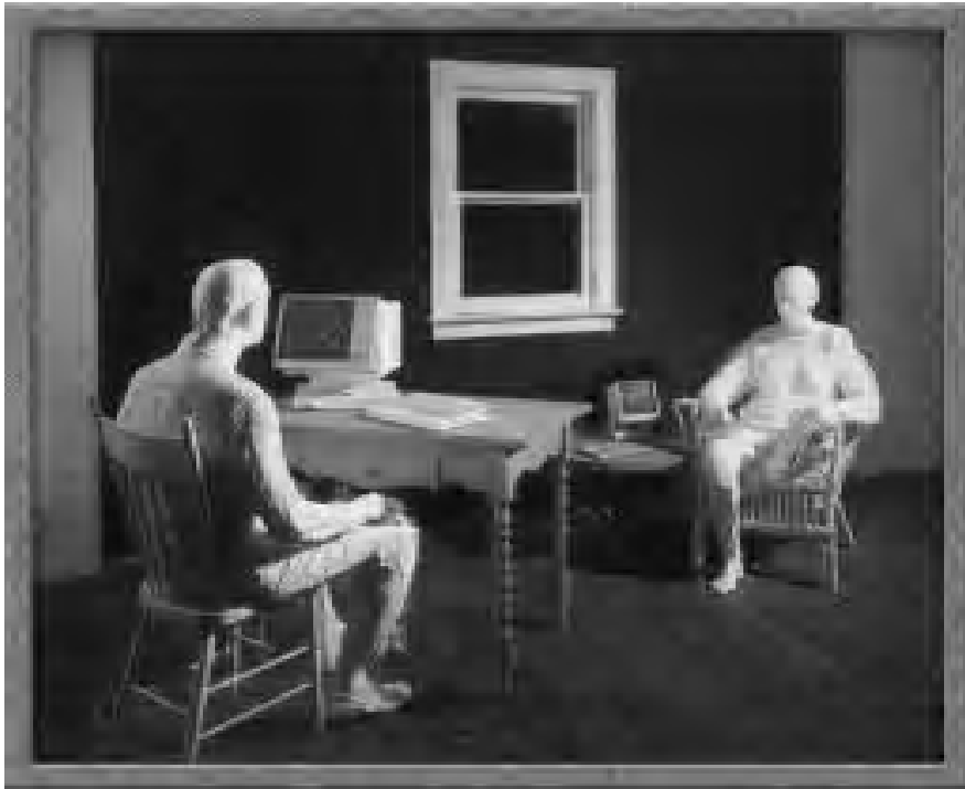
George Segal's Machine of the Year, 1983.