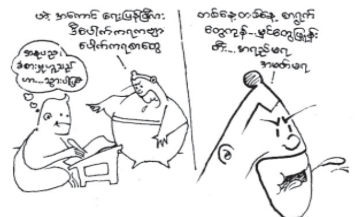
တော်ဝင်မြို့စာအုပ်တိုက်

‘ဟဲ့... ဟိုကောင်မလေး... ဒီမှာဆရာမတို့တရားဆွေးနွေးဖို့ ရောက်နေပြီ... စားဖို့သောက်ဖို့ပြင်ပါတော့လား... ဝေ့... ဝေ့... ဝေ့ ဝေ့...’