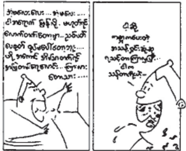
ကောဝိတ်မြို့စာအုပ်တိုက်