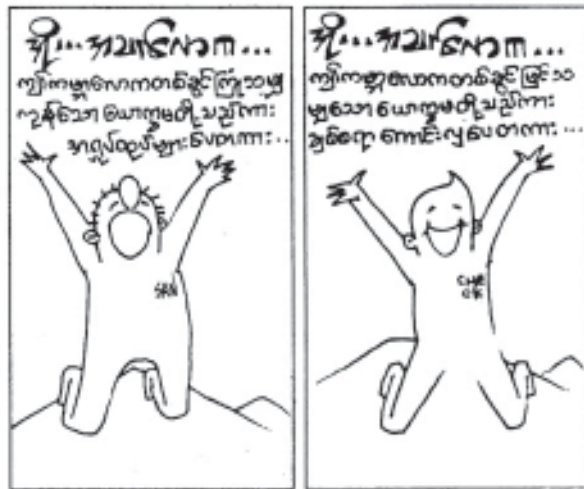
တော်ဝင်မြို့စာအုပ်တိုက်

ဖြစ်တည်နေသောကံတရား နာရီလက်တံကိုမြင်မှဝမ်းနည်းစိတ် များ ကောင်းကင်သို့ လွင့်ပျံ့ကြီးစိုးလာရသည်။ ဒီအချိန်လောက်ဆို ချစ်သူ တော်တော်ကလေးကိုဗိုက်ဆာနေရှာရော့မည်ဟုတွေးမိပြီး အိမ်ပြန် ရန်ပြင်လိုက်သည်။