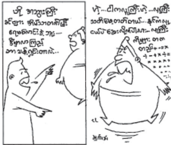
တော်ဝင်မြို့စာအုပ်တိုက်

အဘိုးကြီး၏စကားသံက တိကျပြတ်သား၏။ ချစ်သူကိုဝေဖန်ကြည့် လိုက်တော့ ချစ်သူကမျက်လုံးလေး ပေကလပ်ပေကလပ်နှင့် ငြိမ်သက်