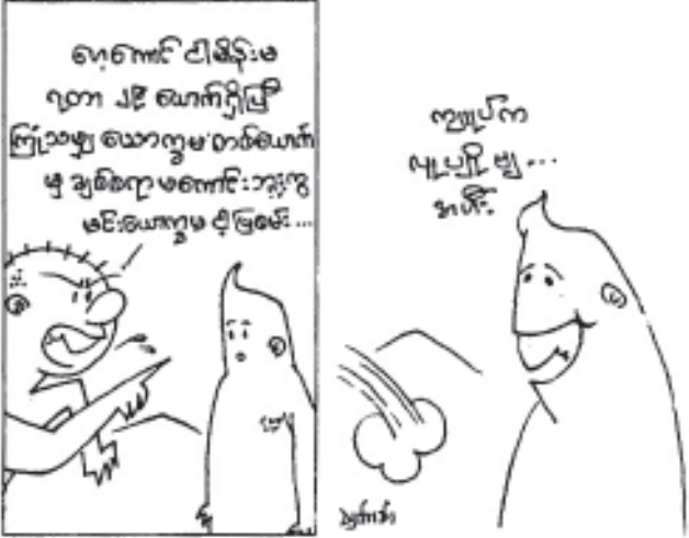
တော်ဝင်မြို့စာအုပ်တိုက်

ပီပြင်စွာ...။ မျက်နှာခွဲကြီးကိုအို...လို့...။ ဒီလိုကိုဖြစ်