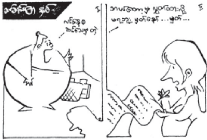
တော်ဝင်မြို့စာအုပ်တိုက်

အဘွားကြီးက ရင်ကိုကော့ကော့ပြ မျက်လုံးပြူးပြူးပြရင်း ခွေး ဘီလူးတိုးတိုးလာ၏။ သူ့ကိုကြည့်ပြီးကျွန်တော်အမြင်ကတ်စိတ်များ ပို၍ကြီးထွားလာပြီး လက်နှစ်ဖက်ရှေ့ကာကာ...။