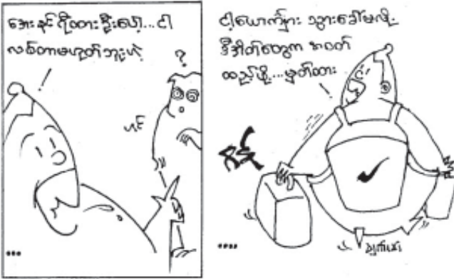
တော်ဝင်မြို့စာအုပ်တိုက်