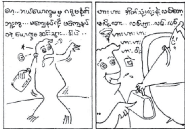
တော်ဝင်မြို့စာအုပ်တိုက်

‘အောင်မာ... ဟဲ့ဒီမှာ... ဒို့ကမရှိလဲထမင်းကြမ်းခဲကို ယပ်ခပ် ဆားနဲ့နယ်ပြီးစားလိုက်မယ်... သူများလို တိတ်တိတ်ပုန်း အငယ်အနှောင်း...’