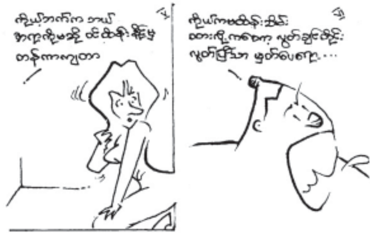
တော်ဝင်မြို့မစာအုပ်တိုက်

ကျွန်တော့်၏ဒေါသကြီးအော်ဟစ်စကားကို အဘွားကြီးက သက်ပြင်းကို ဟန်ပါပါချ၊ မျက်ရည်နှင့်နှုပ်များကို အင်္ကျီလက်နှင့် မာန်ပါပါ