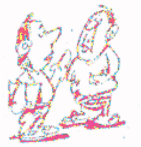
စိန်စိန်ဦး စာအုပ်တိုက်