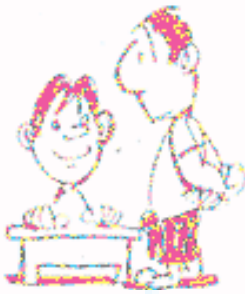
မိန့်မိန့်ပြီး စာတင်တိုက်

တစ်နေ့မှာ ဆရာက “ကျွန်တော် မန်နေဂျာ ဖြစ်ခဲ့လျှင်” ဆိုပြီး စာစီစာကုံး အရေးခိုင်းပါတယ်။ ကျောင်းသားတွေအားလုံးရေးပေမယ့် တစ်ယောက်က မရေးဘူး။ ဒီတော့ ဆရာကအဲဒီကျောင်းသားနားသွားပြီး ☺ မင်းကဘာလို့ မရေးသေးတာလဲ။ ☺ အတွင်းရေးမှူးကို စောင့်နေတာပါ။