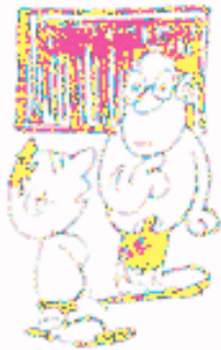
မိန့်မိန့်ဦး စာအုပ်တိုက်