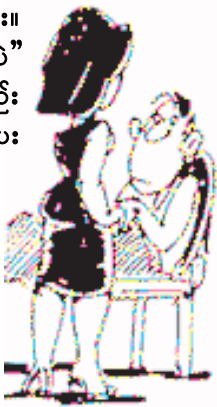
မိန်မိန်ဦး စာအုပ်တိုက်

နေမကောင်းတဲ့သူဌေးကြီးက သူ့ရဲ့အတွင်းရေးမှူးမကိုခေါ်ပြီး “ငါတော့ သိပ်နေရမယ်မထင်ဘူး။ သေမင်းတော့ ငါ့ဆီလာတော့မှာပဲ” “ဆရာ မတွေ့ချင်ရင် အစည်း အဝေးရှိတယ်လို့ ကျွန်မပြောပေး ပါ့မယ်။