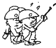
အခုတော့ ကျွန်ုပ်တို့စည်းရုံးကာ တောဘုရင်ဖြစ်သောတင်မှ လက်ရွေးစင်ထွက်ပြေးရပြီ မဟုတ်လား

တရစပ် နှုတ်တိုက်ပြော နေသူ သွေးပွက်ပွက်ဆူအောင်