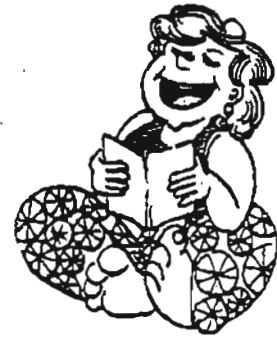
ချန်ပီယံတွေ

ကောင်လေးတစ်ယောက်က နေ့စဉ်နေ့တိုင်း လမ်းမှာ စောင့်၍ ကောင်မလေးကို ချစ်ရေးဆိုသည်။ ထိုကိစ္စအား စိတ်ရှုပ်လာသဖြင့် ကြံရာမရဖြစ်မိသောကြောင့်... **နင့်ကို တစ်ခုတော့ သတိပေးလိုက်မယ်၊ ငါ့အစ်ကို နဲ့တွေ့ရင် နင် မလွယ်ဘူး၊ ငါ့အစ်ကိုက လက်ဝှေ့ချန်ပီယံတစ် ယောက်ပဲ** ကောင်ကလေးက လန့်ဖျပ်မသွားဘဲ... **အခုလိုသတိပေးတာ ကျေးဇူးပါပဲ၊ ငါလည်း နင့်ကို ပြောဖို့မေ့နေတယ်၊ ငါက အပြေးချန်ပီယံလေ** ဟူ၏။