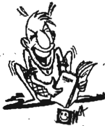
ချစ်တတ်ပုံတဲ့

အိမ်ထောင်ကျပြီးသော ကျောင်းသူက စာအိတ်ထဲမှ စာရွက်သေးသေးလေးကိုထုတ်ကာ သူ့သူငယ်ချင်းကို ပြောလိုက်သည်။