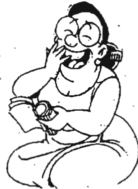
လက်တွေ့ကျကျ

အမျိုးသမီး ။ ။ “တို့ကို ချစ်ရဲ့လား” အမျိုးသား ။ ။ “ချစ်တာပေါ့” အမျိုးသမီး ။ ။ “တို့သေရင် မောင် ငိုမှာလား” အမျိုးသား ။ ။ “ငိုမှာပေါ့” အမျိုးသမီး ။ ။ “ဘယ်လောက်အထိငိုမှာလဲ၊ ငိုပြစမ်း ပါဦး” အမျိုးသား ။ ။ “အရင်သေပြလေ” ဟူ၏။