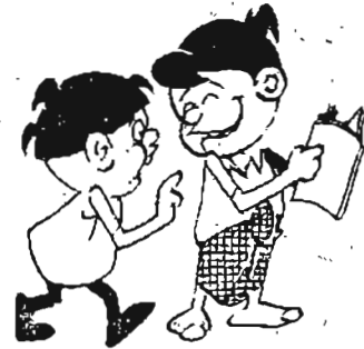
မယူတော့ပါ

ကမ္ဘာကျော် “လိုက်ဖ်” မဂ္ဂဇင်းအယ်ဒီတာချုပ်သည် စာဖတ်သူတစ်ဦးထံမှ စာတစ်စောင် လက်ခံရရှိ၏။