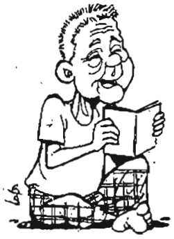
ကောန္တတော့