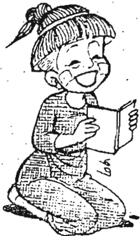
တူ့တူလာပြီ