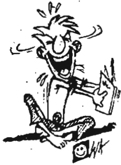
သမီးကိုပဲ ယူပါရစေ

ရစေ** ဂျိန်းက သူ့ရည်းစားဖခင်အား အရဲစွန့်ပြောလိုက် သည်။ **နေပါဦးကွ... မင်း ငါ့မိန်းမနဲ့ အရင်တွေ့ပြီးပြီ လား** ဖခင်က ပြန်မေးလိုက်သည်။ ဂျိန်းက... **ဟုတ်ကဲ့... ကျွန်တော် တွေ့ပြီးပါပြီ၊ ကျေးဇူးတင် ပါတယ် ဦးရယ်၊ ဒါပေမဲ့ ဦးသမီးကိုပဲကြိုက်လို့ပါ** ဟူ၏။