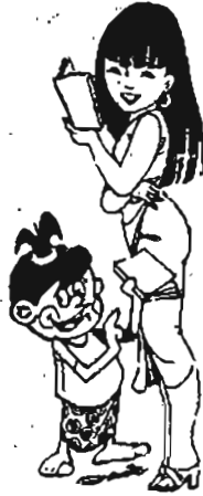
မေတ္တာပျက်

မိန်းကလေး သူငယ်ချင်းနှစ်ဦး စကားပြောနေကြသည်။ ပပ ။ ။ 'ဟဲ့... မြမြ၊ နင့်ရည်းစားက နင့်ချစ်နဲ့ သမ္ပတေ့ကို ဘယ်လိုတုံ့ပြန်သလဲဟင်' မြမြ ။ ။ 'တစ်ဝက်တစ်ပျက်ပဲ တုံ့ပြန်ပါတယ်' ပပ ။ ။ 'သူနဲ့ငါ ရည်းစားဘဝမှာတုန်းက ငါပေးခဲ့တဲ့ ချစ်သက်လက်ဆောင်တွေကို ပြန်ပေးခဲ့ပေမယ့် စိန်လက်စွပ်နဲ့ ရွှေဆွဲကြိုးကိုတော့ ပြန်မပေးဘူးလေ'ဟူ၏။