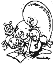
စမ်းသပ်၊ လေ့လာ