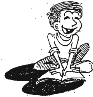
သူ့အမြင်က

ကျွန်မ၏ညီမဖြစ်သူသည် လေသူ့ရဲတစ်ဦးနှင့် လက်ထပ်ရန် စေ့စပ်ထားပါသည်။ ခင်ပွန်းလောင်း လေသူ့ရဲက လေယာဉ်ကို စတန်ထိုင်၍ ကျွမ်းထိုးမှောက်ခံပျံသန်းပြီး ကြွားပြလိုသဖြင့် ဇနီးလောင်းရှေ့တွင် လေယာဉ်ကို ပျံသန်းပြပါသည်။