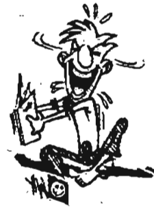
လက်ထပ်ချိန်

‘သမီးမိန်းကလေးရဲ့မင်္ဂလာကိစ္စ စဉ်းစားပေးဖို့ အချိန် တန်ပြီထင်တယ်’ ဟု မိန်းမဖြစ်သူက ယောက်ျားဖြစ်သူကို ပြောပြလိုက်၏။