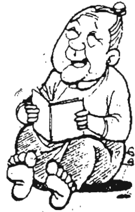
ထူးခြားမှုက

“နာမည်ကျော် ဓာတ်ပုံဆရာတစ်ဦးနဲ့ လက်ထပ်ပြီး တွဲဖောက်ပိုင်း ထူးခြားမှုကို ပြောပြနိုင်ပါသလားခင်ဗျာ”