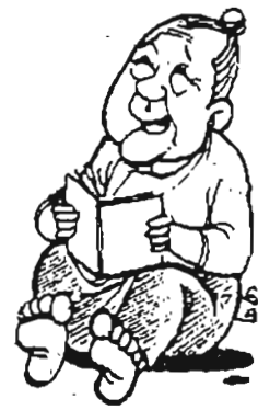
သစ္စာရှင်များ

အမျိုးသမီး။ “သစ္စာမရှိတဲ့ ကျွန်မယောက်ျားနဲ့ ကွာရှင်းလိုပါတယ်”