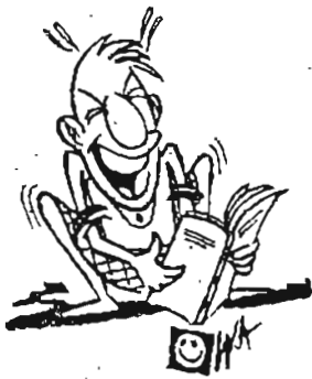
လွယ်ပါတယ်

မိလုံနာသုဋ္ဌေးကြီးမှာ အသက် ၇၀ အရွယ်ရှိသော်လည်း အသက် ၂၀ သာရှိသော မိန်းမချောလေးကို လက်ထပ်ယူလိုက်သဖြင့် စိတ်ဝင်စားမိသွားကြသည်။