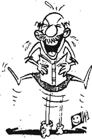
အလိုရှိသည်

ကိုယ်ရေးကိုယ်တာ ကြော်ငြာ၊ မြေကောင်းမြေသန့် ဧက ၄၀ ပိုင်သော လှပျိုကြီးက ထွန်စက်ပိုင် အမျိုးသမီးတစ် ဦးနှင့် ရင်းနှီးလိုသည်။ လက်ထပ်ရန်အထိ ရည်ရွယ်သည်။ ထွန်စက်၏ဓာတ်ပုံကို ပေးပို့ပါ။