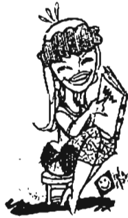
မပေးလည်းနေပါ