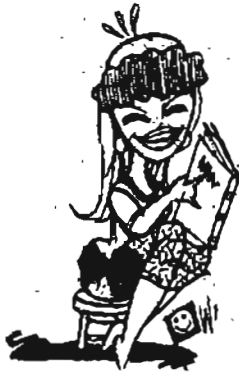
ဒါကြောင့်ပေါ့ကွ

ဖခင် ။ ။ “သမီးနန်စီရဲ့ ရည်းစားက သူများတွေအိပ်ချိန် ရောက်တာတောင် ခုထက်ထိ မပြန်သေးဘူးကွ၊ ငါ အောက်ထပ်ဆင်းပြီး ဒီကောင်လေးကို ပြန် ခိုင်းလိုက်ရင် ကောင်းမယ်ထင်တယ်” မိခင် ။ ။ “ကောင်းသားပဲကျော့၊ ဒါပေမဲ့ ရှင်နဲ့ကျွန်မလည်း ငယ်ငယ်တုန်းက ဒီလိုနေခဲ့တာကို မမေ့နဲ့နော်” ဖခင် ။ ။ “ဒါကြောင့်ပေါ့ကွ၊ ဒီကောင့်ကို အမြန်ပြန်ခိုင်းမှ ဖြစ်မှာ” ဟူ၏။