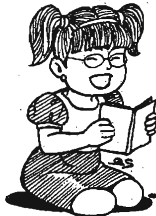
ဟုတ်ပျို

ပြင်သစ်ရုပ်ရှင်သရုပ်ဆောင်နှစ်ဦး စကားပြောနေသည် ကို ဤသို့ကြားရ၏။