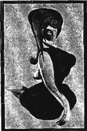
မိုး : မိုး : စ ၁ ၆ ၀

ရဲမင်းက မင်းထင်ဆီ ဖုန်းအတင်းလှမ်းထိုးပေး၏။ ဒါကို မင်းထင်က