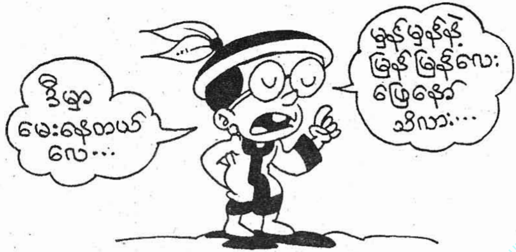
ကျေးဇူးတင်စာပေ

နီတိသုံးမျိုး ရှိပါတယ်။ အဲဒီသုံးမျိုးကို ပြောပြပါလား... ?