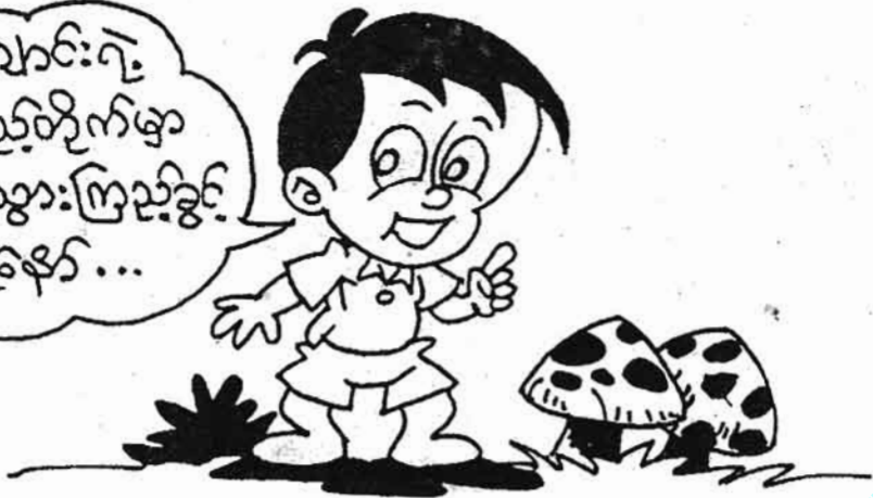
ကျွန်းဆိုးစာပေ