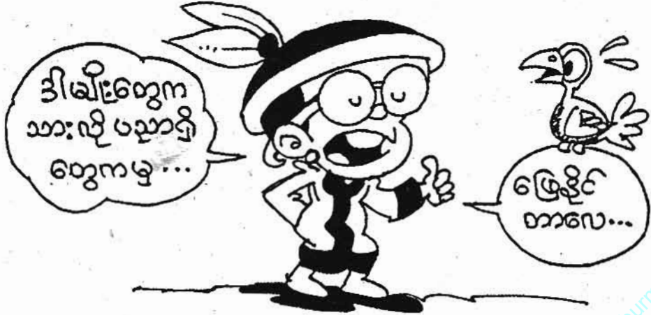
ကျေးဇူးတင်စာပေ

နေနဲ့ အဝေးဆုံးဂြိုဟ်ကတော့ (ပလူတို)ဂြိုဟ်ပဲ ဖြစ်ပါတယ်...။