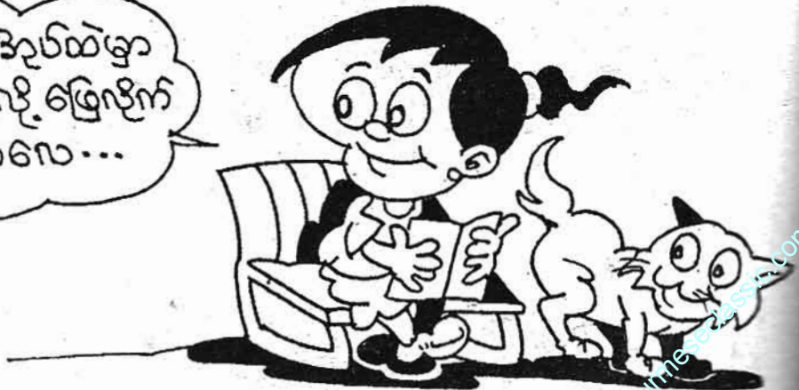
ကျေးဇူးတင်စာပေ