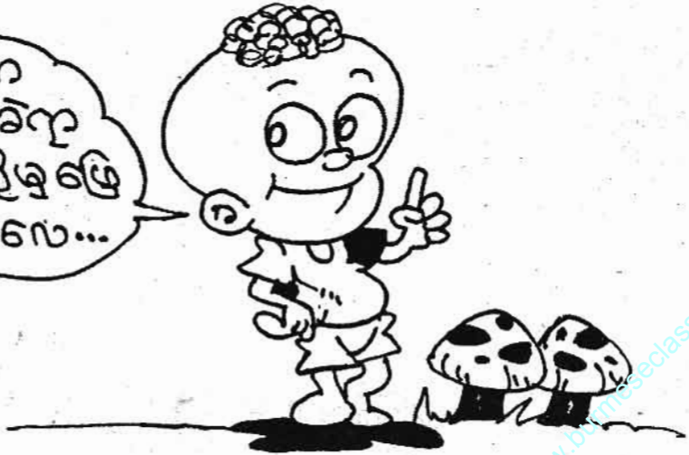
ကျေးဇူးတင်ပေ