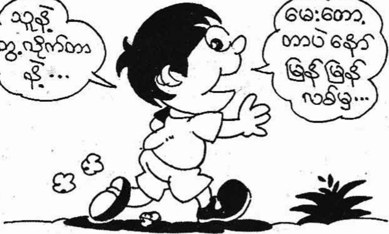
ကျွန်းသိုးစာပေ