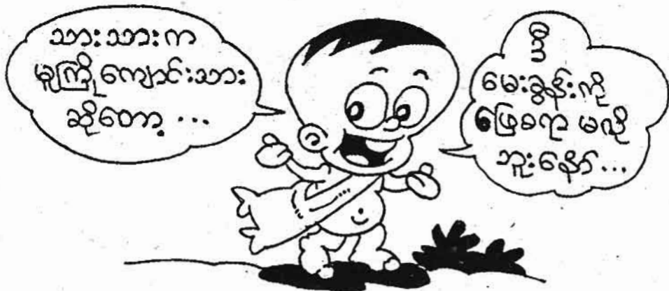
ကျော်စိုးစိုးစာပေ

အဋ္ဌကံမှာ အနားပေါင်း ဘယ်လောက်ရှိသလဲ၊ ဖြေလိုက်ပါဦး... ?