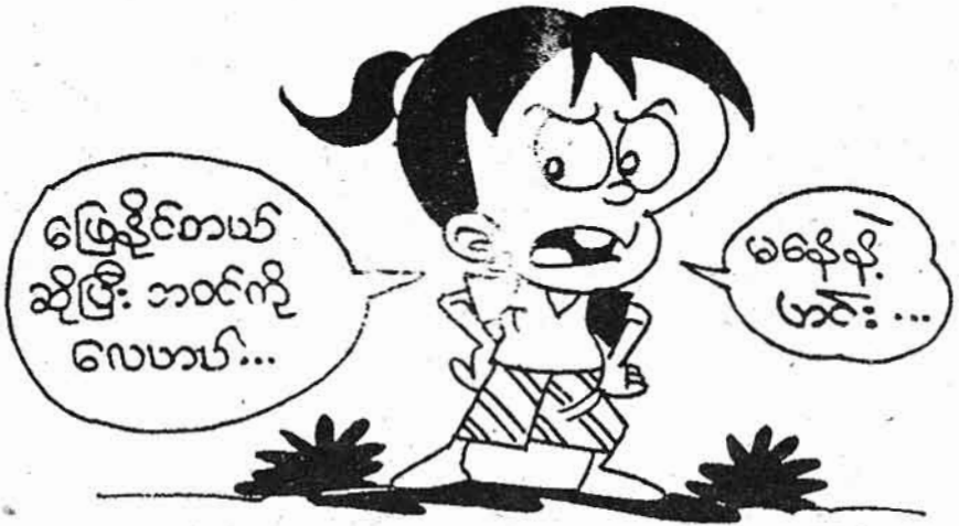
ကျောရိုးပိုးစာပေ

ကျောပေါ်မှာ ဘို့တစ်လုံး၊ ဒါမှမဟုတ် နှစ်လုံးရှိတဲ့ သတ္တဝါကတော့ (ကုလားအုတ်)ပဲ ဖြစ်ပါတယ်...။