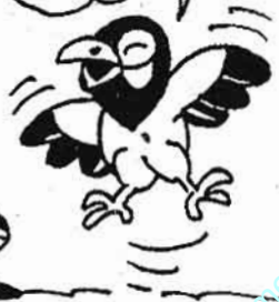
ကျော့စိုးမိုးစာပေ