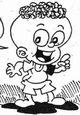
ကျော်စိုးမိုးစာပေ