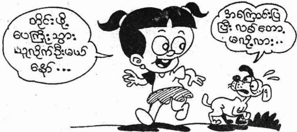
ကျောရိုးတို

ခန္ဓာကိုယ်ထဲမှာ ဘယ်ကြွက်သားက အသေးဆုံးနဲ့ အတိုဆုံးဖြစ်ပါသလဲ...?