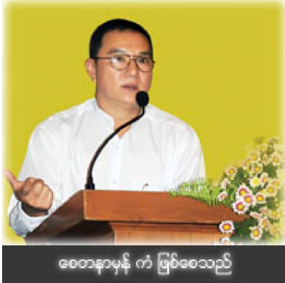
စေတနာမှန် ကံ ဖြစ်စေသည်

အခုတလော ဘာသာရပ်ဆိုင်ရာဟောပြောပွဲတွေနဲ့ အကျိုးပေးသလိုပဲ၊စိတ် ရှိပေမယ့် အလုပ်တဖက်နဲ့မို့ တနှစ် နှစ်ပွဲလောက်ပဲကောင်းတယ်ဆိုတဲ့ အ ယူအဆနဲ့ ချီတက်ခဲ့တာ ခုနှစ်နှစ်၊ ရှစ်နှစ်လောက် ရှိပြီ။ သည်နှစ် မှာတော့ ကန့်သတ်လို့ မရတော့ဘူး ဖြစ်လာတယ်။