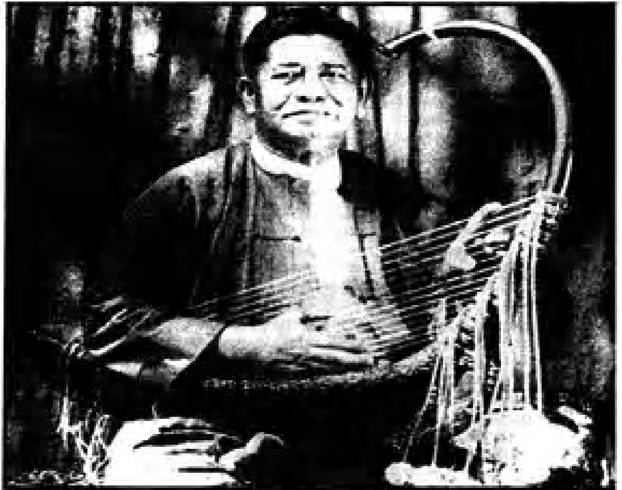
လှဆန်းသက်စိုး တူရိယာ တောင်ကလေး နှင့် စိန်စေတီ