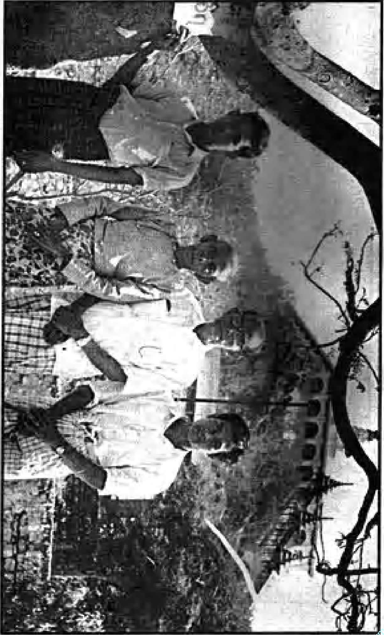
ခရစ်တော်မြတ်အားကျင့်သောသူတို့ (ပျော်လှပစွာကျင့်သောသူတို့အားကျင့်သောသူတို့) (၁၉၀၅)