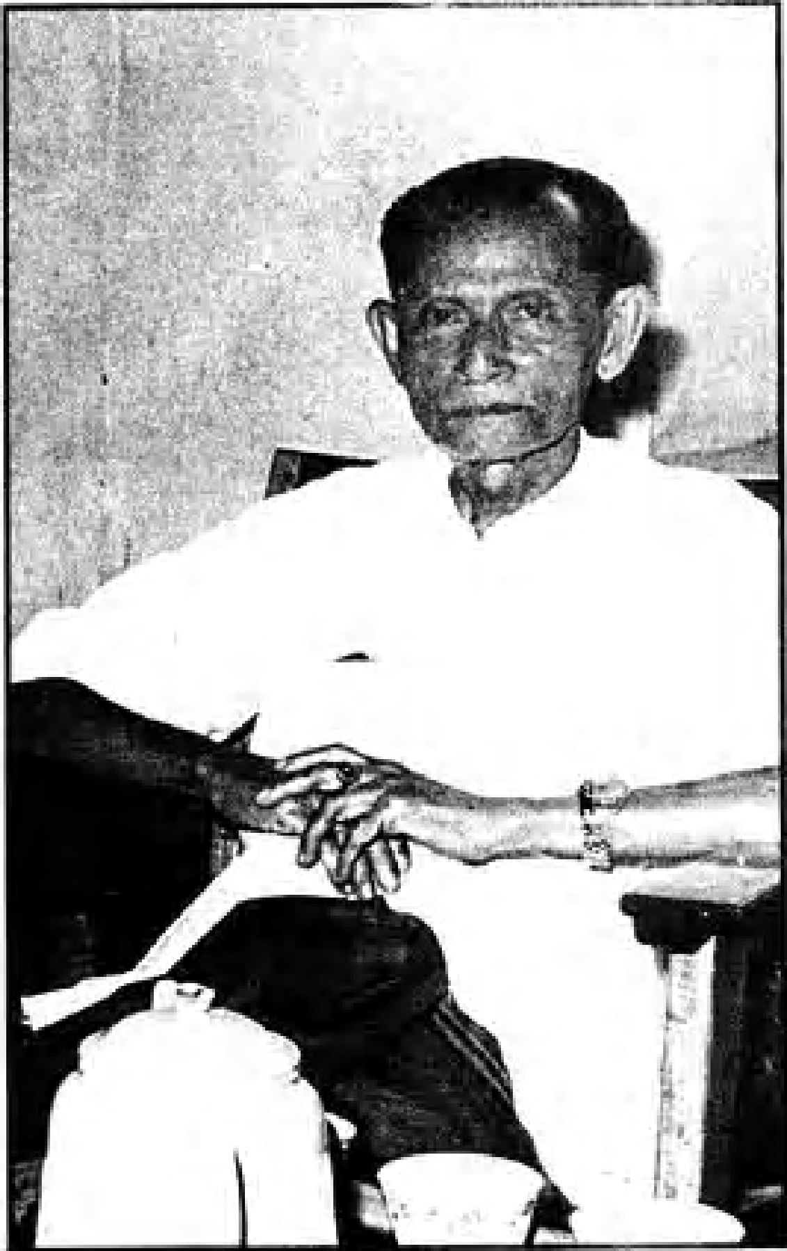
ဒုတိယ ဦးစော