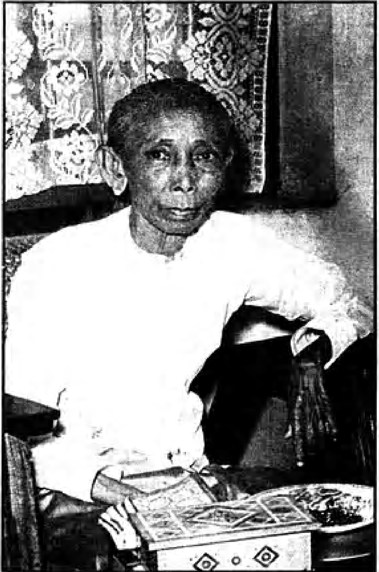
ဒေါ်စာပြဒေဝကြည် (ယုလေးဖောက်ဆုဒေခေါက်ဆွဲကော်တုနီက)