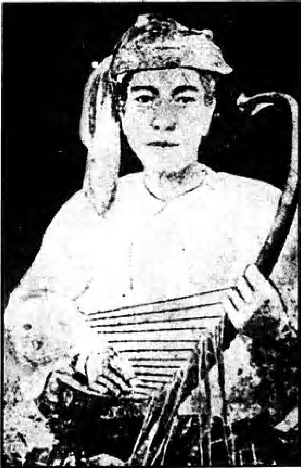
ဒေဝန္တရီသောင်သောင်ကြီး