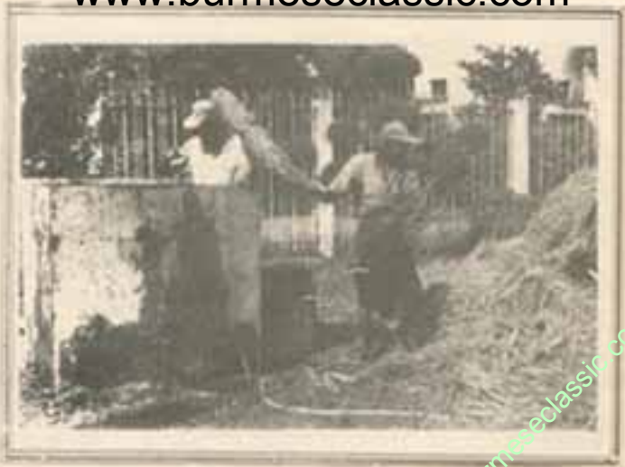
ကောက်ရိုး(သို့မဟုတ်) ရိုးဖြတ်ထုံးများကို ရေစိမ်ပါ။