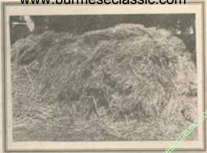
ခြောက်သွေ့သောကောက်ရိုး ရိုးပြတ်ထုံးများဖြစ်ရမည်။