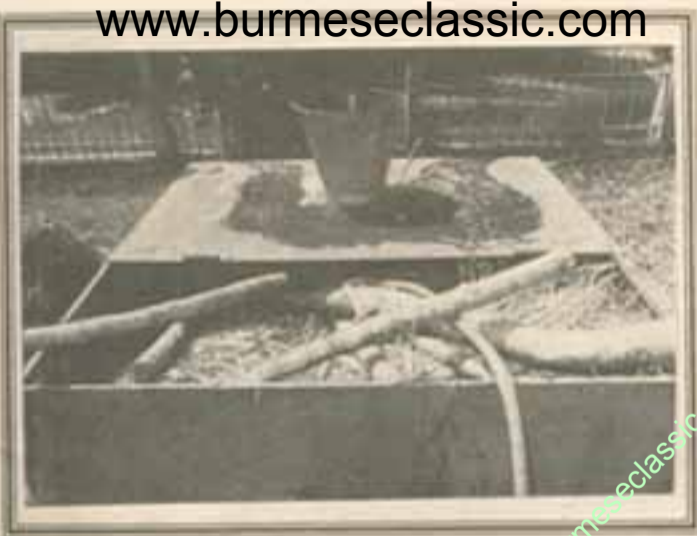
ကောက်ပဲသီးနှံများကို ရေငုံဆောင်ရွက်ပေးပါ။