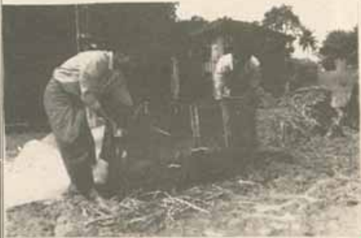
လေးကို ချွတ်ပါ။