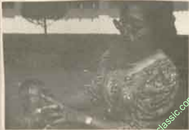
ကြည်လင် ငြိမ်းဆဖြူရောင် မို့ဖျင် တုတ်ပြန် ရမည်း မို့ဖျင် ပြည်ငြိမ်း (၁၀) ရက် ဆတွင် မိုက်ပျိုး ရမည်း