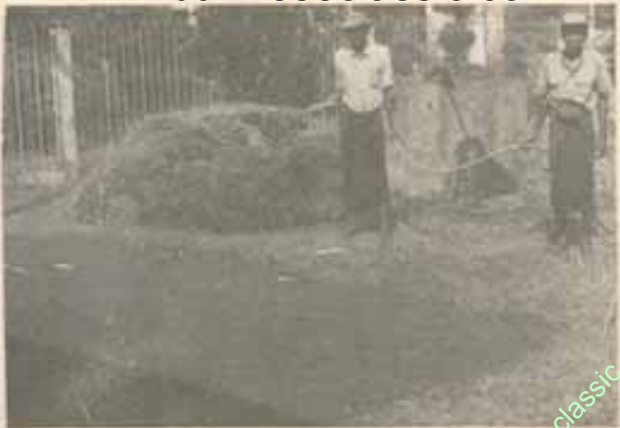
ရေဝအောင်လောင်းထားသော မြေကြီးတွင်လေးချပါ။