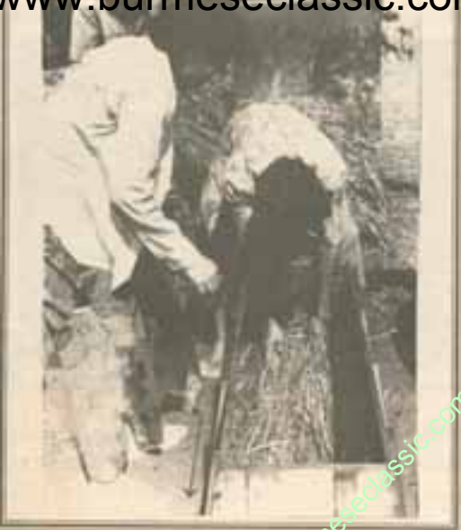
ရေစစ်ထားသော ကောက်ရိုးစဉ့်ကို ဖြေပြီး ဓလာ သလျားသလိုက် (၄") ဆထုခြင်းပါ။