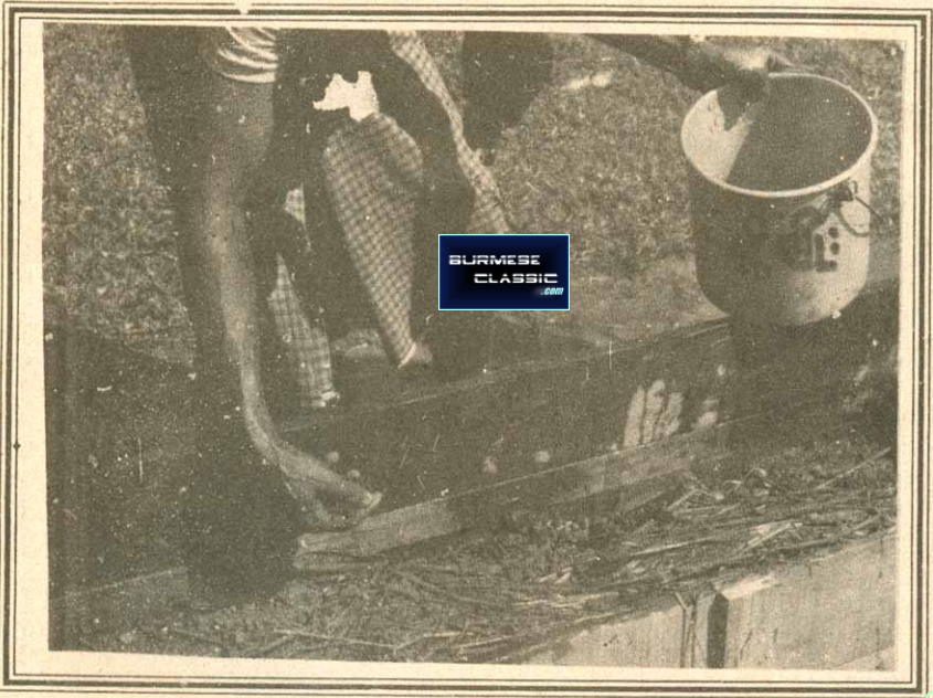
မိုးမျိုးကိုဖြည့်စွက်စာပေါ်တွင်ခပ်ပါးပါးဖြူးပေးပါ။