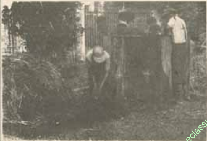
ကောက်ခိုးကို ရေစစ်ပါ။