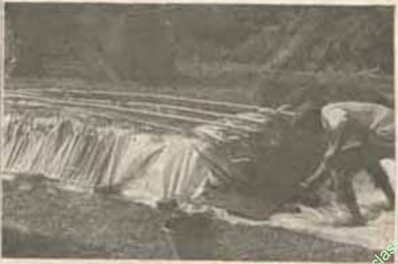
ဝန်ပတ်များပေါ်မှ ဝါးလုံးဖြင့်ပိထားရေးဝါ။