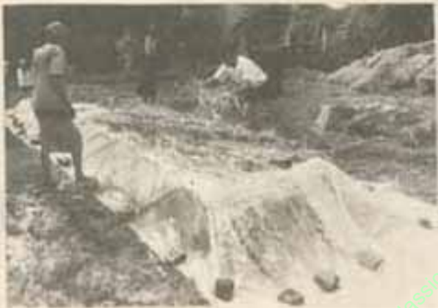
ပလတ်စတစ်စပေါ်တွင် ကောက်ရိုးခြေတံများဖြင့် တစ်ပုံလုံးကို ဖုံးအုပ်ပေးပါ။