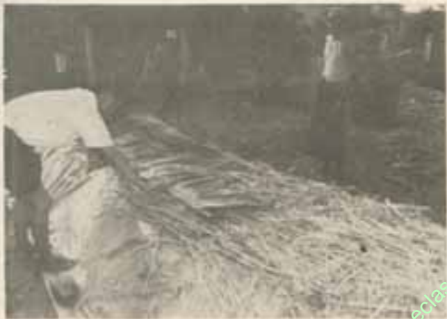
ကောက်ရိုးခြောက်ပေါ်တွင် ခန့်ဖက်ကိုလှုပ် ဖုံးအုပ်ပါ။