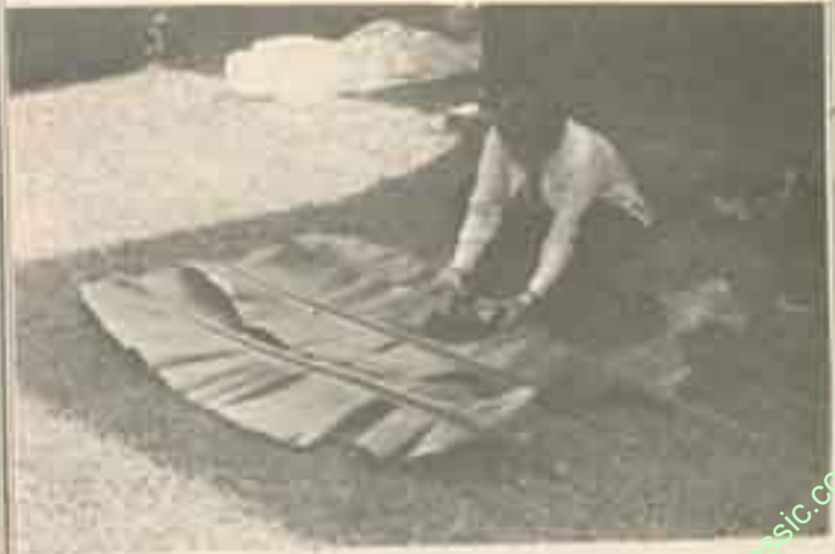
မို့မျိုးထုပ်ကိုညင်သာစွာချောမွေ့ရမည်။