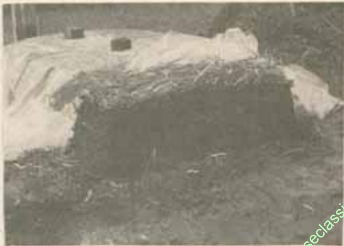
ပလတ်စတစ်စ နှစ်စပိ၍ ဖုံးအုပ်ပါ။