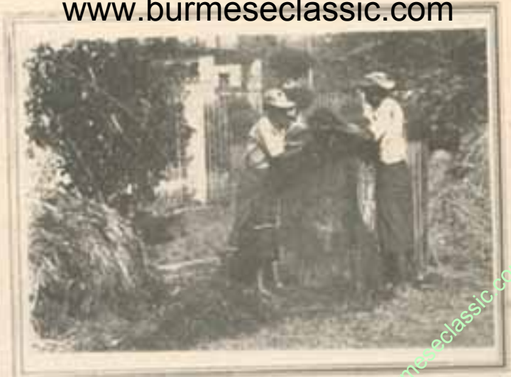
ရေစိမ်ကောက်ဖိုးကို ဆယ်ယူပါ။