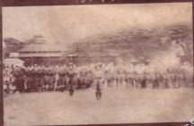
မြန်မာ့လူကြီးများ