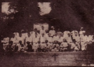
၂၅၂၆ နှစ်က ဝန်ထမ်းများ အတူတူပူးပေါင်းပုံ