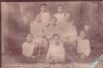
ကျောက်ဆည်မြို့နယ်၊ ကျောက်ဆည်မြို့၊ ကျောက်ဆည်မြို့နယ်၊ ကျောက်ဆည်မြို့နယ်

မြန်မာ့နိုင်ငံတော်၊ ကျောက်ဆည်မြို့နယ်၊ ကျောက်ဆည်မြို့နယ်