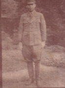
ရဲဘော်ကြီးကြီး