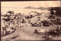
ရန်ကင်းမြစ်ကမ်းခြေကမ်းခြေ