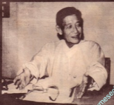
အောင်မြတ်ဗုဒ္ဓဘုရား၏ နိဂုံး