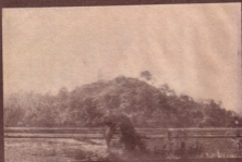
အောင်ပျော်တောင်