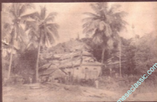
ကော့ကော့ကော့ကော့ကော့