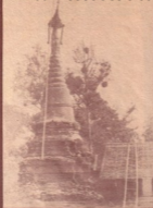
of the pagoda of the pagoda of the pagoda