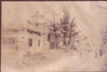
ကျောက်ဆည်မြို့နယ်၊ ကျောက်ဆည်မြို့၊ ကျောက်ဆည်မြို့နယ်၊ ကျောက်ဆည်မြို့နယ်