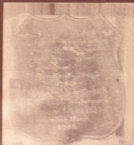
ဗြိတိသိန်အစိုးရကတင်ဆောင်ခဲ့သော ဗြိတိသိန်အစိုးရကတင်ဆောင်ခဲ့သော