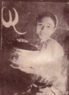
ဆရာမအောင်