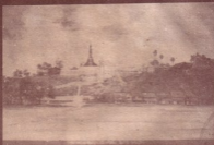
၂၅၅ မြောက်ဘက်