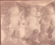
အမေ့အားရပုံရိပ်