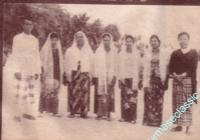
အထွေထွေအားဖြင့်