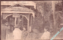
အောင်ပျော်တောင်အောက်ရှိအောင်ပျော်တောင်