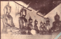
မင်းဦးဘုရားတော်နှင့်အခြားအိန္ဒိယ