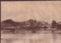
တနင်္သာရီမြို့