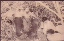
ကော့ကော့ကော့ကော့ကော့