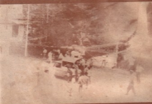
ရန်ကင်းမြို့တော်ရှိ ဘုရားတော်ရှေ့တွင်