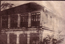
မြန်မာ့နိုင်ငံတော်တော်ဝင်အစိုးရအဖွဲ့ရုံး