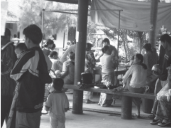
ကလေးပြင်ပလူနာဌာန