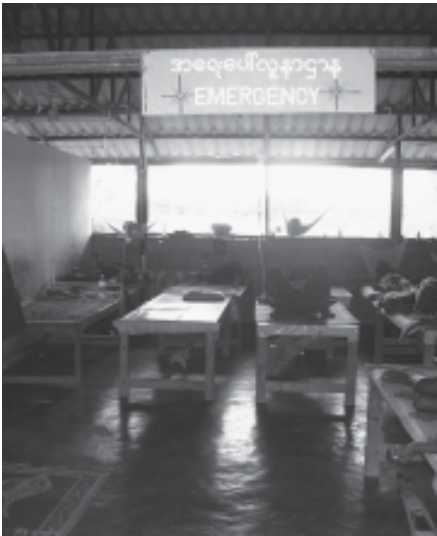
အရေးပေါ်လူနာဌာန (ခွဲစိတ်/ဆေးထည့်)