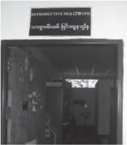
သားဖွားမီးယပ် ပြင်ပလူနာဌာန