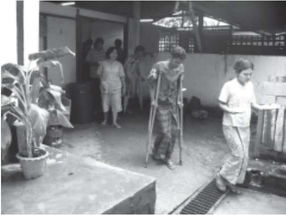
ထမင်းစားတော့မည့် လူနာတဦး