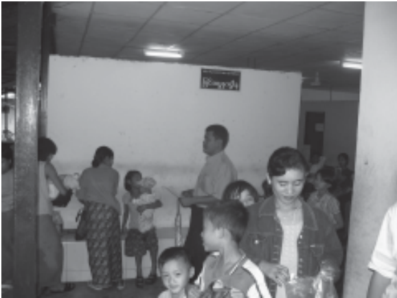
ပြင်ပလူနာဌာန