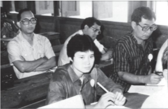
ဒီအေဘီ ပထမအကြိမ်အစည်းအဝေးသို့ တက်ရောက်စဉ်။