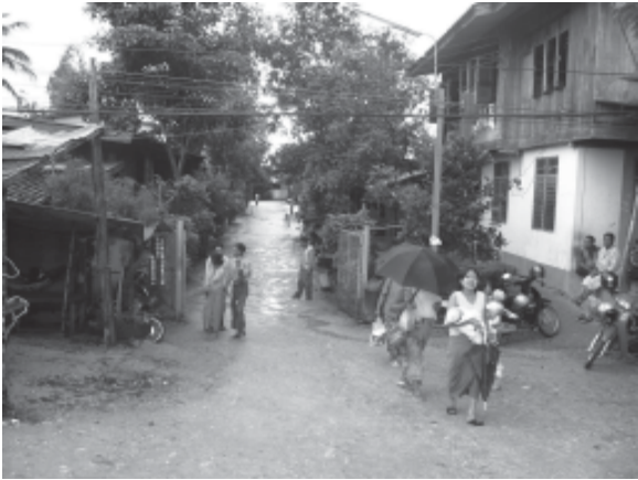
မယ်တော်ဆေးခန်းသို့အဝင်လမ်း