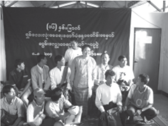
(၁၆) နှစ်မြောက် ရှစ်လေးလုံးအရေးတော်ပုံနေ့အထိမ်းအမှတ် ဆွမ်းကျွေးတရားတော်နာယူပွဲ