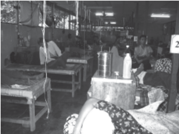
အတွင်းလူနာဆောင်