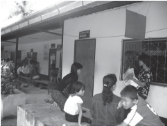
သွေးစစ်ဆေးရာဌာန (ဓာတ်ခွဲခန်း)