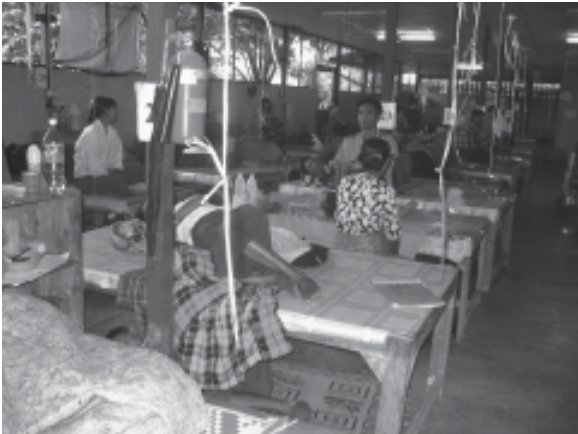
အတွင်းလူနာဆောင်