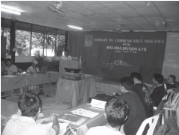
ကျန်းမာရေးညီလာခံကျင်းပနေစဉ်