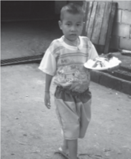
ထမင်းစားတော့မည့် ကလေးငယ်တဦး