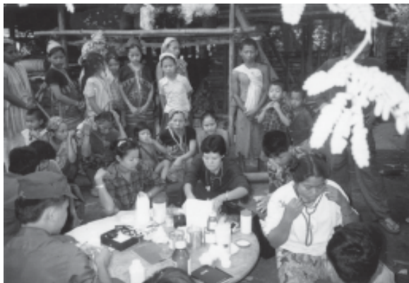
ဖာပွန်ခရိုင်တွင် ကျွန်းမာရေးလုပ်ငန်းများဆောင်ရွက်စဉ် (၁၉၅၀)