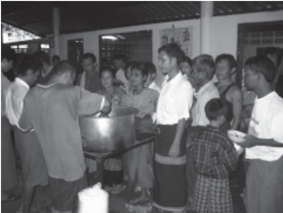
လူနာစားဖို့ဆောင် (ထမင်း၊ ဟင်း ဝေငှနေစဉ်)