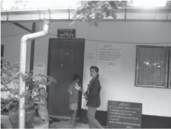
မျက်စိဌာန