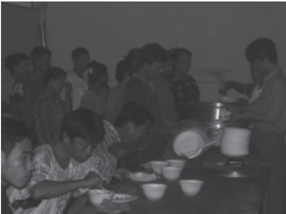
လူနာစားဖိုဆောင် (လူနာနှင့်လူနာစောင့်များ စားသောက်နေစဉ်)