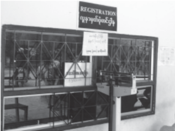
လူနာမှတ်ပုံတင်ဌာန