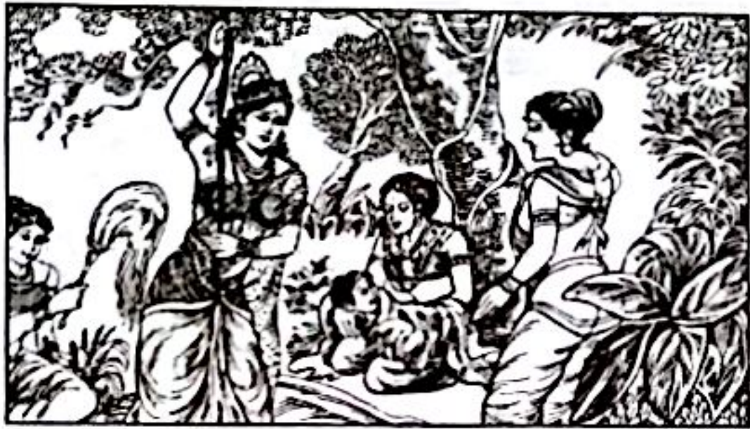
မယ်တော်မဟာမာယာ သားတော်လေးဘား မွေးဖွားခဲ့ပုံ

ဖမ်းဆွဲလိုက်သည်။ သဘာဝတောတောင် အလှအပ အောက်တွင် တာဝင်နစ်မွန်းသွားသည်။ လပြည့်ဝန်းကြီးသည် အနောက်ဘက်သို့ ရုတ်လျှိုးစပြုနေပေပြီ။ တချိန်တည်းတွင် အရှေ့ဘက်၌ပေါ်ထွန်းစ နေမင်းကြီးသည်လည်း အာရုဏ်ဦးရောင်ခြည်ကို မေးနေပေပြီ။