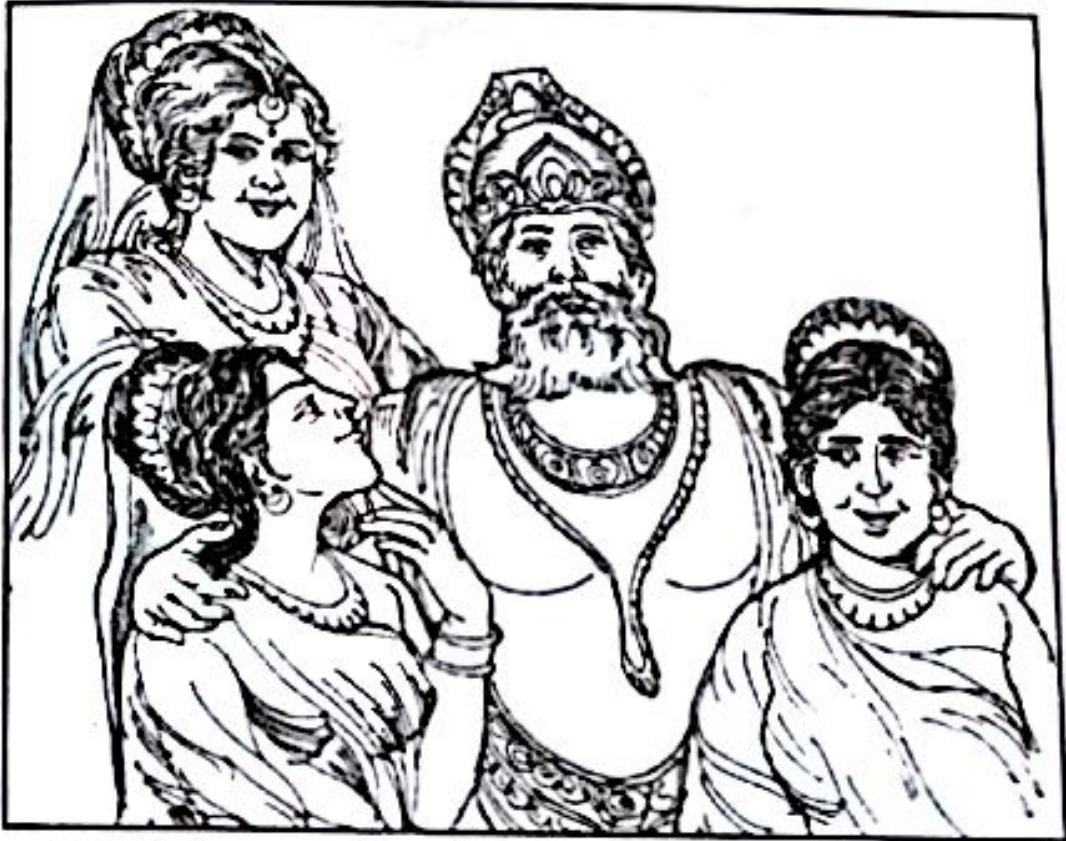
အဗ္ဗနမင်းနှင့် သုလက္ခဏာမိသုရားတို့၏သမီးတော် မဟာမာယာတို့ အတူတွေ့ရပုံ

မဟာမာယာ အရွယ်ရောက်လာသောအခါ မိဘနှစ်ပါးသည် သူမအား အိမ်ထောင်ချပေးရေးအတွက် စဉ်းစားလာကြသည်။ သူတို့သည် သုဒ္ဓေါဒန အကြောင်း သိရှိကြလေသည်။ ၎င်းသည် အိမ်နီးချင်းတိုင်းပြည် ကပ္ပိလဝတ္ထု ပြည်ရှင် ဘုရင်သီဟဟန၏ သားတော်ဖြစ်လေသည်။ သုဒ္ဓေါဒန၏ဖခင် သီဟဟနအား ချဉ်းကပ်နိုင်လျှင် အဆင်ပြေလိမ့်မည်။ လက်ထပ်ထိမ်းမြားမှု ဖြစ်မြောက်အောင်မြင်လိမ့်မည်ဟု တွေးမိကြပေသည်။ ထို့ကြောင့် အဗ္ဗနသည် ပညာရှိများအား ဆင့်ခေါ်ပြီး သမီးအိမ်ထောင်ရေး အတွက် တိုင်ပင်ဆွေးနွေး လေတော့သည်။ ဘုရင်ကြီးသည် ပညာရှိများအား အသေအချာ မှာကြား လေသည်။ ကပ္ပိလဝတ္ထုပြည်ရှင် သီဟဟနအား ချဉ်းကပ်စည်းရုံးရန် သုဒ္ဓေါဒနနှင့် သမီး မဟာမာယာ လက်ထပ် ထိမ်းမြားနိုင်ရေး သဘောတူ ကတိရရှိအောင် ကြိုးစားကြရန် မိန့်ကြားလေသည်။ သုဒ္ဓေါဒနသည် အိမ်ထောင်ဖက်အဖြစ် သင့်တော်သော လူငယ်လူရွယ် တယောက်ဖြစ်ပေသည်။ ကပ္ပိလဝတ္ထုပြည်သို့ ရောက်သောအခါ ပညာရှိများက ဘုရင်သီဟဟနနှင့် တွေ့ကြုံပြီး လာရင်း အကြောင်းကို ပြောဆိုကြလေသည်။ ဘုရင်ကြီးသီဟဟနသည် သူ့သား သုဒ္ဓေါဒနအား