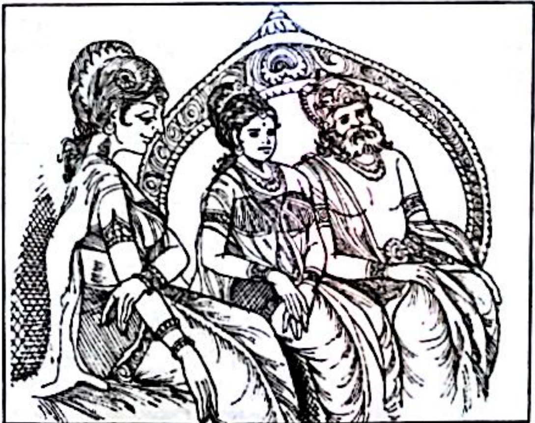
မင်းကြီးသုဇ္ဈောနမှာ သူ၏ မိဖုရားများနှင့် ပျော်ရွှင်နေပုံ

သူပခင် သီဟဟန နတ်ရွာစံတော်မူပြီးနောက် သုဇ္ဈောနသည် ကပ္ပိလဝတ္ထု တိုင်းပြည်တွင် ဘုရင်ဖြစ်လေတော့သည်။ ဘုရင်သုဇ္ဈောနသည် မိဘုရားနှစ်ပါး မဟာမာယာ၊ ပဇ္ဇာပတိနှင့် ပျော်ရွှင်စွာ စံစားလေသည်။ သူတို့ ညီအစ်မသည် အဆင်းလှပရုံသာမက ကောင်းခြင်းငါးဖြာနှင့် ပြည့်စုံသော မိဖုရားများ ဖြစ်ကြလေသည်။ မိဖုရားနှစ်ပါးသည် ဘုရင်ကြီးအား မယားကျင့်ဝတ်နှင့်အညီ အလုပ်အကျွေးပြုကြလေသည်။ ဘုရင်ကြီးက သူတိုင်းပြည်မှာ ပျော်ရွှင်ပါစေဟု မေးသည့်အခါ မိဖုရားနှစ်ပါးက အတိုင်းမသိ ပျော်ရွှင်ကြပါကြောင်း ဖြေကြား ကြလေသည်။ ဘုရင်ကြီးသည် သူမိဖုရားများကို တစုံတရာ အပြစ်ပြောဆိုခြင်း၊ ပုတ်ခတ်ပြောဆိုခြင်း မရှိပေ။ သို့ရာတွင် တခါတခါ စိုးရိမ်ကြောင့်ကျစိတ်များ ဝင်လာသည့်အခါ သူသည် ဆိတ်ငြိမ်ရာ အရပ်တွင် တကိုယ်တည်းထိုင်ပြီး သူမိသားစု ရှေ့ရောက်ကို စဉ်းစားနေတတ်သည်။