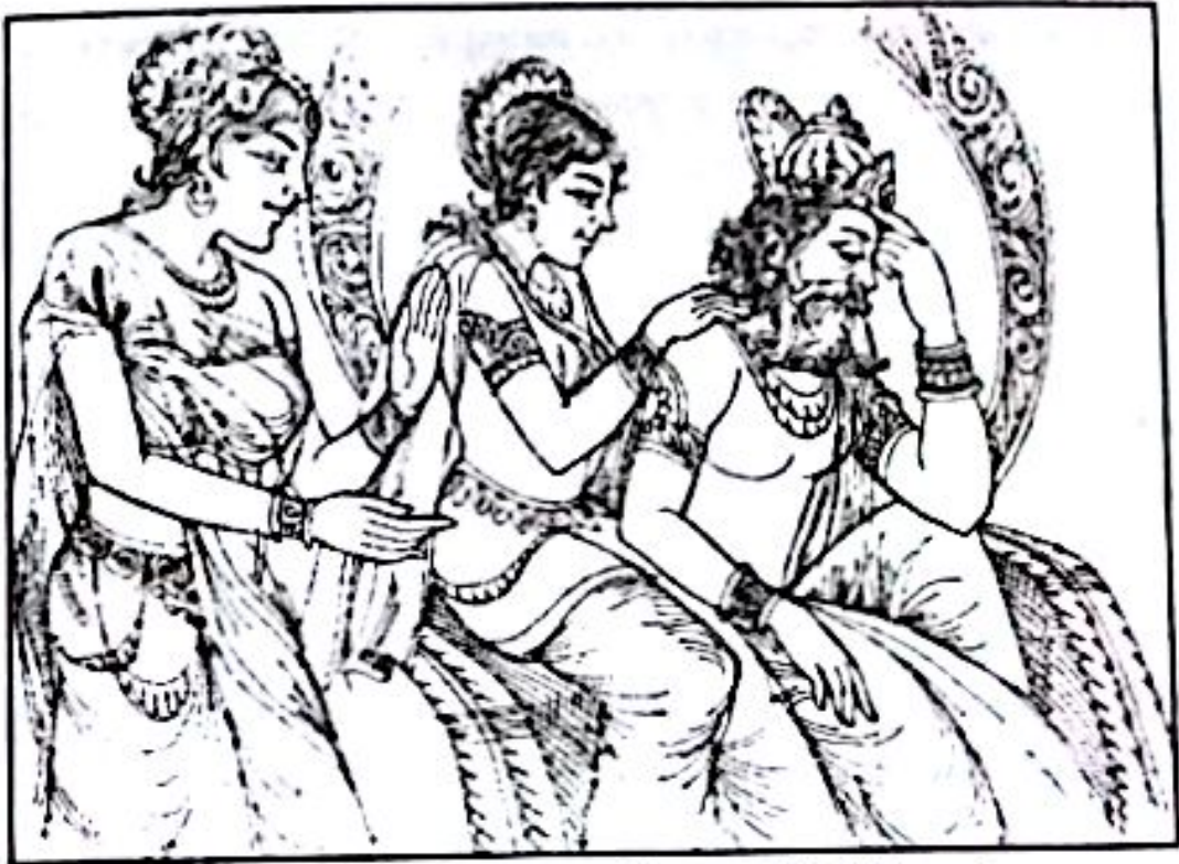
သုခွေဒနမင်းကြီးတို့မှာ သားသမီးရတနာမရှိ၍ ခိုးရိမ်နေရပုံ

အချိန်အတော်ကြာ စောင့်ဆိုင်း မျှော်လင့်ခဲ့ပါသည်။ ယင်းသည်ပင် သားတော် အတွက် ဝမ်းနည်း စိတ်မကောင်းဖြစ်ရခြင်း အကြောင်း ဖြစ်ပါသည်” ဟု ဘုရင်ကြီးအား ပြောပြလေသည်။ ဘုရင် သုခွေဒန၏ ရှင်းပြပြောဆိုခြင်းကို မဟာမာယာနှင့် ပဇ္ဇာပတိတို့ကြားသောအခါ သူတို့ မိဖုရားနှစ်ပါးလုံး တုန်လှုပ်ခြောက်ချားသွားပြီး စိတ်မငြိမ်မသက် ဖြစ်ကြလေသည်။ သူစိုးရိမ်ပူပန်သည့် အကြောင်းမှာ အမွေဆက်ခံမည့် သားသမီး မထွန်းကားခြင်း ဖြစ်ကြောင်း သိရှိကြလေသည်။ ယောက္ခမ ဘုရင်ကြီးသည် မဟာမာယာ၏ အခြေအနေကို အကဲခတ်ရင်း သားကို ပြောသည်မှာ “သားတော် ဤအရာသာလျှင် သင်စိုးရိမ်ပူပန်ရခြင်း အကြောင်းရင်း စစ်မှန်ဖြစ်သလော။ သင်မစိုးရိမ်ပါလင့်၊ အကယ်၍ ဤအကြောင်းသည်သာ တခုတည်းသော အကြောင်းဖြစ်လျှင် ငါသည် တပက်ကမ်းခတ် တတ်မြောက် ကျွမ်းကျင်သော သမားတော်တို့အား ခေါ်ယူပြီး သင့်တို့အား စစ်ဆေးကြည့်မည်။ ခမည်းတော် အနေနှင့် အားလုံး အဆင်ပြေသွားလိမ့်မည်ဟု မျှော်လင့်သည်။” ဤသို့ဖြင့် ဘုရင်ကြီး သီဟဟနသည် သုခွေဒန၊ မဟာမာယာ၊ ပဇ္ဇာပတိတို့ကို အားပေးစကား ပြောကြားပြီး အဆောင်တော်သို့ ပြန်သွားလေတော့သည်။ အဆောင်တွင် ဘုရင်ကြီးသည် သူ၏ချစ်လှစွာသော မိဖုရားကြီး ကာဆနအား