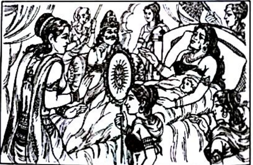
သူမမရှိတော့သည့်နောက်ပိုင်းတွင် သိဒ္ဓတ္ထမင်းသားငယ်လေးအား စောင့်ရှောက်ပါရန် မဟာမာယာမှ ပဇ္ဇာပတိအား မှာကြားနေပုံ

သူမသည် ညီမငယ်ပဇ္ဇာပတိအပေါ်တွင် ယုံကြည်မှုအပြည့်ရှိလေသည်။ ပဇ္ဇာပတိအား ပြောသည်မှာ “ညီမ ငါ့ကလေးသည် မကြာခင် အမိမဲ့သား ဖြစ်ရတော့မည်။ သူ့ကိုပြုစုပျိုးထောင်ပေးရေး ကိစ္စအတွက် ငါအရမ်းပဲ စိတ်ပူမိသည်။ ငါ့အတွက်ဘာမှ စိတ်မကောင်းမဖြစ်နဲ့၊ ငါသေရတော့မယ်။ သေမင်းက ငါ့ကိုခေါ်နေပြီ။ အင်မတန် ခွင့်ပြုပါ ဥညီမ” ဟုပြောပြောဆိုဆိုဖြင့်