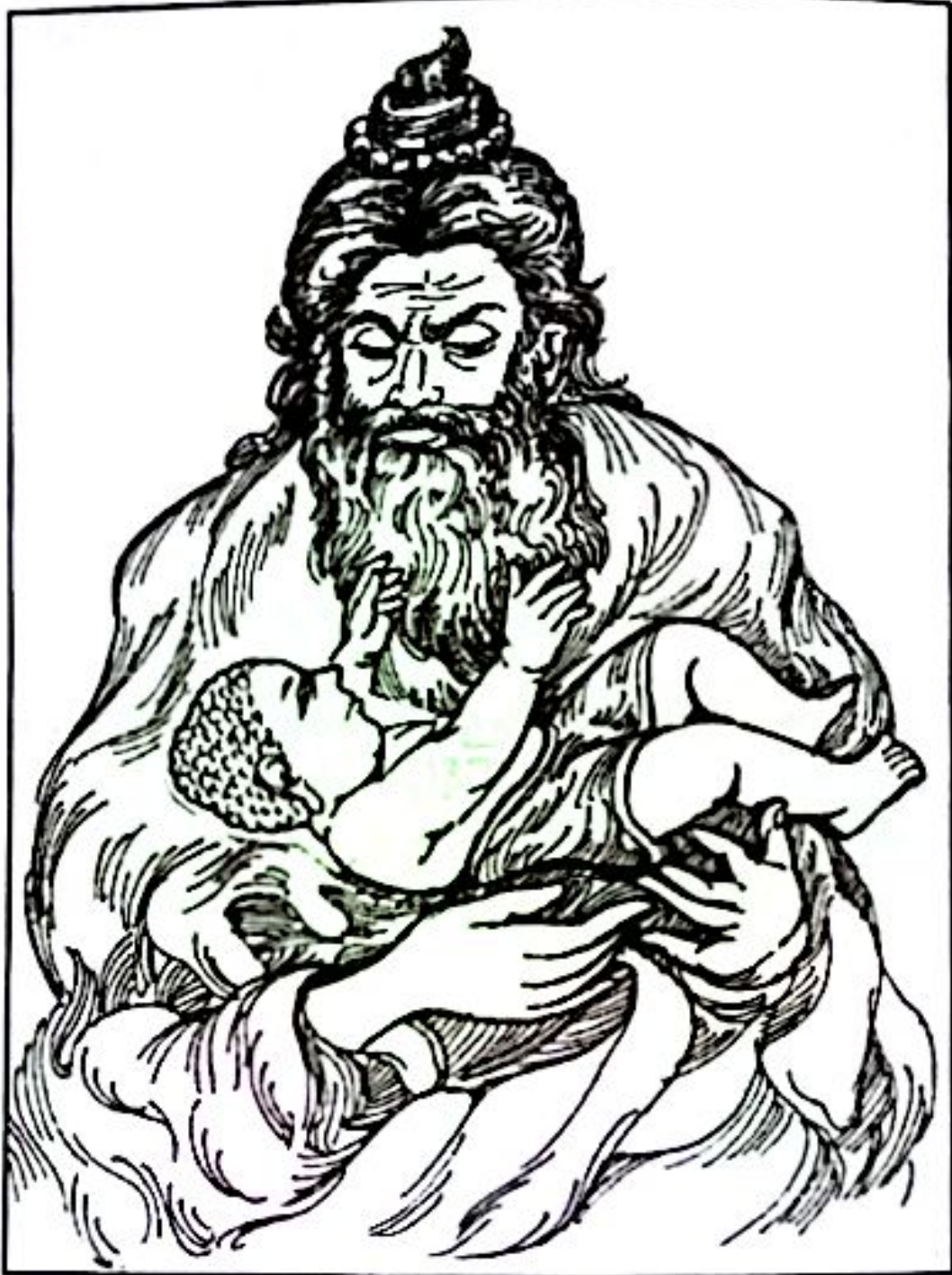
အဘိတယ သိဒ္ဓတ္ထ၏ လက္ခဏာကို ကြည့်ရှု

ရွေးနှုတ်ကယ်တင်လိမ့်မည်။ အဘိတရသေ့ကြီးက ဤကလေးသည် နန်းတွင်း အမှုကိစ္စတွင် ပျော်ပိုက်လိမ့်မည် မဟုတ်ဟု ကောင်းစွာသိရှိလေသည်။