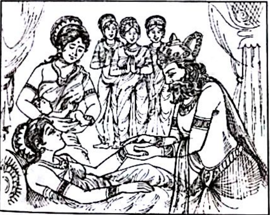
သုဓမ္မီဒနပင်းကြီးမှာ မဟာမာယာမကျန်းမာသည့်အတွက် ပရိဘောဂသောကမီး တောက်လောင်နေပုံ

မည်သည်သမားတော်မှ မဟာမာယာ၏ ရောဂါအား မကုသနိုင်ပါ။ မည်သည် ဆေးဝါးမျှ အကျိုးသက်ရောက်မှုမရှိပါ။ သူမသည် မကြာခင်