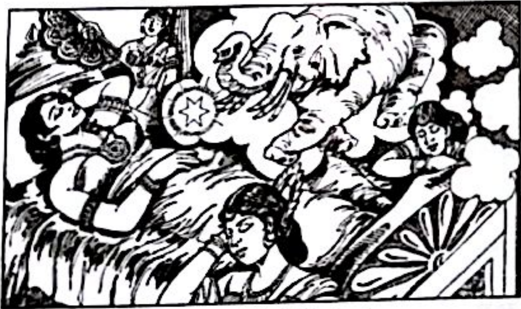
မဟာမာယာ အိပ်မက် မြင်မက်နေပုံ

ကျွန်တော်တို့ အားလုံး အိပ်မက်မက်ဖူးကြသည်။ တကယ်တော့ အိပ်မက်သည် အိပ်မက်မျှသာဖြစ်သည်။ အားလုံးသော အိပ်မက်များသည်လည်း အိပ်မက်အတိုင်း အနှစ်တကယ်ဖြစ်မလာပါ။ ယေဘုယျအားဖြင့် အိပ်မက်များသည် လက်ဆုပ်လက်ကိုင် ဖြစ်ရသော အရာများမဟုတ်ကြပေ။ သို့ဖြစ်၍ အိပ်မက်များသည် လက်တွေ့ဘဝနှင့် ခြားနားသည်ဟု အများစုက လက်ခံထားကြသည်။ မဟာမာယာ၏ အိပ်မက်သည်ကား သမိုင်းဝင်အိပ်မက်ဖြစ်လေသည်။ အိပ်မက်နှင့် ပတ်သက်၍ ဆွေးနွေးငြင်းခုံ ကြသည့်အခါတိုင်း မဟာမာယာ၏ အိပ်မက်အကြောင်း ထည့်သွင်းပြောဆိုလေ့ရှိကြသည်။ အိပ်မက်များသည် ကျွန်ုပ်တို့ အလိုမပြည့်ဝမှုများကို ရောင်ပြန်ဟပ်သည့် သဘောသဘာဝ၊ သရုပ်သကန်ဟုလည်း ယုံကြည်ကြသည်။ မည်သို့ဆိုစေ အိပ်မက်သည် လူ့ဘဝ၏ အရေးပါသော အစိတ်အပိုင်းတခုဖြစ်ပေသည်။ အိပ်မက်မက်ခြင်းသည် ကောင်းသည်ဟု ဆိုကြပေသည်။