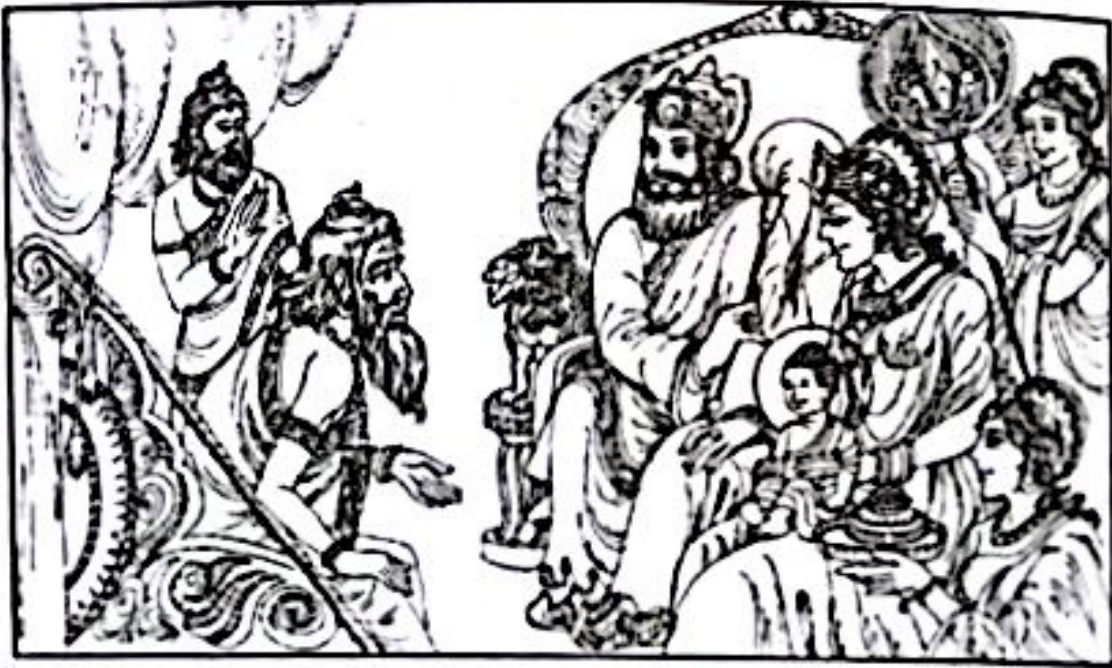
ဘဝိတရသေ့ကြီးနှင့် သုခွေဒန၏ ပိသားစုများပုံ

အရိုသေပေးပြီး တောင်းပန်လျှောက်ထား ကြလေသည်။ တပည့်တော်တို့နှင့် အတူ ဘုရင်နန်းတော်သို့ လိုက်ပါရန် ပင့်ဖိတ်ကြလေသည်။ ထိုအချိန်တွင် ဘုရင်ကြီး သုခွေဒနသည် ရသေ့ကြီးအား တွေ့ချင်စေဖြင့် စောင့်မျှော် နေလေသည်။ ဘဝိတသည် ဝန်ကြီးများနှင့်အတူ ပြည်ပြည် ကြွလှမ်းလျှက် သူ၏တူတော် နာလက (Nalaka) ကိုပါ ခေါ်ဆောင် သွားလေသည်။ လူထုကြီးသည် ရသေ့ကြီးအား အော်ဟစ်ကောင်းချီးပေးပြီး ပန်းပွင့်များဖြင့် ကြဲဖြန့် ကြလေသည်။ သက်ဝင်ယုံကြည်သော လူများက သူ၏ခြေတော် အစုံကို ရေနှင့်ဆေးပြီး ကောင်းချီး မင်္ဂလာကို ခံယူကြ လေသည်။