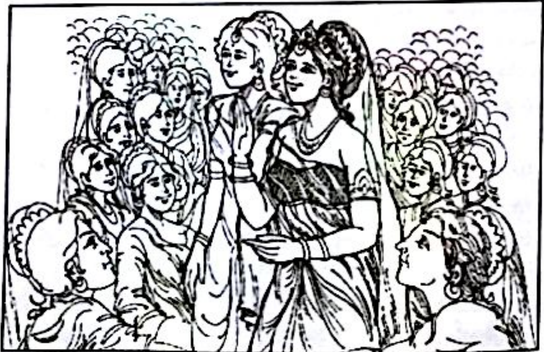
ကပ္ပိလဝတ္ထုပြည်မှာ သတို့သမားနှင့် သတို့သမီးတို့အား ကြိုဆိုနေပုံ

သူတို့ပြောပုံမှာ “ဘုရင်ကြီးသင်သည် ပညာရှိတယောက်ပါ။ အကယ်၍သင်ဤကဲ့သို့ ပြုမူဆောင်ရွက် နေမည်ဆိုလျှင် အခြားသူများလည်း စိတ်သောက ရောက်ကြလိမ့်မည်။ သမီးတော်နှစ်ပါးအား လက်ထပ်ထိမ်းမြား လိုက်ပြီးပါပြီ သူဆင်းရဲပဲဖြစ်ဖြစ်၊ လူချမ်းသာပဲဖြစ်ဖြစ်၊ ပညာဉာဏ်ကြီးသူပဲ ဖြစ်ဖြစ်၊ ပညာဉာဏ် နည်းသူပဲဖြစ်ဖြစ် သမီးများကို တနေ့နေ့တွင် ခင်ပွန်းသည် အိမ်သို့ ပို့ရမည်ဖြစ်ပါသည်။ ဤသည်ကား ဇမ္ဗူဒီပ ကျွန်း၏ လေ့ထုံးထမ်း အစဉ်အလာ တခုပင်ဖြစ်လေသည်။ (ယနေ့ကာလတွင်လည်း အိန္ဒိယနိုင်ငံတွင် သမီးများကို ခင်ပွန်းသည်အိမ်သို့ ပို့ကြရပါသည်။) သင်၏ သမီးတော်များသည် အလွန်ဝေးကွာသော နေရာသို့ သွားကြသည် မဟုတ်ပါ။ ဘုရင်ကြီး အလည်အပတ် သွားချင်ရင်လည်း အခက်အခဲမရှိပါ။ သူတို့သည် အိမ်နီးနားချင်းတိုင်းပြည် ကပ္ပိလဝတ္ထုပြည်တွင် ရှိကြပါသည်။ သင်သွားချင်သည့် အခါတိုင်း သွားရောက်လည်ပတ်နိုင်ပါသည်။ ဘုရင်ကြီးလည်း စိတ်သက်သာရာ ရသွားလေသည်။ မင်းချင်းများနှင့် ဆွေမျိုးများ၏ တရားချပြောကြား ချက်ကြောင့် သူသည် သတိပြန်ဝင်ကာ စိတ်ကိုထိန်းပြီး နိုင်ငံ့အုပ်ချုပ်ရေး ကိစ္စများကို ပြန်လုပ်လေတော့သည်။