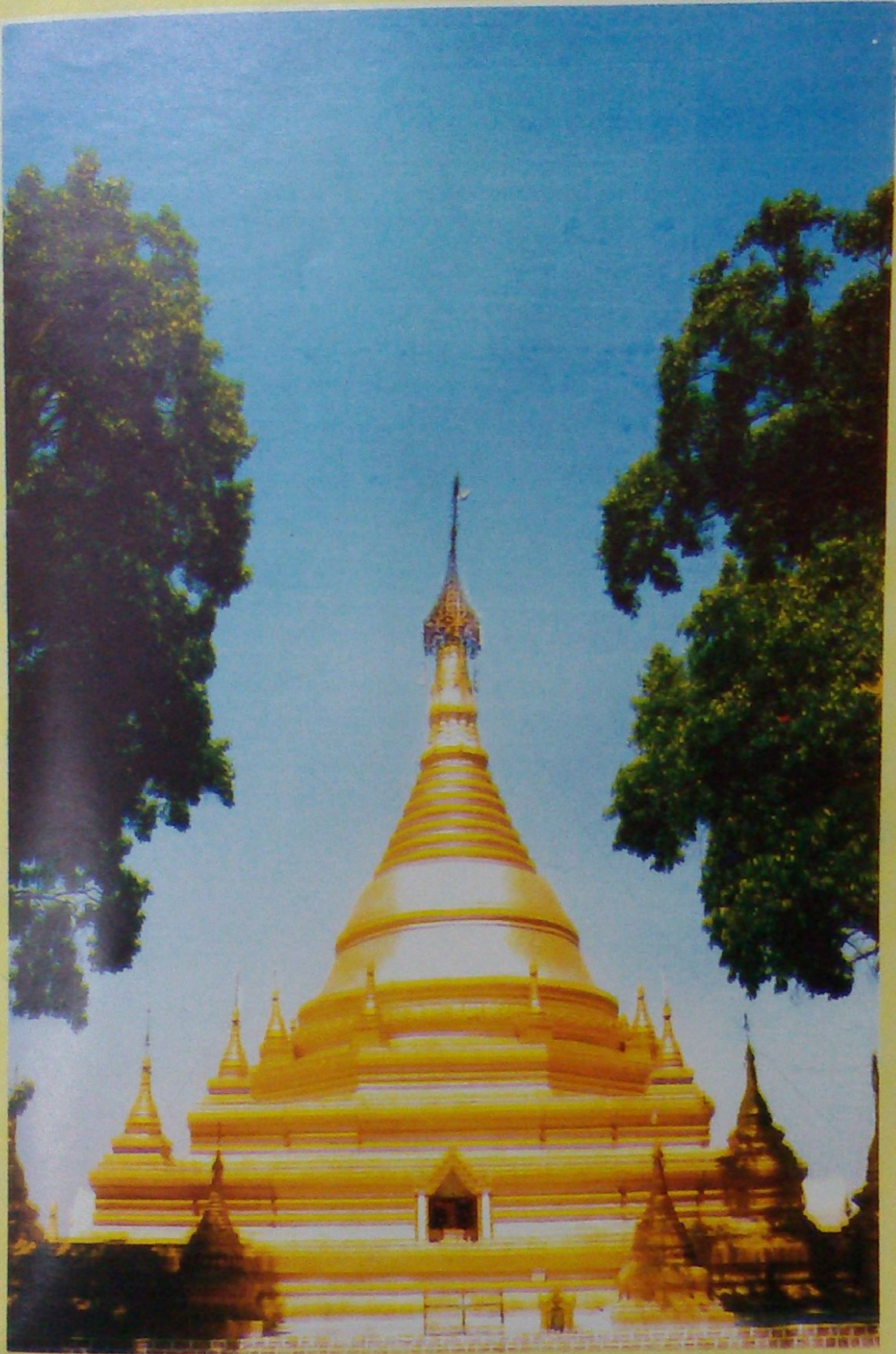
ပြက္ခရွေ့စွယ်တော်ရှင် စေတီတော်