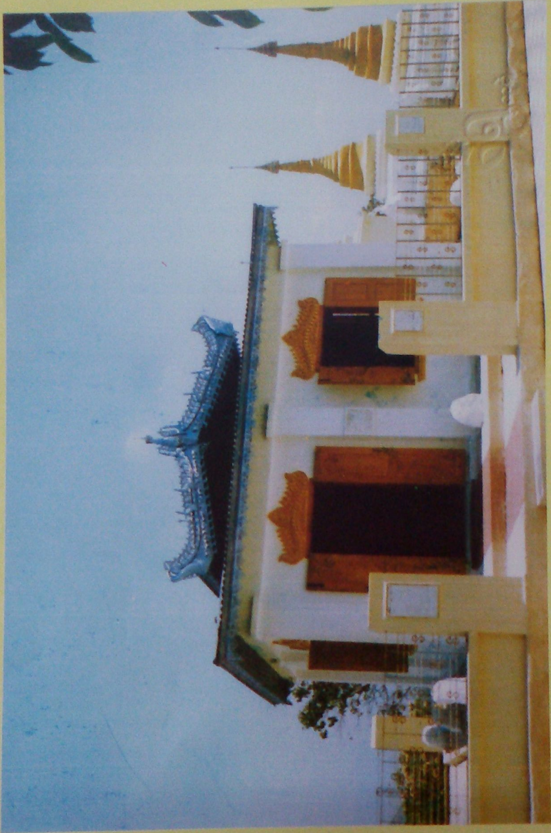
ပြက္ခဒိန်တော်ရင် စေတီတော် ရင်ပြင်ရှိ ရှင်အရဟံသိမ်