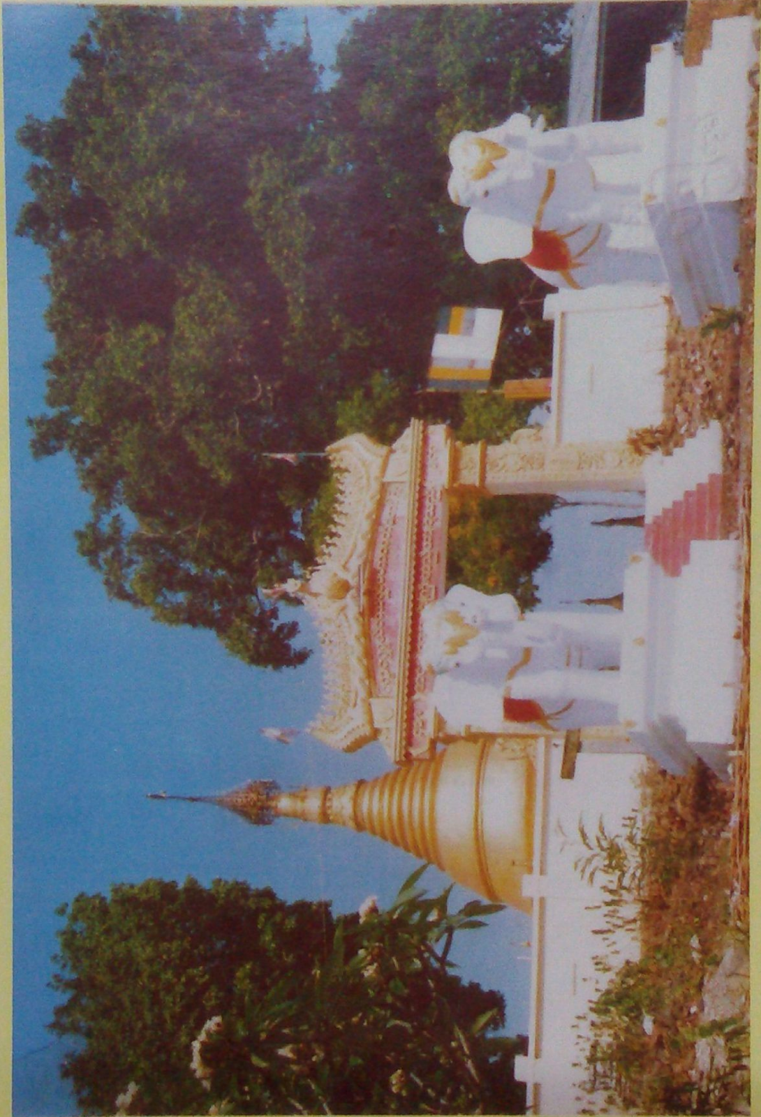
ပြက္ခဒိန္နာတော်ရှင် စေတီတော် မုခ်ဦး