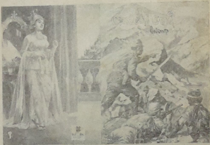
ပြည်လုံးကျွတ် စာပေဖြန့်ချိရေးဌာန ပလင်စတားစာပေ အမှတ် ၂၇၆၊ ဘားလမ်း၊ ရန်ကုန်မြို့။

သိဒ္ဓိဗလ ရောင်စုံပုံနှိပ်တိုက်၊ ၇၈ အထက်ပန်းဆိုးတန်း၊ ရန်ကုန်