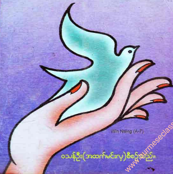
Win Naling (A-7)