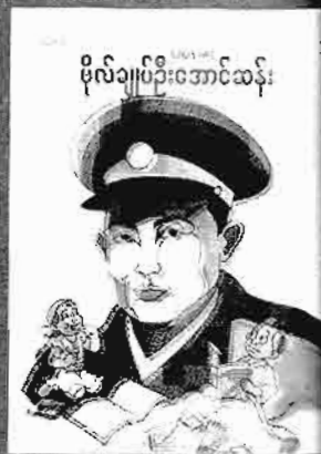
မြို့တော်မှ အောင်ဆန်း မိုလ်ချုပ်ဦးအောင်ဆန်း တန်ဖိုး - ၂၀၀၀ ကျပ်