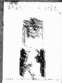
မိုလ်ချုပ်အောင်ဆန်းအတ္ထုပ္ပတ္တိ မူပိုင်ခွင့်ပြုပေးပေးမှုအတွက် (ရဲဘော်သုံးကျိပ်) မူပိုင်ခွင့်ပြုပေးပေး တန်ဖိုး - ၈၀၀၀ ကျပ်