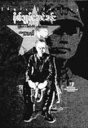
ပိုလ်ချုပ်အောင်ဆန်း မိုလ်ချုပ်အောင်ဆန်းအတ္ထုပ္ပတ္တိရုပ်ပြန် တန်ဖိုး - ၅၀၀၀ ကျပ်

ပထမဦးဆုံးအထွေထွေအောင်ဆန်း အတ္ထုပ္ပတ္တိ ရုပ်ပြန်နှင့် ကာတွန်းအုပ်