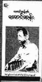
အောင်ဆန်း၏ အောင်ဆန်း မိုလ်ပလိမေဝေါင် တန်ဖိုး - ၁၀၀၀ ကျပ်