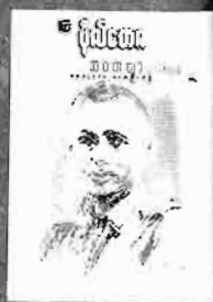
မိုလ်ပလိမေဝေါင် အောင်ဆန်း Quality တတည်အာဒွီ တန်ဖိုး - ၆၀၀၀ ကျပ်