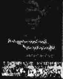
မိုလ်ချုပ်အောင်ဆန်းနှင့် ရဲဘော်သုံးကျိပ် မိုလ်ပလိမေဝေါင်(ရဲဘော်သုံးကျိပ်) တန်ဖိုး - ၅၀၀၀ ကျပ်