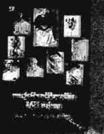
အာဇာနည်ခေါင်းဆောင်ကြီးများ လုပ်ကြံမှု မိအိုင်မီ အခန်းကဏ္ဍ ရဲဘော်သုံးကျိပ်(ရဲဘော်သုံးကျိပ်)ပြင် တန်ဖိုး - ၁၀၀၀ ကျပ်