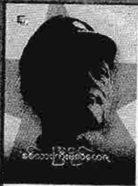
ခင်သားကြီးမိုလ်ပလိမေဝေါင် Quality တတည်အာဒွီ တန်ဖိုး - ၈၀၀၀ ကျပ်