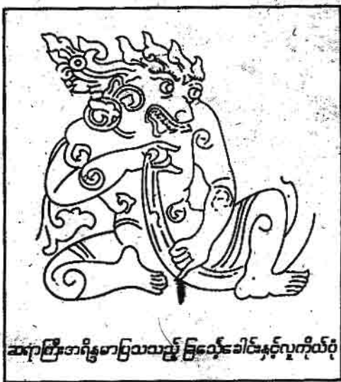
ဆရာကြီးအရိန္ဒမာပြသသည့် ခြင်္သေ့ခေါင်းနှင့်လူကိုယ်ပုံ

ဟု ပြောရင်း စာအုပ်နောက်ကျောဖုံးမှ အောက်ပါပုံကို ထုတ်ပြလေတော့၏။