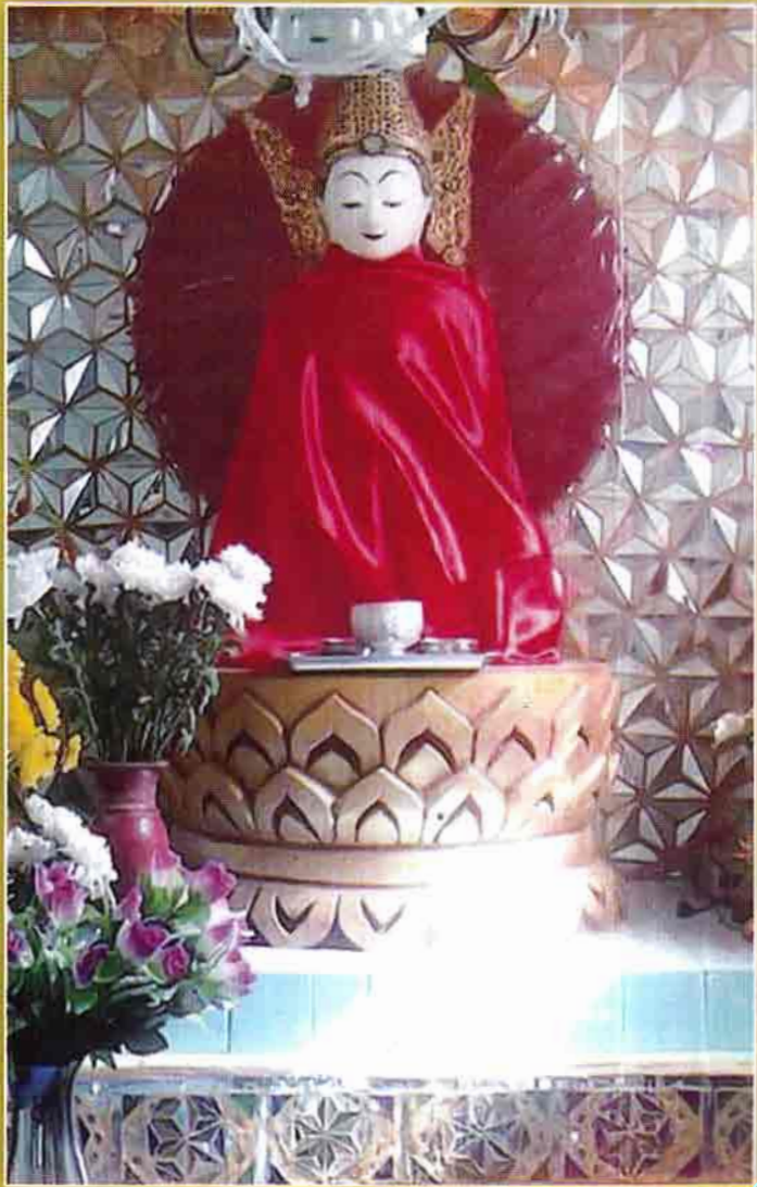
ပေါ်တော်မူ ကပ်ကျော်မြတ်စွာဘုရား