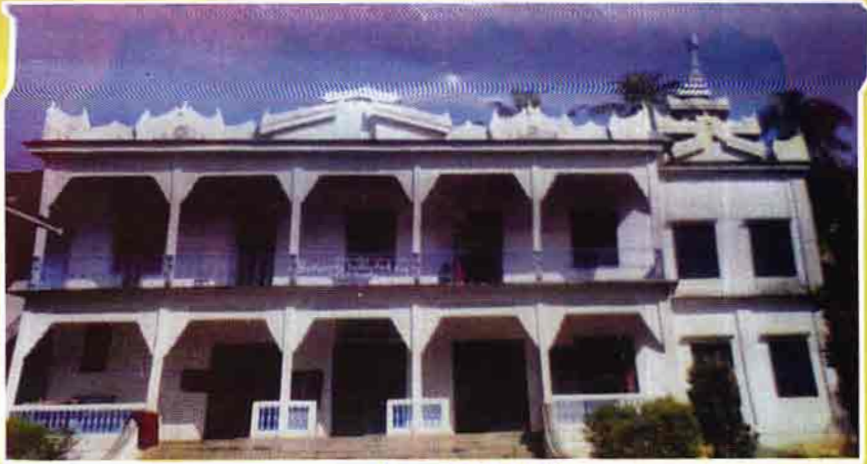
လေတင်ကျောင်းတိုက်ကြီး