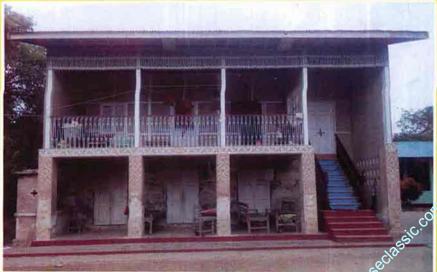
ဆရာတော် သီတင်းသုံးရာ ကျောင်း။