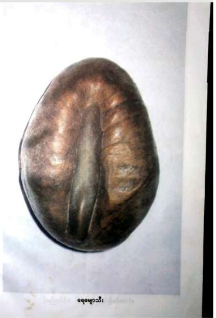
ရေမျှာသီး