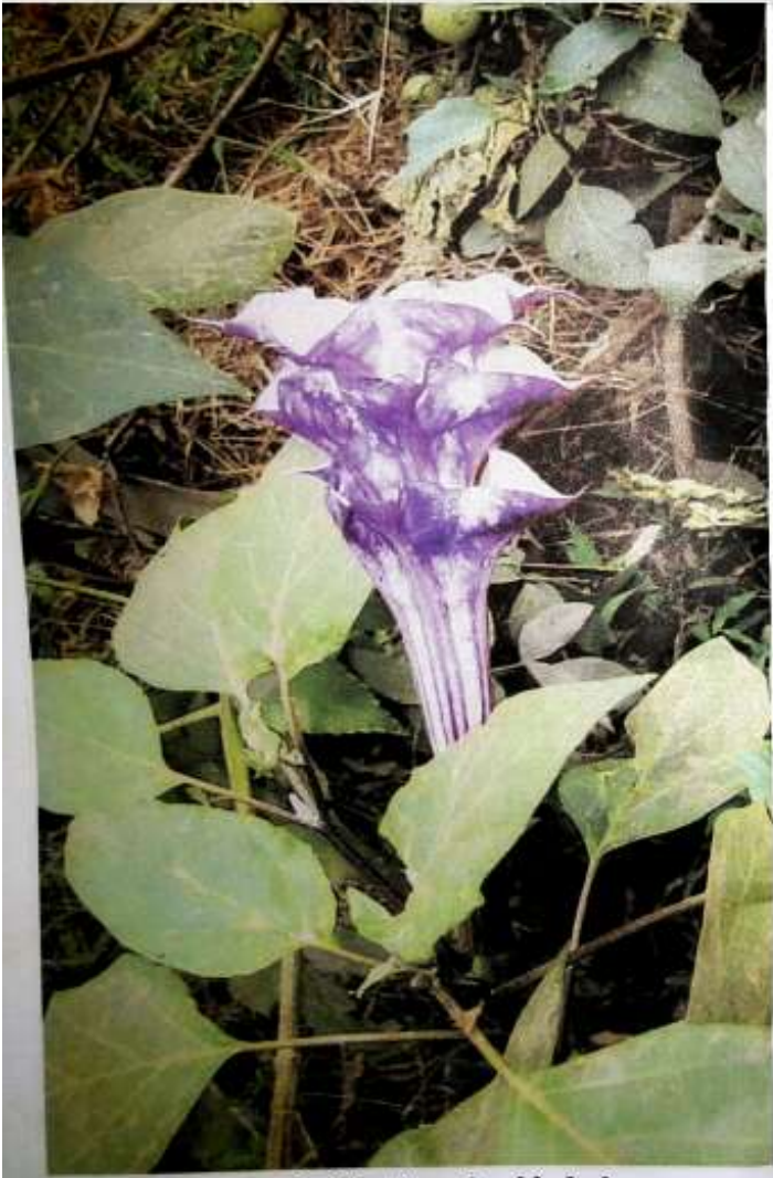
သုံးထပ်ပခိုင်း သို့မဟုတ် ပခိုင်းညိုပင်