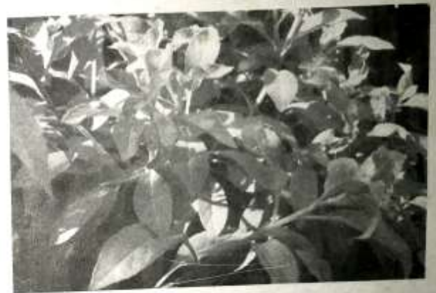
ဆီးချို သွေးချိုရောဂါ ဝေဒနာရှင်များအတွက် ပျားမြီးရွက်အပင်နှင့် ပတ်သက်၍ ၃