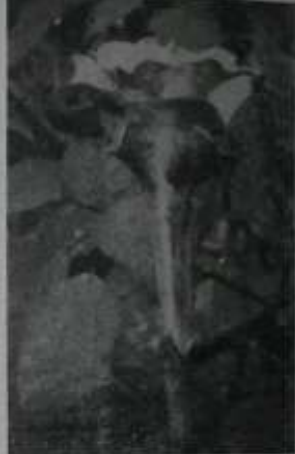
သုံးထပ်ပုဒ်ဦးညို အနီးကပ်မြင်ရင်းအပူ

အဖွဲ့ ရေတွင်း နှင့် ရေကန်များ၊ နွေးဟောင်း အုတ်များကို လိုက်လံ ပြသရုံမက ကျောင်းတော် ကြီး ခါး အကွယ်အဝန်း ၁၅ ဧက ခန့်ကို လက်ညှိုးညွှန် ပြသရာတွင် အရှေ့ ဆက်ရှိ စေတီပုထိုးသည် အနောက် ဆက်ရှိ ညောင်ပင်ဝတ်တို့ အထိပေါ် ဟု ပြသ ရှင်းပြခဲ့လေသည်။