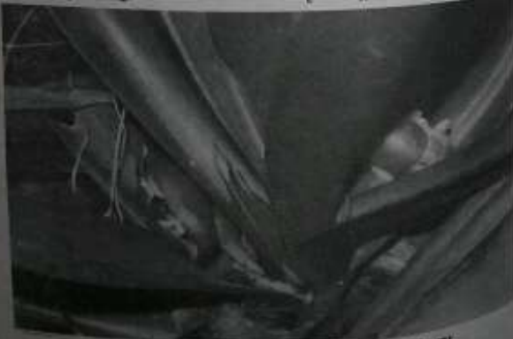
ဆေးဖက်ဝင် မီးကွင်းဂမုန်း၊ ဆပင်၏ အပွင့် အဖူးများ

ဆောက်ပုံကိုက အပူသမား အအေးသမား ဆိုတာ ရှိသလို ရပ်တည်ချက်ကို