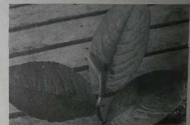
မဟာဂါကြိဆစ်အပင်နှင့် ဆေးအဖွမ်း

မန္တလေးမြို့မှ အငြိမ်းစား ဦးကိုကိုကြီးတစ်ယောက် ဝီဆောင်းပါးကိုလည်း တွေ့ရှိ မှတ်တမ်းပေးလို့ မျှော်လင့်လျက်။