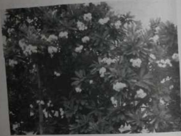
ဆေးဖက်ဝင် အကျော်ပင်နှင့် ဆေးအစွမ်း

စာရေးသူသည် ပျဉ်းမနားလုပ်ငန်းဖြင့် ဘဝရပ်တည်သူပါ။ မိသားစုလုပ်ငန်း အဖြစ် လုပ်ကိုင်ဆောင်ရွက်လာတာ ဆယ်စုနှစ်များစွာ ရှိခဲ့ပါပြီ။ မိသားစု ဘဝ ရပ်တည်လုပ်ငန်းအဖြစ် စာရေးသူနှင့် သားသမီးမြေးမြစ်များ ဝိုင်းဝန်း၍ သိပ်ပင်၊ စားပင် အလှဆင်ပင်နှင့် အလှပန်းပင်များကို လက်လှမ်းမီသမျှ ဝယ်ယူစုဆောင်း ရိုက်ပျိုး၍ မြို့ပွား ထုတ်လုပ်နေခဲ့တာပါ။ ပုံမှန် လုပ်သားများမထားဘဲ ကိုယ်တိုင် ဦးဆောင်လုပ်ကိုင်ပြီး သားသမီးတွေကိုလည်း ဝိုင်းဝန်း လုပ်ကိုင်စေခြင်းဖြင့် လက်တွေ့ လုပ်ငန်း အတွေ့အကြုံနှင့် ကျွမ်းကျင်မှုလုပ်ငန်း ဝဟုသုတ သဘော သဘာဝများကို သားသမီးများကို အမွေဆက်အဖြစ် ရရှိစေနိုင်ခဲ့ပါသည်။ ထိုကဲ့သို့ လုပ်ကိုင်ဆောင်ရွက်နေရာတွင် မိသားစု ဝင်ငွေရရှိရေးကိုသာ တစ်ခုတည်း ဦးစားလုပ်ကိုင်ခြင်းမရှိ မဟုတ်ဘဲ ရိုက်ပျိုးမြို့ပွား၍ လွယ်ကူပြီး ဆေးစွမ်းထက်လှသော လက်လှမ်းမီသမျှ ဆေးဖက်ဝင် အပင်မျိုးများကို ရွာဖွဲ့ စုဆောင်း၍ ဆက်လက် ရိုက်ပျိုးမြို့ပွားကာ ဆန္ဒရှိသော လိုအပ်နေသူများကို အခမဲ့ပေး ကူညီပေးခဲ့တာလည်း ကြာပါပြီ။