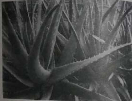
အထက်လှန်အောက်လျှော့ ရောဂါဝေဒနာအတွက် ဆေးစွမ်းထက် ရှားစောင်းလက်ပပ်အမြစ်