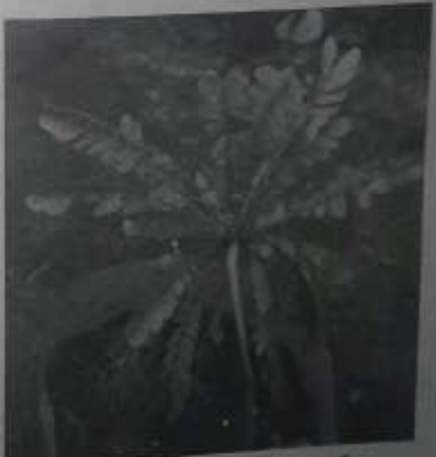
ထိကရုံးမင်းအပင် ထိပ်ရွာတွင် ဆရာထံမှာ ရှိပြီဆိုတဲ့ ဝင်ခေါင်းဆောင်ခြေမှ ဖြစ်ရမဲ့။