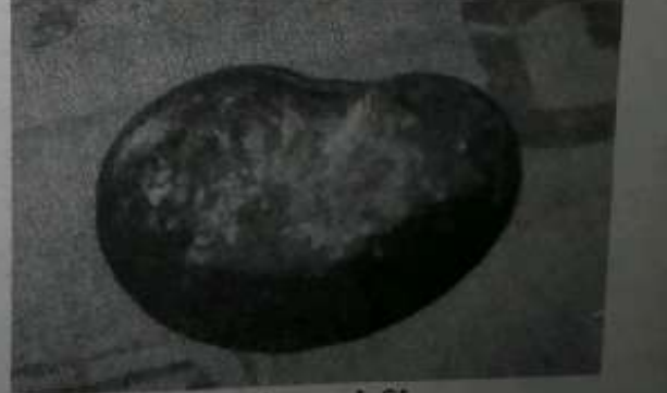
ရောဖျားသီး ဆေးတက်အမြင်

ထို့နောက် ဦးကိုကိုကြီး ဆက်ပြောလာတာ 'အဲဒီ ပစ္စည်းလေးမျိုး အလေးချိန် ဆတူ စုဆောင်းပြီး ကြော်စားတာဗျ' ဟု ဆိုပါသည်။