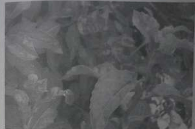
ဆီးချို သွေးချို ရောဂါဝေဒနာအတွက် ပျားမြီးရွက် အပင်နှင့် ပတ်သက်၍ ၉

အစားအသောက်ကြောင့် အဓိက ဖြစ်ရသည့် ဆီးချို သွေးချိုရောဂါ ဝေဒနာမျိုးကို တိုက်ဖျက်ကုသ ကာကွယ်ကြရာတွင် အခြေခံလိုက်နာဆောင်ရွက်ရမည့် မတည့်သော အစားအသောက်များကို ဆင်ခြင်၍ စားသောက်ရမှာ ဖြစ်သလို လိုအပ်သည့် ကိုယ်လက်လှုပ်ရှားမှုကိုလည်း မိမိနှင့် သင့်တော် အဆင်ပြေသမျှ ပုံမှန်လိုက်နာ လုပ်ဆောင်နေရန် လိုအပ်သလို ရောဂါအတွက် သင့်တော် အဆင်ပြေသော ဆေးဝါးများကိုလည်း မဖြတ်မီခံနေရမှာ ဖြစ်ပါ၏။