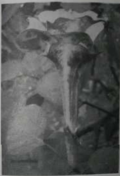
သုံးထပ်ပခိုင်၊ သို့မဟုတ် ပခိုင်ညိုနှင့်ဆေးအစွမ်း