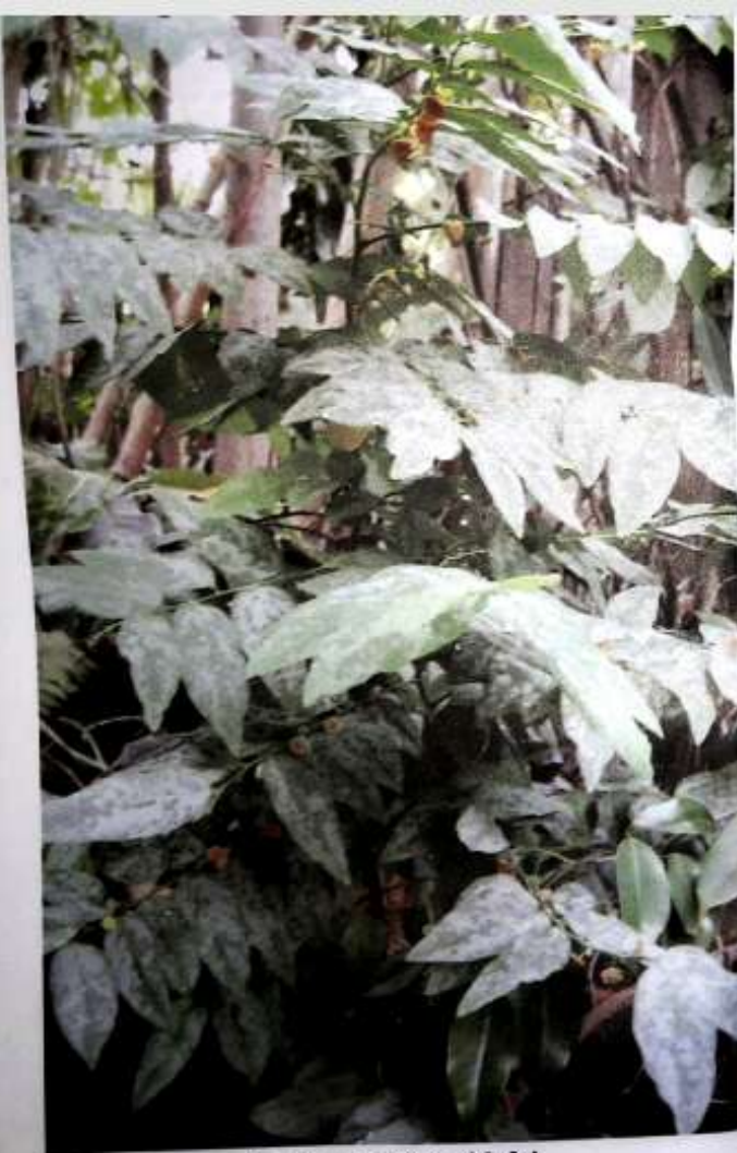
ကြက်သဟင်းပင် (အရိုင်းမျိုး)