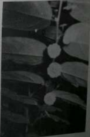
ကြက်သဟင်းကိုင်းနှင့် အပွင့်များ။

သမားတော် ဆရာမော် ပြောပြသည်မှာ ကြက်သဟင်း အပင်များကို ပျဉ်းမုန်း တောရကျောင်း ကျောက်ကုန်းတွေပေါ်မှာ သဘာဝအတိုင်း ပေါများစွာ ပေါက်နေတာကို တွေ့ရကြောင်း အရွယ်ရောက်သောအပင်များ ပွင့်၍ အသီးများ သီးကြောင်း အစေ့များ ပြေမှာကျပေါက်ပြီး အပင်ငယ်များစွာ ရုနိုင်ကြောင်း အပင်ငယ်များကို တူးနုတ်ပြီး ပြောင်းရွှေ့ ခိုက်ပိုးပိတ် ရကြောင်း၊ အချို့သော ကြက်သဟင်းအပင်များသည် ဝါးတစ်ပြန်လောက်အထိ မြင့်တက်ပြီး ကိုင်းပွားများစွာနှင့် ဝေဆာနေလေ့ရှိကြောင်း သိရပါ၏။