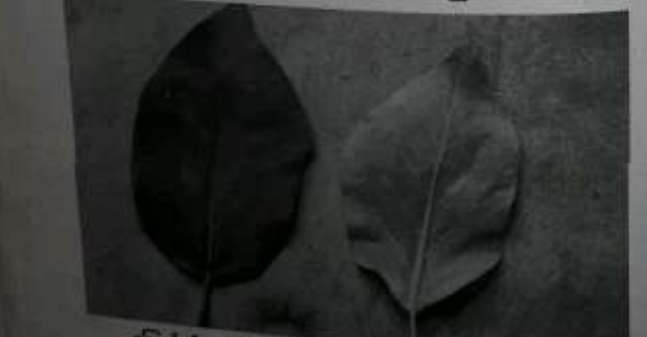
ကြောင်ပန်းရွက်၏ အပေါ်ဘက်မျက်နှာနှင့် အောက်ဘက်မျက်နှာ။

အရွက်ပုံသဏ္ဍာန်မှာ လှဲသွားပမာ အဖျားပိုင်းကြီး၍ ဝိုင်းပြီး အဖျားပိုင်း ထိပ်ချွန်၏။ အရင်းပိုင်း သေးသွယ်သွား၏။ အရွက်ရင်းမှ အဖျားအထိ 2 1/2 လက်မ ခန့်နှင့် အနံ တစ်လက်မကျော်ကျော် ရှိပေသည်။