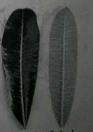
အကျော်ရွက် အပေါ်မျက်နှာနှင့် အောက်ဘက်မျက်နှာ

ဆရာကြီး ကြည်အောင် ပြန်ပြောပြတာက 'ကျပ် လုံးခန့် အရွယ် အကျော် ပင်ကိုင်း တစ် တောင်းခန့်ကို နှစ်နှစ်စဉ်း၍ မြေထဲ၌ တစ်လုံးတွင် ထည့်ပါ။ ထိုနှစ်နှစ်စဉ်း အဖတ်များကို ဆန်ဆေးရည်ဖြင့် နှစ်ည စိပ်ပါ။ ဆန်ဆေးရည်ကို နှစ်ပုလင်း ပို၍ ထည့်ရန်နှင့် ထို စိပ်ရည်ကို မနက် တစ်ကြိမ် ည တစ်ကြိမ် နှစ်ကြိမ်ခန့် သစ်သား ဇွန်း၊ ယောက်မပြိုင် သမ သွား အောင် မွေမွေ ပေးပါ။