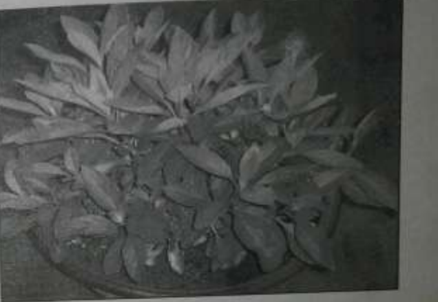
ဆီးချို သွေးချိုရောဂါ ဝေဒနာရှင်များအတွက် ပျားခြီးရွက်အပင်နှင့် ပတ်သက်၍ ၆

နေပြည်တော်မှ ပျားခြီးရွက်အပင်လာယူသော မိန်းကလေးများ စာရေးသူ ခြံပြင် အသိပေးတာကို ကြားသိသွားကြပြီးနောက် အပြုံးမျက်နှာ မျှော်လင့်ချက် များစွာဖြင့် စာရေးသူကို ဦးခိုက် ကန်တော့ပြီး ပျားခြီးရွက်ပို့ပေးပေးလေးများကို ထယ့်ထယ် သယ်ယူ ပြန်လည်ထွက်ခွာသွားကြပုံများကို ယခု စာရေးနေချိန် အထိ မြစ်ယောင်လျက်ရှိသလို စာရေးသူ အမြဲ ကုသိုလ်ပြု မှုဝေနေသော ပျားခြီးရွက်အပင်များနှင့် ပတ်သက်၍ ရှေ့ဆက် ထူးခြားဖြစ်စဉ်များနှင့် တွေ့နေကြုံနေရဦးမှာကို မျှော်လင့်လျက်ရှိပါကြောင်း။