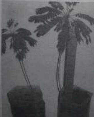
ဦးအောင်နိုင် ခြုံတွင် ပေါက်ပွား ဖြစ်သန်နေသည့် ပင်စည်ဖြင့်သာသာ ထိကန်းမင်း အပင်

တစ်ခုတည်းသော ပင်စည်၏ ထိပ်မှ ကိုင်းပွားမရှိ အရွက်များ စုပြုံထွက်နေသည့် အပင်မို့ တစ်ပင်တိုင်ထိကန်း သို့မဟုတ် ယ်စောက် ထိကန်းဟု သတ်မှတ်ခေါ်ဆိုကြတာဟု ယူဆမိသလို ထို အမည်နှင့်လည်း လိုက်ဖက်ပါ၏။