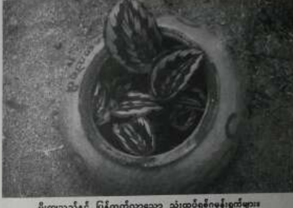
မိုးကျသည်နှင့် ပြန်ထွက်လာသော သုံးထပ်ရစ်ဂမုန်းရွက်များ။

သုံးထပ်ရစ်ဂမုန်းမျိုးကိုလည်း လယ်ခေါင်းမြို့မှ ဝါသနာရှင်တစ်ဦးက ယူလာ ဝေပွဲ၌ စိုက်ပျိုးပျိုးပွားနေခဲ့တာ နှစ်များစွာ ရှိပါပြီ။ မိုးဦးကျမှစ၍ အစိမ်းပွင့်ရောင်