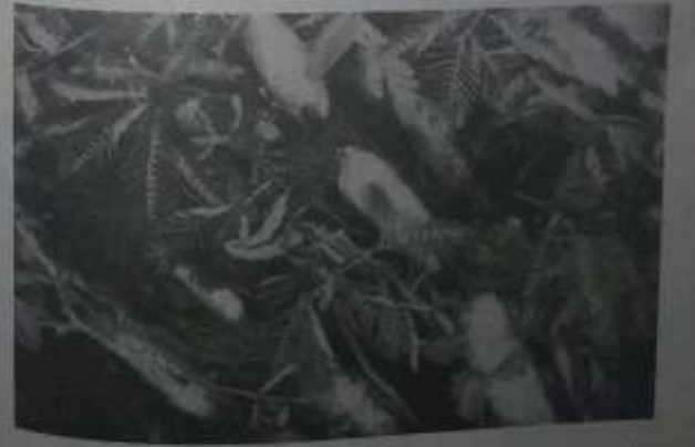
ထိကနွဲပင်