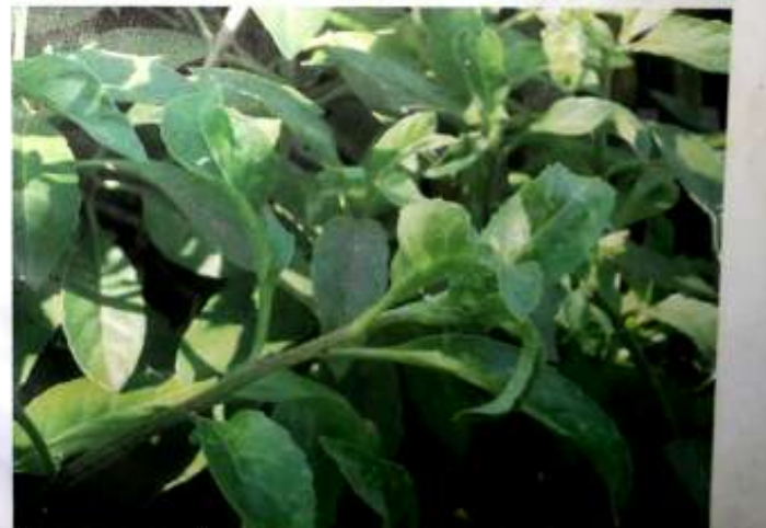
ပျားမြီးရွက်