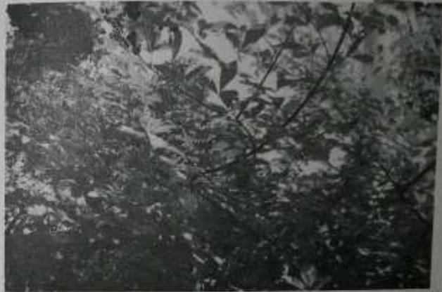
အတွင်းလိပ်ရောဂါဝေဒနာကို သက်သာ ပျောက်ကင်းစေသော ကြောင်ပန်းရွက်ဆေးအစွမ်း

၁၃၊ ၃၊ ၀၉ ရက်နေ့တွင် ဆိုင်ကယ်တစ်စီးဖြင့် ပုဂ္ဂိုလ်နှစ်ဦး ခြံထဲသို့ ဝင်လာလေသည်။ ထိုပုဂ္ဂိုလ်က 'ဆရာကြီး၊ ကျွန်တော့်ကို မှတ်မိမှာပါ။ အရင်တစ်ခါ လာဖူးပါသေးတယ်။ ဒီတစ်ခေါက်လာတာက ရပ်စောက်က မိတ်ဆွေက ဆရာကြီး ရေးသားခဲ့တဲ့ ဆောင်းပါးဖတ်ပြီး ဆရာကြီး ဖွဲ့ဝေနေတဲ့ မဟာဂါတြိဆစ်ဆေးပင်မှာလိုက်လို့ပါ' ဟု ဝင်လာရင်း ဆိုပါ၏။