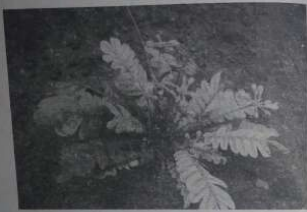
တစ်ပင်တိုင် ထိကရုံး သို့မဟုတ် ထိကရုံးမင်းအပင် နှင့် ဆေးဖက်ဝင်အဖွမ်း

၁၃၊ ၁၀၊ ၀၉ ရက်နေ့ နံနက် ၁၀၊ ၃၀ နာရီခန့်တွင် နေပြည်တော်၊ ပျဉ်းမနားမြို့၊ ဗိုလ်ချုပ်လမ်းနေ မြို့နယ်စာနယ်လမ်း ၅၃၅၅၄ ကိုဦးကျော်ထံ ရောက်ခဲ့ပါတယ်။ ယခုလ ၁၁၊ ၂၀၀၉ ထုတ် သိဒ္ဓိဇီ မဂ္ဂဇင်းတစ်အုပ် ဝယ်ပြီးသွားခဲ့တာပါ။ ၎င်း စာအုပ်တွင် နေပြည်တော် ရဲချုပ်မှမှ ဆရာထက်ခေါင်း ပြောပြသော ဇီဝကမ္မဗေဒ ဆေးဖက်ဝင် လက်တွေ့ ပွဲတွေ့ ဆေးအကြောင်း ပါလာလို့ဖြစ်ပါသည်။ ကိုဦး ကျော်ထံ ဆရာထက်ခေါင်းနှင့် အခါအားလျော်စွာ တွေ့နေကျ၍ သူကတစ်ဆင့် အမှတ်တရအဖြစ် မဂ္ဂဇင်းကို ယူသွားပေးဖို့ပါ။