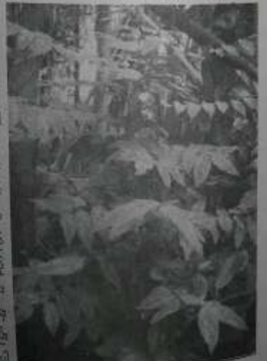
ကြက်သဟင်းပင် (အရိုင်းမျိုး)

ကြက်သဟင်းအရွက်များသည် အညာရိုးတံတို၍ အရင်းခိုင်ပြီး အဖျားချွန်ပါသည်။ အလျား နှစ်လက်မမှ လေးလက်မခန့်အထိရှိပြီး စိမ်းစို၍ မဟောလွန်း မဟောလွန်းဘဲ နူးညံ့ပျိတာ တွေ့ရပါ၏။ ပင်မရိုးတံ တစ်ခုတွင် အရွက်ပေါင်း အနည်းဆုံး ၁၀ ရွက်မှ ၃၀ ကျော်ခန့် ထွက်လေ့ရှိပါ၏။