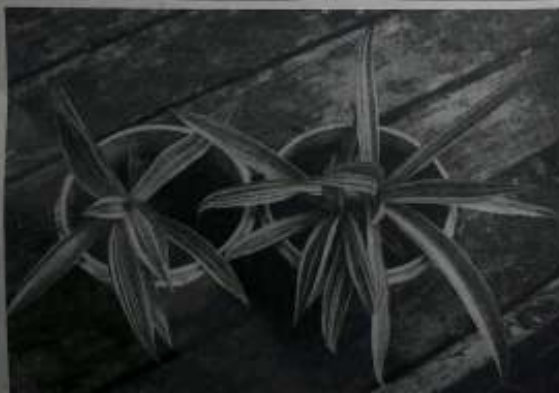
ထိုင်း မီးကွင်းဂမုန်း အလှပင်အိုးများ

အချို့က မရမ်းရောင် အလှကို မြတ်နိုးတတ်သလို ခံစားတတ်ရုံမက အိမ် မျက်နှာစာမှာ ထားစိုက်ပါက ကျက်သရေတိုး လာဘ်တိုးစေတယ်လို့ ယုံကြည် လေ့ရှိတော့ ထိုင်းမီးကွင်းဂမုန်းရေးကွက်က ဖျိုးပွား ထုတ်လုပ်နိုင်လေ အတိအ ချစ်လေ မြစ်နေတာကြောင့် စာရေးသူလည်း ဖျဉ်းပျဉ်းသမားဖို့ ဒီရေးကွက်ကို အရယူ ကြိုးစားနေတာ အမှန်ပါ။ သို့သော်လည်း လမ်းလျှောက်မီးကွင်းဂမုန်းနှင့် မီးကွင်းဂမုန်း အပင်ကြီးဖျိုးများလို အပင်ပွားစီးမှုအား သိပ်မကောင်းတော့ အချိန်ယူ နေရပေသည်။