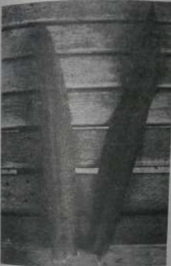
ဆေးဖက်ဝင် မီးကွင်းဂမုန်း အရွက် အပေါ်ဖျတ်နားနှင့် ဆောက်ဖျတ်နား

မီးကွင်းဂမုန်းအပင်များသည် အရွယ်ရောက်လာ ပြည့်လေ့ ရှိ၏။ ပွင့်ပတ် ခွက် နှစ်ဖက်ထပ်၍ အဖြူရောင် အပွင့်ငယ်လေးများ တစ်ပွင့်ချင်း ပွင့်၏။ နယုန် ပါဆိုလများတွင် ပွင့်၏။ အသီးငယ်များ ခြောက်၍ လွှင့်စင်ကျသောနေရာမှာမှ အပင်ငယ်လေးများ ပေါက်တတ်လေသည်။