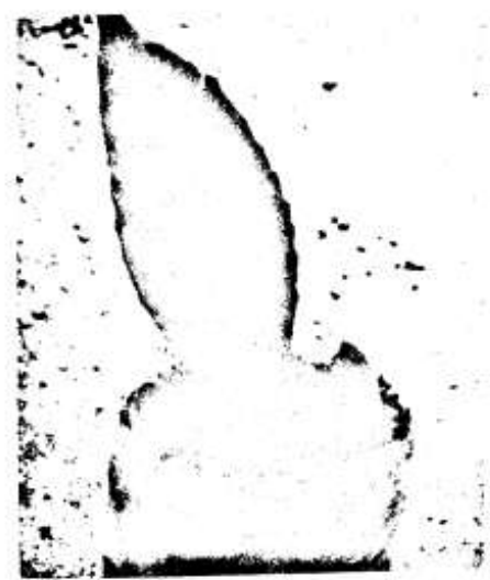
ဆီးချို သွေးချို ရောဂါဝေဒနာအတွက် ပျားမြီးရွက် အပင်နှင့် ပတ်သက်၍ ၈

ထို့အပြင် ပျားမြီးရွက် အရွက်ကတောင် အမြစ်ထွက် ရှင်သန်စွမ်းအားရှိပုံကို စာရေးသူကိုယ်တိုင် တွေ့ရှိချက်လည်း ခြံထဲသို့ ပျားမြီးရွက်ပျိုးပင် လာတောင်းသူ များအား အခြေအနေ ပေးသည့်အခါ လက်တွေ့ ရှင်းပြခဲ့ပါသည်။ ထို့အပြင်