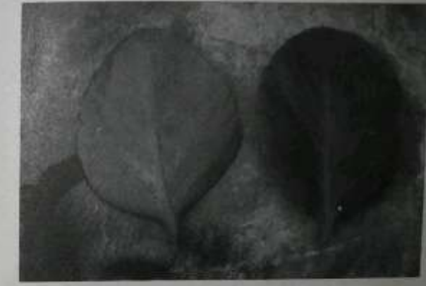
ဂျပန်ရွက်ကျပ်နှင့် ဆေးအစွမ်း

ရွက်ကျပ်ဆိုတာ အရွက်မြေကုန်နှင့် အမြစ်ဆင်းအပင်များ ပေါက်လေ့ရှိသော အပင်မျိုးကို ခေါ်တာပါ။ ရွက်ကျပ်ပျိုးကွဲ အထောက်အပံ့များကို တွေ့ဖူးပါ၏။ ပျိုးဥယျာဉ်လုပ်ငန်း လုပ်ကိုင်နေသူတို့ ထိုရွက်ကျပ်ပျိုးများကို စိုက်ပျိုး ပြုစုပေးပါ။ အရွက်ကြီးပြီး အဖွားချွန်သောပျိုး အရွက်ပိုင်းသောပျိုး စသည်တို့ ဖြစ်ပါသည်။ ထိုအပင်များကို စိုက်ချိန်ကစ၍ လွယ်ကူစွာ ဖွင့်သန့်မှုပေး အလွန် အေးတောင်း တာ တွေ့ရပါ၏။ ဟိုး ယခင်အချိန်ကတော့ သာမန်အသိဖြင့် စိုက်ပျိုး မျိုးပွားနေ ခဲ့တာပါ။ အပင်တို့၏ ဆေးစွမ်းထက်မှု ဆေးဖက်ဝင်မှုတို့ကို လေ့လာ သိရှိလာ ရာမှ ယခုအခါ အလျဉ်းသင့်၍ အဆင်ပြေပါက ထိုအပင်တို့က ပေးသော ဆေးစွမ်း သတ္တိဖြင့် လူသားနှင့် သက်ရှိတို့၏ ရောဂါဘယများ ကုသရာတွင် အကျိုးရှိစွာက ပျောက်ကင်း သက်သာကြသည်တို့ကို လက်တွေ့ သိရှိ တွေ့မြင်ရပြီးနောက် ထိုဆေးဖက်ဝင်အပင်များကို အလေးပေး စိုက်ပျိုး မျိုးပွားနေမိတာ အမှန်ပါ။ ထိုစိုက်ပျိုး မျိုးပွား၍ ရရှိခဲ့သော ဆေးဖက်ဝင် အပင်များကိုလည်း ဆန္ဒရှိသူ လိုအပ်သူများအား ဝီတီတခါနဲ့ မှုဝေ ကုသိုလ်ပြုနေတာလည်း ကြာပါပြီ။