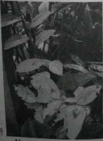
ကိုင်းပျားများစွာနှင့် မဟာဂါကြိဆစ်အပင်။

မဟာဂါနှင့် ပတ်သက်၍ မြန်မာနိုင်ငံ အတွင်းရှိ အရေးကြီး အပင်များ၏ စုက္ခဝေဒ ဆိုင်ရာ အမည်များနှင့် မျိုးရင်း အမည်များကို ဖော်ပြထားသော စာအုပ်တွင် လေ့လာ တွေ့ရှိချက် အချို့အား အသိပေး ဖော်ပြ လိုက်ပါသည်။ ၁။ မဟာဂါ ၂။ မဟာဂါလေ့တား ၃။ မဟာဂါကြိဆစ် ၄။ မဟာဂါကွဲရေကျ ဟု လေးမျိုး ဖော်ပြထားတာကို တွေ့ရှိရပါ၏။