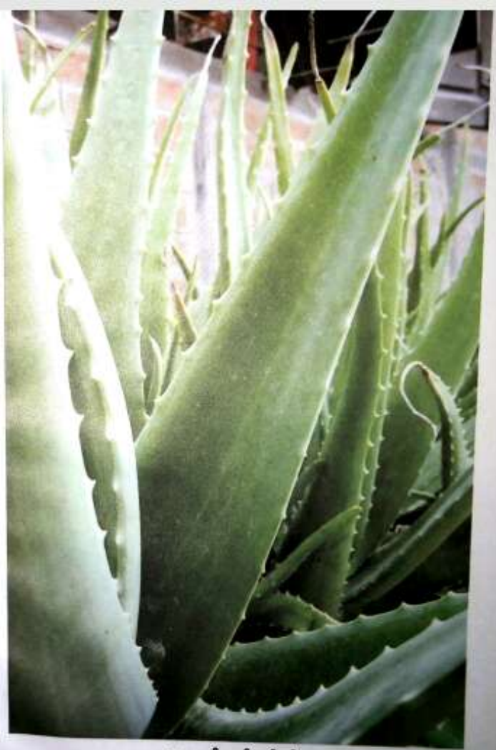
ရှားစောင်းလပ်ပတ်ပင်