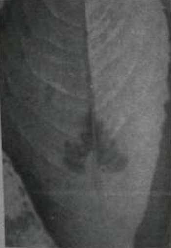
မဟာဂါတြိဆစ်အရွက်ပေါ်ရှိ စေတီပုံဟု ယူဆသည့် အမှတ်အသား။

ထို့နောက် ၂၃၊ ၈၊ ၀၈ ရက်နေ့ ညနေ ၅ နာရီခန့်တွင် ပျားတောင်ကလပ် ရွှေမကျည်း တောရိပ်သာ စာတန်းကို ကားနောက်မှ မှန်ပေါ်တွင် ရွှေရောင် စာလုံးများဖြင့် ထင်ရှားစွာ ရေးထားပြီး သာသနာ့အလံ တစ်ခုကိုလည်း ကားရှေ့ဘေးနက်ပေါ်တွင် ထောင် ထား သည့် ဆလွန် ကား ဖြူလေး တစ်စီး ခြံစွေသို့ ရောက် လာ ပါ ၏။ ဝါဒာ တစ်လအတွင်း ဗုတိယအကြိမ် ရောက်လာခြင်းပါ။