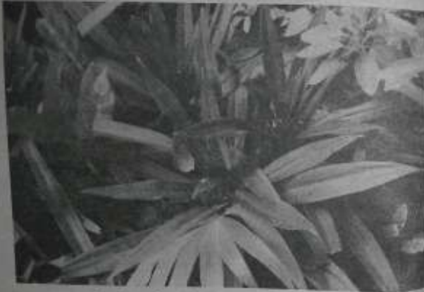
မီးကွင်းဂမုန်း နှင့် ထူးခြားသော ဆေးအစွမ်း

စာရေးသူက ဖျဉ်းပျဉ်းလုပ်ငန်းဖြင့် မိသားစုထဝရပ်တည်နေ လုပ်ကိုင်နေသူပါ။ ဖျဉ်းပျဉ်းလုပ်ငန်းဆိုတာ သီးပင်စားပင် အလှဆင်ပင်နှင့် အရိပ်ရအပင်များကို အဓိကထား၍ ရွာပွေစုဆောင်း ဖျဉ်းပွား ရောင်းချနေပါ၏။ ထိုသို့ လုပ်ဆောင်နေ ရာတွင် ခိုက်ဖျိုးနေသောမားတစ်ယောက်ပီပီ ဆေးစွမ်းထက်၍ ခိုက်ဖျိုး ဖျိုးပွား၍ လွယ်ကူသော အပင်ဖျိုး အတော်များများလည်း ပါသောအရ ချာပွေရရှိ ခိုက်ဖျိုး ဖျိုးပွား အခမဲ့ ကုသိုလ်ပြု မှုဝေနေတာလည်း နှစ်အတော်ကြာခဲ့ပါပြီ။