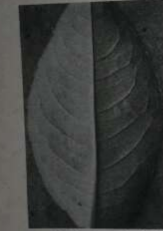
မဟာဂါကြိဆစ်ရွက် အောက်ဘက်မျက်နှာ

အရွက်ကို ငါးစားကြည့်ပါက အနံ့သလို ခါးသလို ချဉ်သလို အရသာများ ရောနှောပါရှိတာ တွေ့ရ၏။ ၎င်း၏ အရသာသည် အလွန် နာမည်ကြီးနေသော ဆေးဖက်ဝင် ပိစပ်ကြီးအရွက် အရသာနှင့် ဆင်တူနေသယောင်ရှိတာကိုလည်း