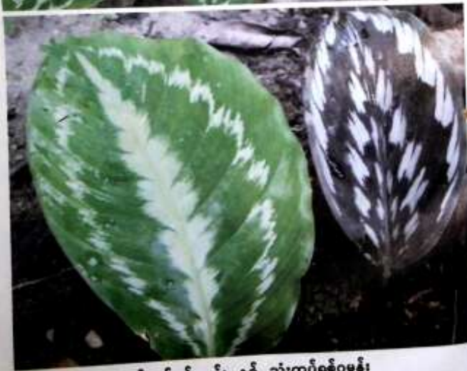
နှစ်ထပ်ရစ်ဂမုန်း နှင့် သုံးထပ်ရစ်ဂမုန်း