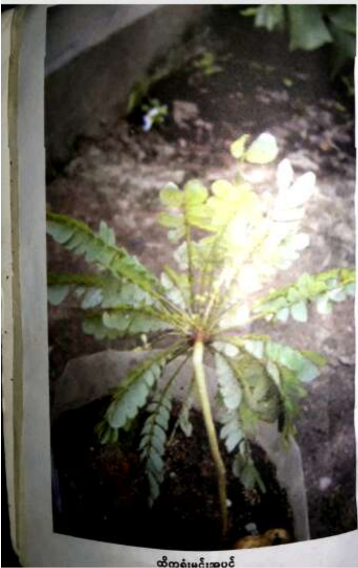
ထိကမ်းမင်းအပင်