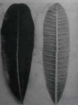
အကျော်ပင် အပေါ်ဖျက်နာနှင့် အောက်ဖျက်နာ

အကျော်ပင်အရွက် ထိပ်ပိုင်း ပြီး တရုတ်စကားရွက်က ထိပ်ပိုင်း အကျော် ရွက်များသည် အာဟာရ ကောင်းပါက အကျော် ကိုင်းတိုင်း တွင် ဝေသာစွာ ထွက်ရှိ နေတတ်ပေသည်။ ပင်စည်ကိုင်းမှ ရွက်ညာ (2 - 2 1/2) လက်မခန့်နှင့် အရွက်၏ ကျောဘတ်မှာ ရွက်များ