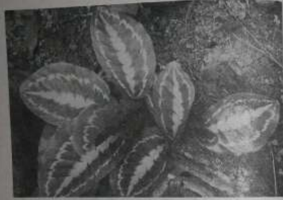
မိုးကျသည်နှင့် နှစ်ထပ်ရစ်ဂမုန်းပင်မှ အသစ်ထွက်လာသောအရွက်များ။

အရွက်များသည် အလယ်ကား၍ အရင်းအဖျားပိုပြီး ဘဲညှပ်နှင့် ဆင်ပါသည်။ အရွက်အလျား ၆-၁၂ လက်မခန့် ရှိပြီး အနံ ၅-၈ လက်မခန့် အထိ ရှိ၏။