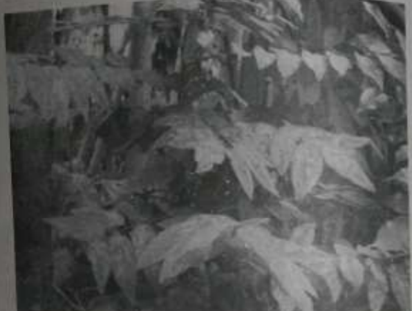
မျက်ပျဉ်းကျ မျက်စိဝေဒနာအတွက် ဆေးဖက်ဝင် ကြက်သဟင်းအပင်

စာရေးသူသည် သမားတော်ကြီး ပျဉ်းပန်း၊ ဆရာမော် ပြောပြသော ထူးခြား ရေးဆေးပင်များနှင့် လက်တွေ့အသုံးချ ဆေးဖက်ဝင်နည်းများ အကြောင်းကို ဆရာကြီး၏ ခွင့်ပြုချက်ဖြင့် နက္ခတ္တရောင်ခြည်မဂ္ဂဇင်းတွင် အခါအားလျော်စွာ ဆောင်းပါးအဖြစ် ရေးသားဖော်ပြလေ့ ရှိပါ၏။ ယခုလည်း ဆရာကြီးကိုယ်တိုင် မျက်ပျဉ်းကျဝေဒနာ ဖိစားခဲ့ရတာကို ဆေးဖက်ဝင် ကြက်သဟင်းရွက်ဖြင့် ကုသ မျောက်ကင်းခဲ့ရပုံကို ရေးသား ဖော်ပြလိုက်ပါသည်။