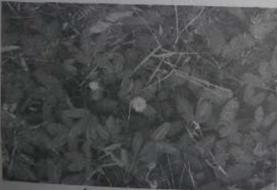
ဝင်ပွားများစွာနှင့် ကုန်းထိကန်းပင်

အသက်ပါ အသက်ကရ ဆေးစာအုပ်များမှာ ထိကန်းပင်၊ တစ်ပင်တိုင် ထိကန်း ပင်အောက်ထိကန်း အပင်နှင့် ပတ်သက်၍ ဖော်ပြထားချက် လုံးဝ မတွေ့ရပါ။