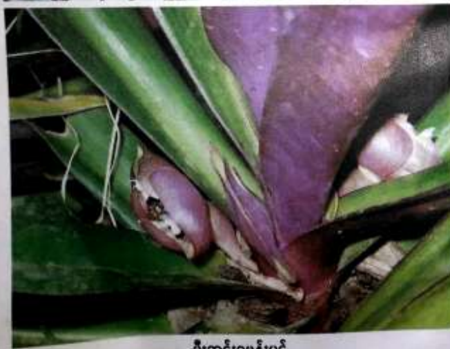
မီးကွင်းဂမုန်းဝင်