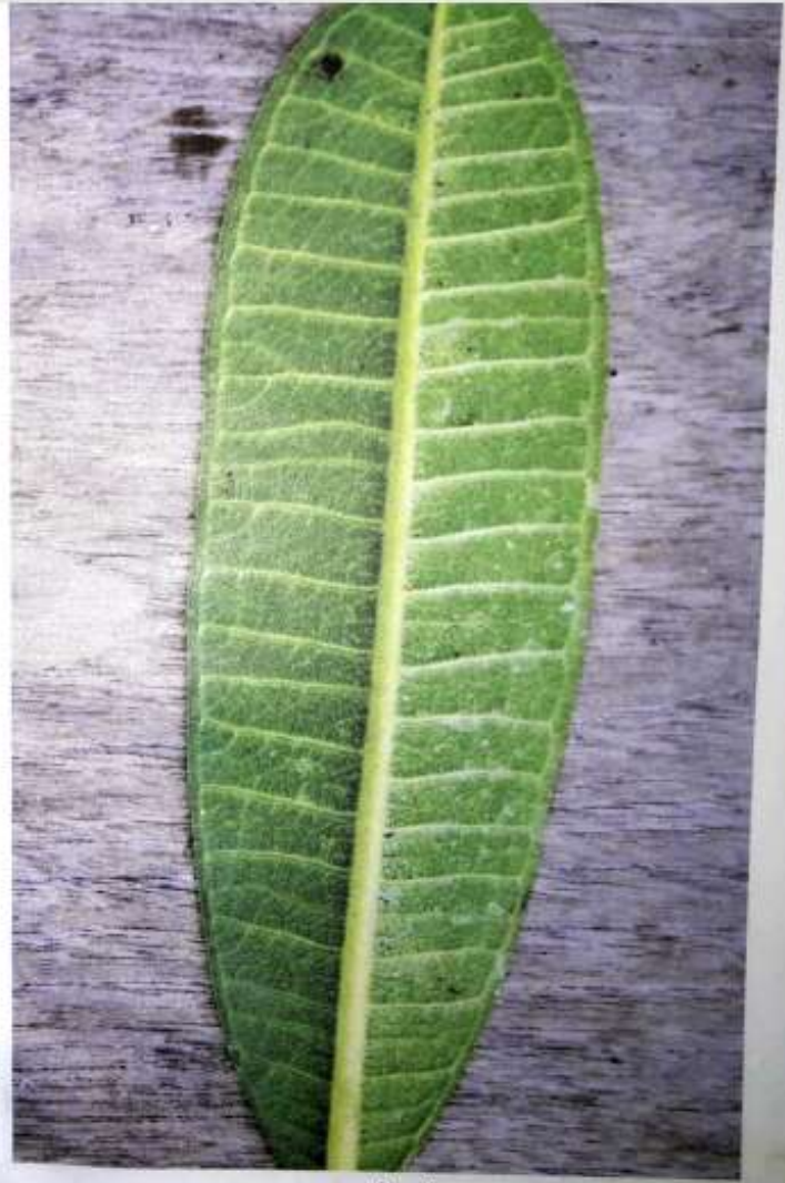
အကျော်ရွက်