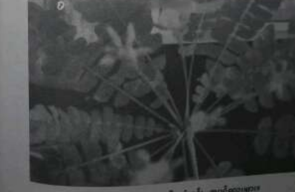
ပေါက်ပွားသော ထိကန်းမင်း အပွင့်ထောပွားများ

ထိကန်းမင်းအပင်တစ်ခုတွင် ထိပ်ဖု၌ အရွက်များခိုင်း၍ နှစ်ထပ်ထွက်ရာတွင် အပင် အာဟာရပေါ်မူတည်၍ ၁၀ ရွက်မှ ၂၅ ရွက်ခန့်အထိ ထွက်၏။ အရွက်ရောက်သော ထိကန်းမင်းအပင်များ ပွင့်ပွင့်ကြပေသည်။ ထိပ်ဖုအရွက်များ၏