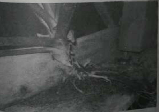
ဆေးဖက်ဝင် မီးကွင်းဂမုန်းအပင်မှ အပင်ပေါက်ပိုင်သန်နေသော ချိုးစင်ပျဉ်းပျက်ပေါ်ရှိ အပင်

စာရေးသူ အထက်မှာ မီးကွင်းဂမုန်း၏ ဆေးဖက်ဝင်အပင်ပြု ပျောက်ကင်း ပုဒ်နှင့်မဟုတ်ပွဲဝက်ကုသခံရန် ဆေးရုံတက် ခံယူနေသော ဆရာထက် ဘုန်းထော်