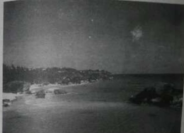
ပါ၏။ ခူးခိုင်လာသလို နှလုံးရောဂါသည် ဇနီးလည်း သွက်လက်လန်းဆန်းနေတာ တွေ့ရပါတယ်။

နောက်ပြီး 'ဆံပင်ကွတ်ပြီး ပါးနေ ကျနေသူတွေ ဆံပင်ပြန်ပေါက်လာတယ်။ ဇက်လေး ဇက်ဖုံ ရောဂါသည်တွေ ပေါ့ပါးသွက်လက်လာတယ်။ အနာကြောင့် များနာနေသူတွေ ခြေထောက် ဆားပွတ်၊ ဆားဖုံပေးရုံနဲ့ သက်သာ ရောဂါကင်းနိုင်တယ်' ဟု ပြောပြပါသည်။ ထိုပုဂ္ဂိုလ်ကြီး ပြောပြချက်တွေ ကြားရတော့ ပင်လယ်ရေခိုအေးတဲ့ စာရေးသူ ခံစားရတဲ့ ပကတိ အခြေအနေများကို နှိုင်းယှဉ်ကြည့်မိတာ အမှန်ပါ။ တစ်ခု ထူးခြားတာက စာရေးသူ၏ ကိုယ်ခန္ဓာမှာ နေပူထဲ ခြုံလုပ်ဝန်းလုပ်ငန်း ခွေးထွက်၊ ငှက်ခွေး အချင်ပေါက်ရတာ မြစ်ယာသော ညှင်းကွတ်အဖို့ ကတော်ကို မှိန်ကျ လျော့နည်းသွားတာ တွေ့ရ