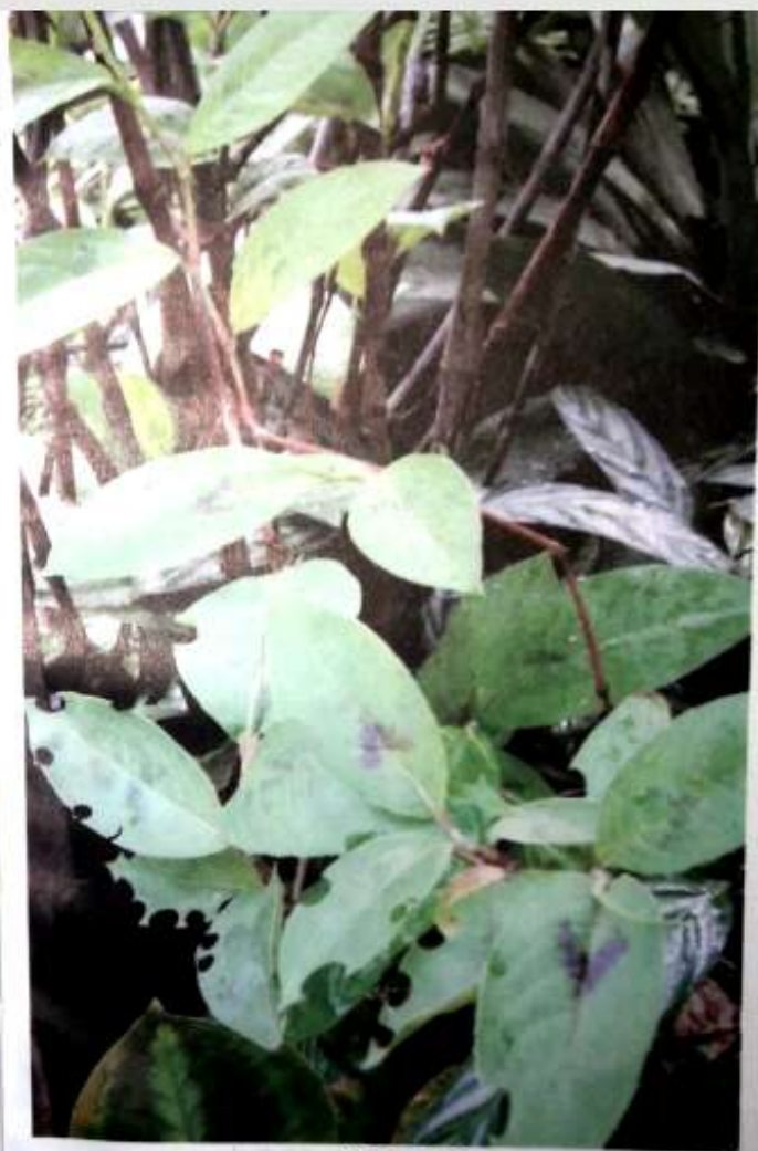
မဟာဂါကြဲဆစ်ပင်