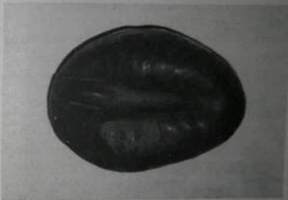
ပြင်းသရိုက်နာအတွက် မြစ်ချင်းပြီးဆေးနည်း

စာရေးသူသည် အစွမ်းထက် ပရဆေးရွက်များအကြောင်းနှင့် အခြား ပွဲတွေ့ဆေး မြစ်ချင်းပြီး ဆေးနည်းကောင်းများကို လက်လှမ်းမီသမျှ ရှာဖွေဆောင်း၍ အများသိရှိစေရန်အတွက် ဆောင်းပါးရေးသား ဖော်ပြနေသည်မှာ အတော်ကြာ ခဲ့ပါပြီ။ ပွဲတွေ့ဆေး၊ လတ်တွေ့ဆေး၊ ဆေးနည်းတို့၊ ဆေးပြီးတိုး၊ မြစ်ချင်းပြီး ဆေးနည်း ဘယ်လိုပဲခေါ်ခေါ် ထိုဆေးနည်းဖြင့် ရောဂါဝေဒနာသက်သာ ပျောက် ကင်းမှု ရှိပါက ကာယကံခွင့်၏ နှစ်ပြည့်သဘာဝတူညီချက်ဖြင့် အမြဲလိပ်ဆေးသူများ အတွက် မျှဝေအသိပေးခြင်းဖြင့် အများအကျိုး စာများကောင်းတို့အတွက် သယ်ပိုးခြင်း လုပ်ဆောင်ချက်အဖြစ်သာမက ကုသိုလ်ရသော အလုပ်ဟု ခံယူ ထားသူပါ။ ထို့အတူ ထူးခြား၍ လွယ်ကူသည့်နည်းကောင်းများကို ဆရာပြု ဖော်ထုတ်လိုသော ဆန္ဒလည်း ရှိပါသည်။