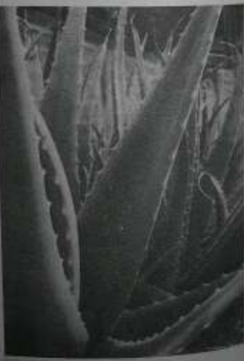
ရွှားစောင်းလက်ပပ်အမြစ်ကြီးများ

ပြီးတော့ လူကြီး ဆိုရင် တော့ ထမင်းစားရင်း တစ်ခွန်း နှစ်ခွန်းထောက်အထိ တိုက်သင့် ပါတယ်ဟု ဆိုပါစို့။ အလွန် ထိရောက်သည့် မြစ်ချင်းပြီး ဆေးနည်းကောင်းတစ်ခုဖြစ်၍ ဓာတ်ပရိသတ်ကို ချေးသား ခော့ပြုရာတွင် ပိုပြီး ထိကျင့်ညှစ် ချစ်တာကြောင့် 'နောက်တစ်ခု မမြဲပါဦး ဆရာ၊ ရွှားစောင်း လက်ပပ် အမြစ်ကို အပူပေးတဲ့ နည်းက ထမင်းပုလွယ် ဖုံးကာပဲ ရှားစား သန့်ရှင်း နည်းနဲ့ကော ရယ်လို့ မရဘူးသား'ဟု မေးမြန်း ပါပါစို့။