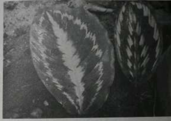
ရစ်စုံမှ ဘဝစုံသည်

ရစ်ဆိုတာ ဂမုန်းပင်တစ်မျိုးကို ခေါ်တာပါ။ ရစ်ဂမုန်းအပင်များကို သာမန် လေ့လာသိရှိထားသူများက ခေါင်းဂမုန်းနှင့် လွှဲများ သီးထားကြတာမျိုးလည်း ရှိနေ ပါ၏။ အပင်မျိုးစုချင်း တူနိုင်သော်လည်း မျိုးစိတ်ကွဲများဖြစ်ကြောင်း စာရေးသူ လေ့လာသိရှိရပါသည်။ အဲဒီလို လေ့လာသိရှိထားမှုကိုကလည်း နက္ခတ္တရောင်ပြည့် မဂ္ဂဇင်း ၈ / ၂၀၀၅ တွင် ခေါင်းအပိုင်နှင့် ရစ်ဂမုန်း (နှစ်ထပ်ရစ်) လွှဲများနေမှုကို အသိပေးဖလှယ် ရေးသားဖော်ပြခဲ့ဖူးပါသည်။