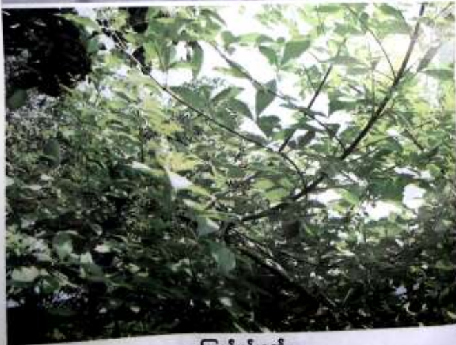
ကြောင်ပန်းရွက်

ပျားမြီးရွက်မျိုးပင်များကို တောင်းခံလာသူ ဆန္ဒရှိသူ လိုအပ်နေသူများအတွက် ရည်မှန်း၍ စိုက်ပျိုး မျိုးပွားနေရာ အံ့ဖွယ်ကောင်းလောက်အောင် စိုက်သမျှ ပျိုးသမျှ အားလုံး အောင်မြင်ခဲ့ပါ၏။ လာရောက် တောင်းခံသူ မှန်သမျှ ဓရ မရှိရအောင် အပင်ပေါ်ဘဲ လက်ချည်း မပြန်သွားရအောင် အပင်ပျား အချိန်ပြည့် အသင့်ရှိနေအောင် ကြိုးစားလုပ်ဆောင်နေခဲ့တာ နှစ်နှင့်ချီ ရှိခဲ့ပါပြီတော့။ ပုပြင် လှသော နေရာသီမျိုးမှာတောင် စိုက်ပျိုး မျိုးပွားနေတာပါ။ ပျားမြီးရွက်အပင်က ခွင်သန်မှု အားကောင်းတာရယ်၊ စာရေးသူ၏ ကြိုးစားမှုရယ် ပေါင်းစပ်လိုက်တော့ စိုက်သမျှ ပျိုးသမျှ အားလုံး အောင်မြင်မှုရခဲ့တာ ယနေ့အချိန်အထိပါပဲ။ ပျားမြီးရွက်အပင်က နွယ်ပင်ဆန်သော အပင်ပျော့မျိုး နေရာရင် ကြိုက်ပြီး အလွန်ပွားရောက်တာလည်း တွေ့ရပါသည်။ နွယ်ပင် အပင်တင်ပေးကာ အဲဒီနွယ်ပင် တက်သွားနိုင်၏။ အာဟာရကောင်းစွာရသော ပျားမြီးရွက်များ အတော်ကြီးမား တာမျိုးလည်း တွေ့ရပါ၏။ အဲဒီလို အပင်ရှင်သန် ပြီးလွန်းအားကောင်းပေမယ့် ရေဝတ်တာကိုတော့ အလွန် ကြောက်သည့်အပင် ဖြစ်ပါသည်။ ယခုအခါ မိုးတွင်း တာလ ခြံဆဲရောင်လာလို့ စာရေးသူ၏ ပျားမြီးရွက်အပင်အဖိုး နှစ်ဖိုး အောင်မြင်