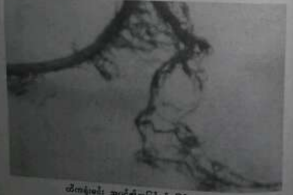
ထိုကန့်မင်း အပင်၏အမြစ်နှင့် မြစ်မြှောများ။

စာရေးသူထံတွင် ကျန်ရှိနေသော ထိုကန့်မင်းအမြစ် ပုံသဏ္ဍာန်ကို လေ့လာ လို၍ အထုပ်ထဲမှ ပြန်ထုတ်၍ မြေသားကိုခွဲပြီး အမြစ်ကို ကြည့်ရှုနိုင်ခဲ့ပါတယ်။ အက်ပုံမှတ်တမ်းပြု တင်ပြလိုက်ပါ၏။ မြစ်ခွဲနည်းဖြင့် မြစ်မြှော အသင့်အတင့်ရှိတာ