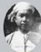
ဝင်းဝဲထွန်း