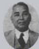
ဦးရာဇော်