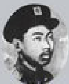
ဖိုဘော်ကိုထွေး