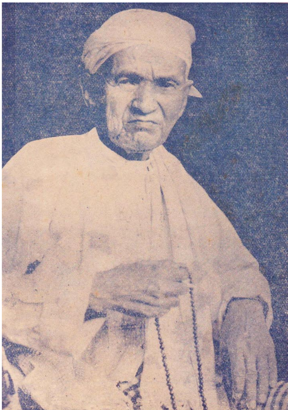
အိုင်ကလောင်ဓာတ်ဆရာကြီး-ဆရာလှိုင်