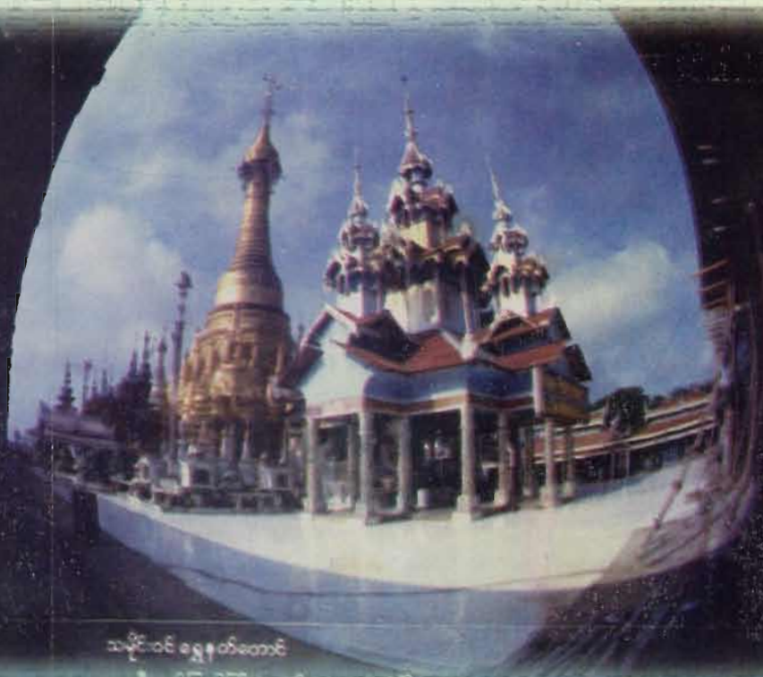
သမိုင်းဝင် ရွှေနတ်တောင်

ကျီးသဲလေးထပ်ဆရာတော်ဘုရားကြီး ကိုးကွယ်တော်မူခဲ့သည့် ရွှေတောင်မြို့ သမိုင်းဝင် ရွှေနတ်တောင်စေတီတော်ကြီး။