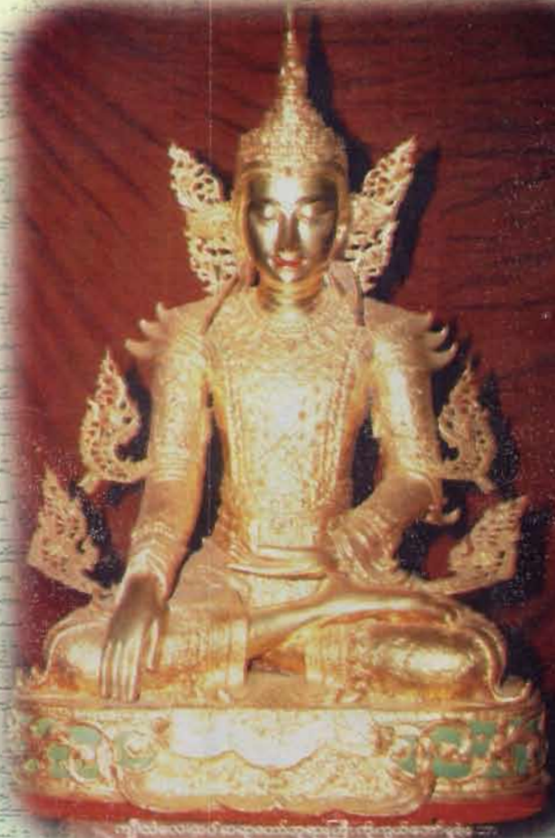
ကျီးသဲလေးထပ်ဆရာတော်ဘုရားကြီး ကိုးကွယ်တော်မူခဲ့သော ယွန်းဘုရားကို ရွှေတောင်မြို့ ဗိုလ်ရုံကျောင်းတိုက် ဘုရားစင်၌ တွေ့ရပုံ။