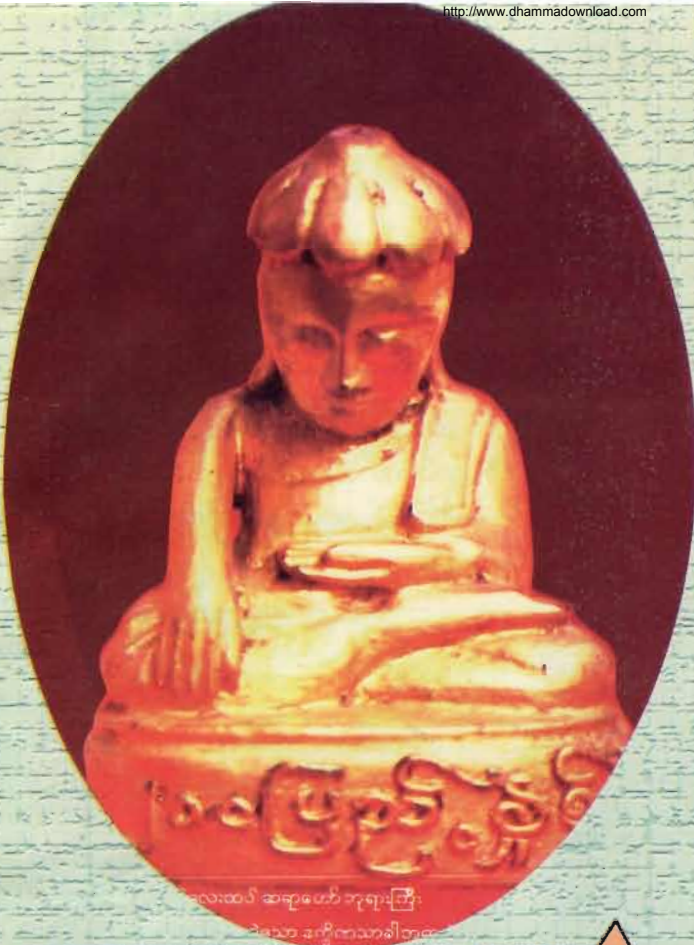
လေးထပ် ဆရာတော် ဘုရားကြီး ဒေသနာ အင်္ဂါဏသာခါတော်

ကျီးသဲလေးထပ်ဆရာတော်ဘုရားကြီး ကိုးကွယ် တော်မူခဲ့သော ဒေသနာသင်္ခါတော်ကို ရွှေတောင်မြို့ ဗိုလ်ရုံကျောင်းတိုက်၌ တွေ့ရပုံ။