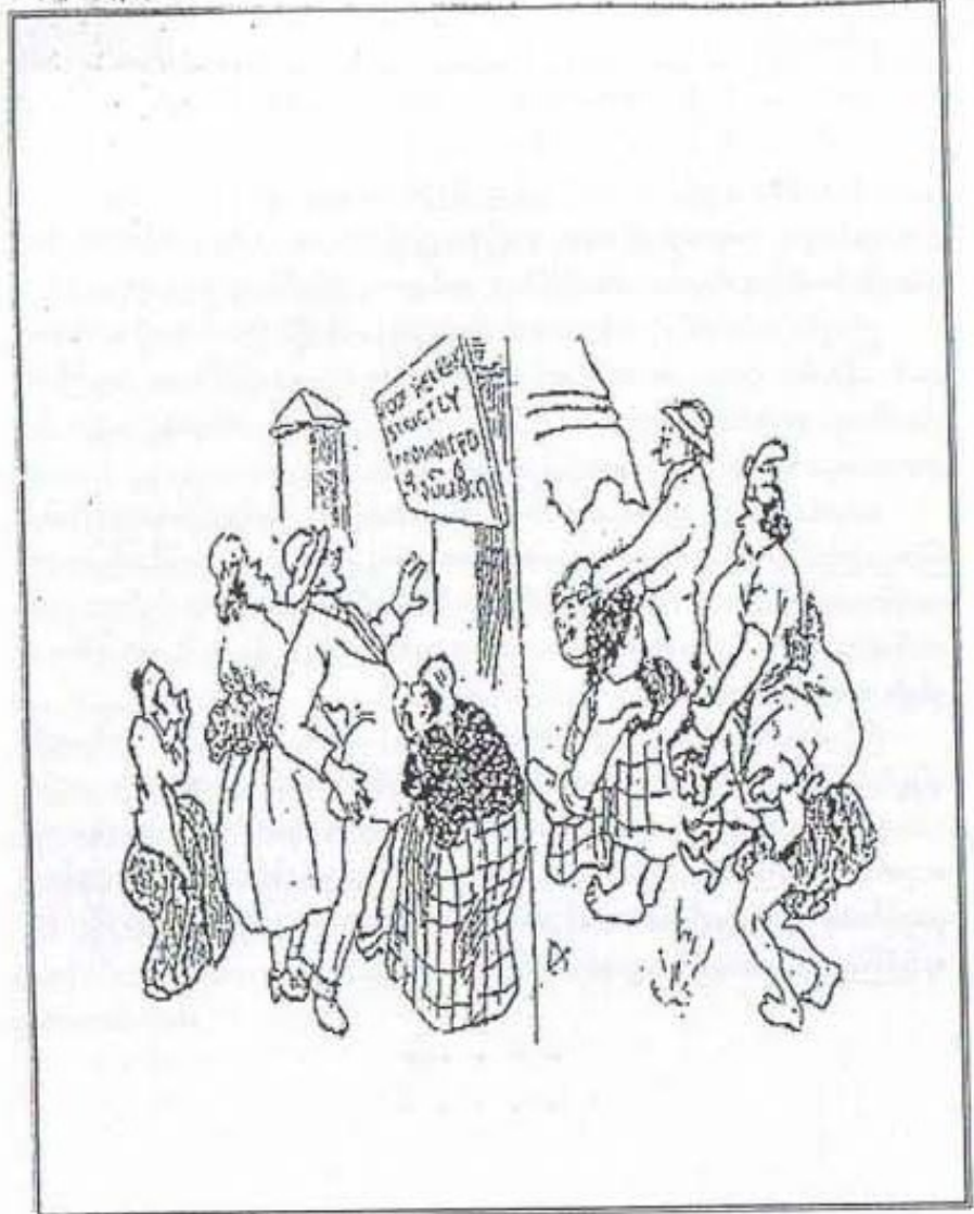
အင်္ဂလိပ်နယ်ချဲ့အား စတင်တိုက်ခိုက်သော အိန္ဒိယအရေးတော်ပုံ ရုပ်ပြောင်