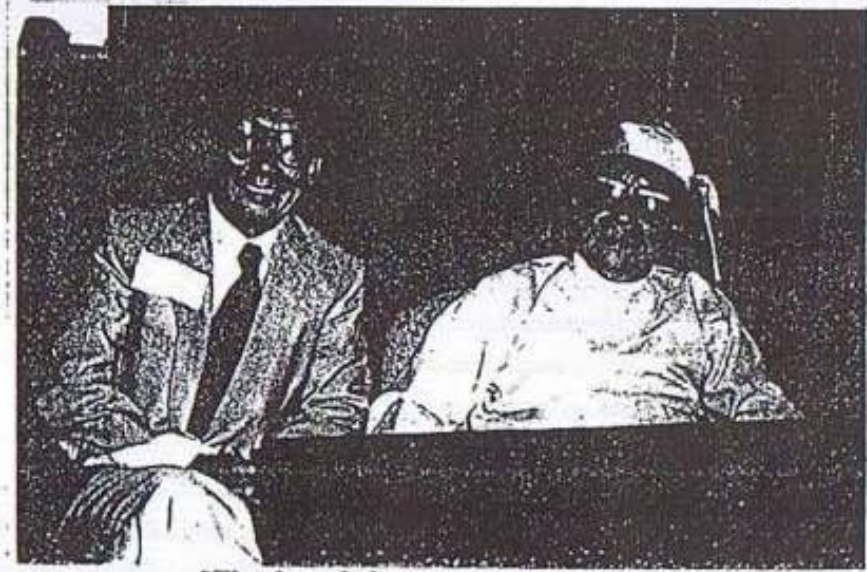
ဝန်ကြီးချုပ်ဟောင်း ဦးနုအား စာရေးသူနှင့်အတူ ၁၉၈၇ ခုနှစ်က အပေရိကန်တက္ကသိုလ် နီးနောပွဲတခုတွင် တွေ့ရစဉ်။

တင်ပြသည့်မူတွင် မှားယွင်းမှု၊ တိမ်းပါးမှုများ ရှိနိုင်စေကာမူ အဆင့်ဆင့် ဆွေးနွေးတည်း