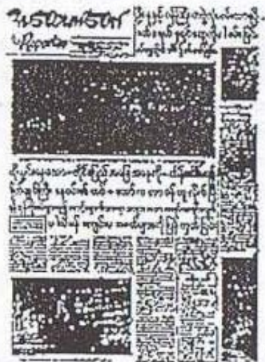
Three new newspapers commenced publication on the same day, Burmese New Year's Day (16 April) 1957.