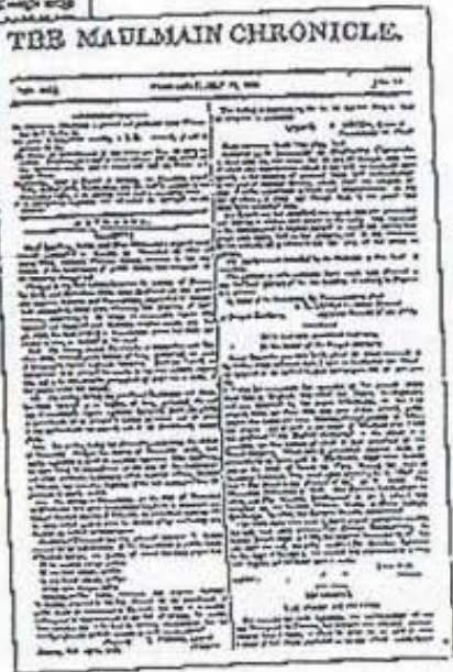
Early newspapers printed in Burma: the Maulmain Chronicle (first published 1836) and the Mandalay Gazette (1874) the King's paper with its promise of freedom.

၁၈၃၆ ခုနှစ်က စတင်ပြီး ပုံနှိပ်သော ပထမဆုံးသတင်းစာ Maulmain Chronicle နှင့် ၁၈၇၄ ခုနှစ်က ထုတ်သော ရတနာပုံ နေပြည်တော်သတင်းစာ။