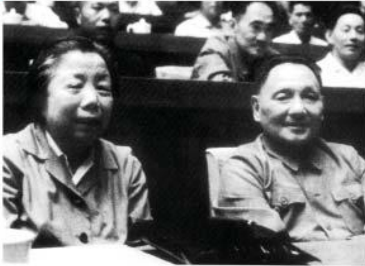
ပုံ (၁၃) တိန်ချောက်စိန်နှင့် ချူအင်လိုင်းတို့ တိန်ရှင်ဆရာငါး