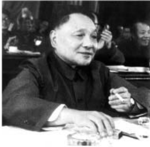
ပုံ (၂၀) စီးပွားရေး ပြောင်းလဲမှုအတွင်း ထွေရှာလာ တိန်ချောက်မိန်