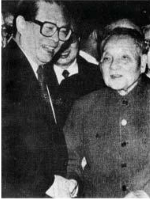
ပုံ (၂၄) တိန့်ရွှေကပ်ဝိန် စိတ်ကြိုက်ရွေးထားသော ကျန်ပီပင်ကို နှုတ်ဆက်နေစဉ်