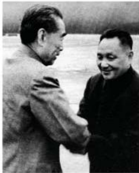
ပုံ (၁၄) တိန်ချောက်စိန်ကုလသမဂ္ဂ အထွေထွေညီလာခံတို့အတွက် လမ်းကြီးချုပ် ချူအင်လိုင်းက လိုက်လံပို့ဆောင်စဉ်