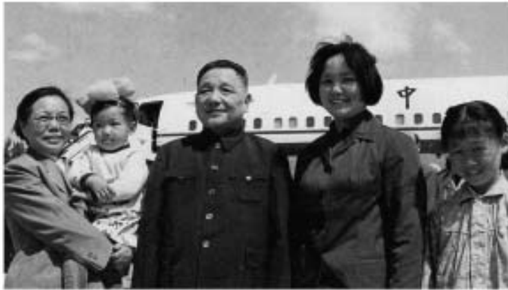
ပုံ (၁၀) တိန်ရှောက်မိန် ပြည်သစ်လွှာစဉ်