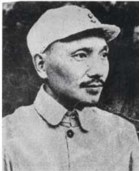
ပုံ (၂) ဖက်သစ်တော်လှန်ရေးကာလ တိမ်ညောင်မိန့်