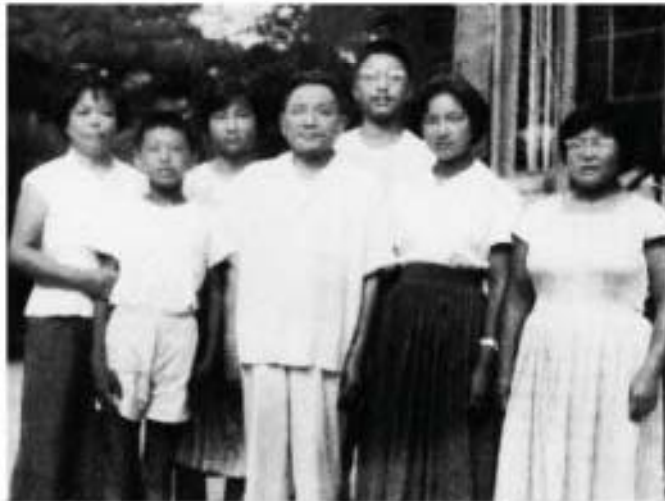
ပုံ (၄) တိန်ဇုာက်စိန်မိသားစု (၁၉၆၄)