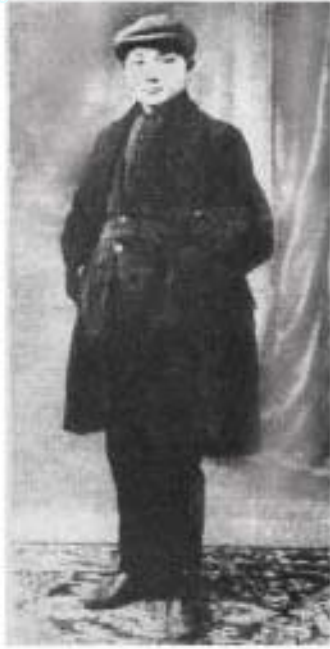
ပုံ (၁) ပြင်သစ်နိုင်ငံတွင် ပညာသင်စဉ် တိမ်ညောင်မိန့်