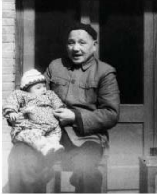
ပုံ (၁၉) အဖိတ်နီရောက်မီ ပြန်ပေးထားမည့်အတွက် (၁၉၇၂)