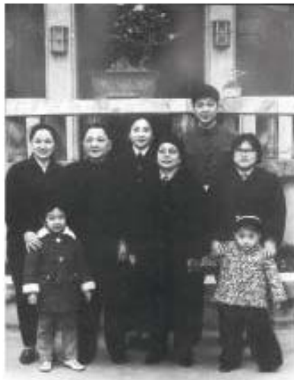
ပုံ (၆) ယဉ်ကျေးမှုတော်လှန်ရေးအပြီး တိန်ဇွာက်စိန်နှင့် သုဝါဝိလာစုပြန်ဆုံကြပုံ