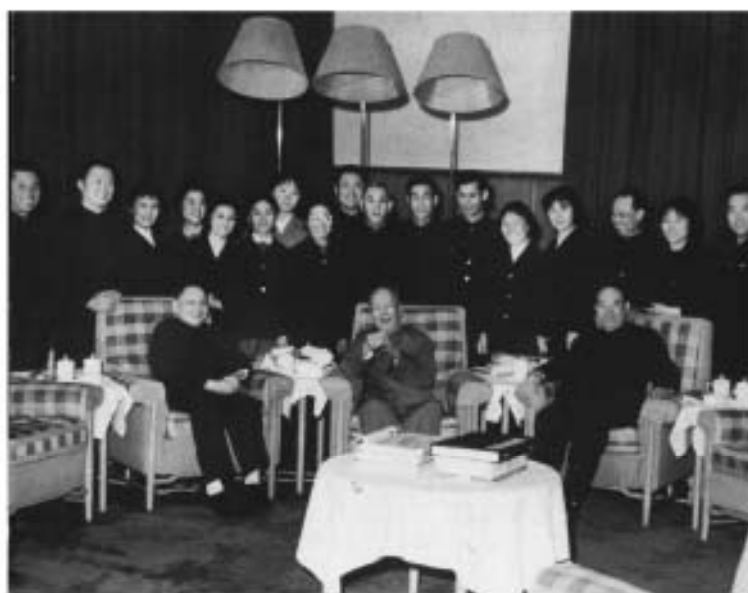
ပုံ (၂၃) မော်စီတုံနှင့် တိန်ရှောက်မိန် (၁၉၇၅)