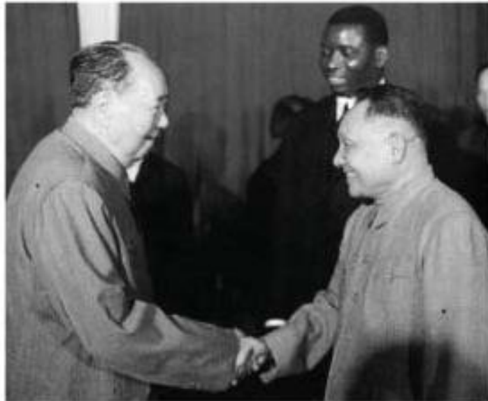
ပုံ (၆) ဟော်စီတုံးနှင့် တိန်ရှော့ကိမ်