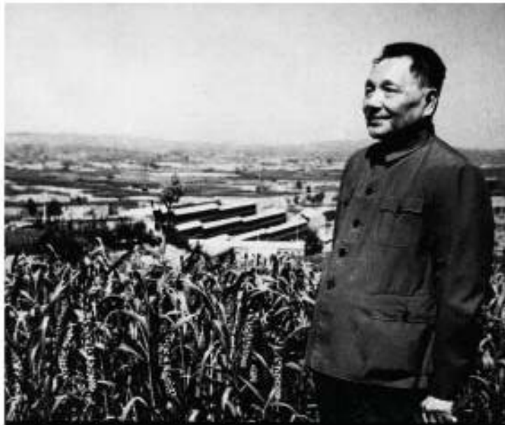
ပုံ (၂၁) လယ်ယာမြေ ပြန်လည်ပြင်ရာ စစ်ဆေးနေသော တိန်ချောက်မိန်