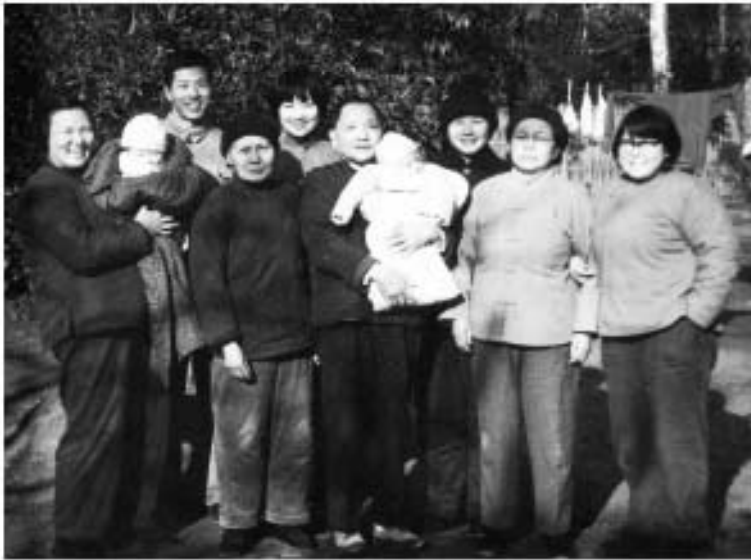
ပုံ (၂၀) ၆ နှစ်ကြာအကြောင်းမှ လွတ်မြောက်ပြီး တိန်ရောက်မီကို ပေးထားမည့်အတွက် (၁၉၇၃)