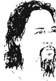
မင်းသိင်္ခါ