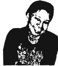
ရွှေယမင်းဦး

သူတို့သားအဖပြောပြကြသည့် စိတ်ဝင်စားစရာအကြောင်းများ