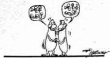
ပန်းပိုးတစ်ရာစာပေ