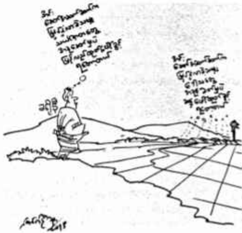
ပန်းပျိုးတစ်ရာစာပေ