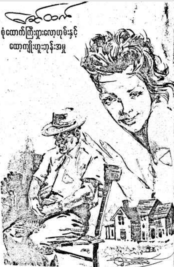
စုံထောက်ကြီးရှားလော့ဟုမ်းနှင့် ထော့ကျိုးဟူးဘုန်းအမှု