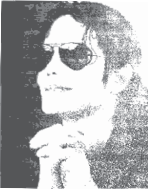
မိုက်ကယ် ဂျက်ဆင် [ Michael Jackson ] ( ၁၉၅၈ - )