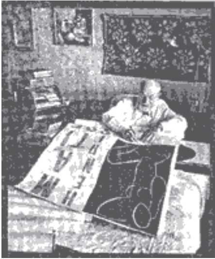
ဟင်နရီ မားတိစ် [ Henri Matisse ]