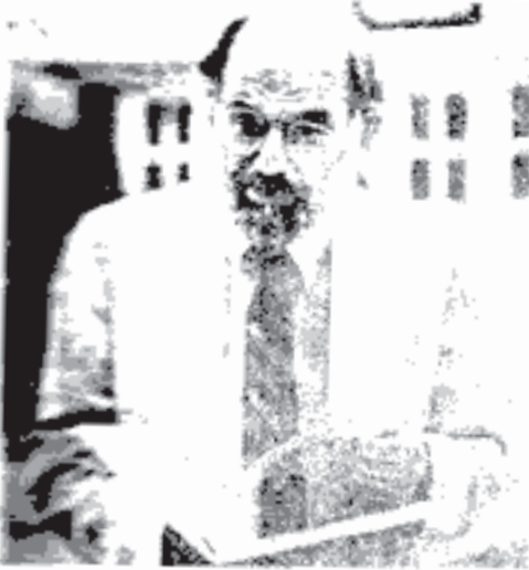
အလန် ဂျင်းစ်ဘတ် [ Allen Ginsberg ]