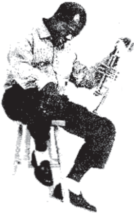
လူးဝစ်အမ်းစ်ထရောင်း [Louis Armstrong] [ ၁၉၀၀ - ၇၀ ]

□ အမေရိကန် လူမည်း လျပ်စ်ထရမ်းပက်သမားနှင့် အဆိုတော်။