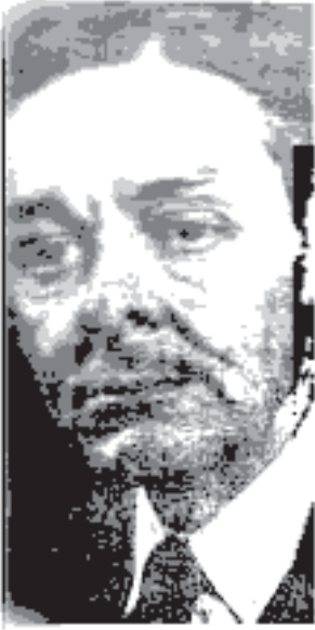
တီ၊ အက်စ်၊ အိလိယတ် [ T.S. Eliot ] ( ၁၈၈၈ - ၁၉၅၀ )

□ အမေရိကန်ဖွား ဗြိတိသျှကဗျာဆရာ၊ ဝေဖန်ရေးဆရာ နှင့် ပြဇာတ်ရေးဆရာ။