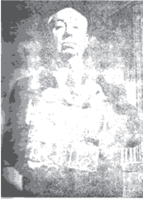
အဲဖရက် ဟစ်ချ်ကော့ [ Alfred Hitchcock ] ( ၁၈၉၉ - ၁၉၈၀ )