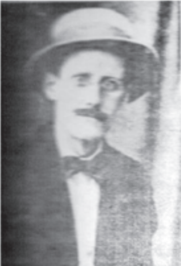
ဂျိမ်းစ်ဂျွိုက် [ James Joyce ] ( ၁၈၈၂ - ၁၉၄၁ )