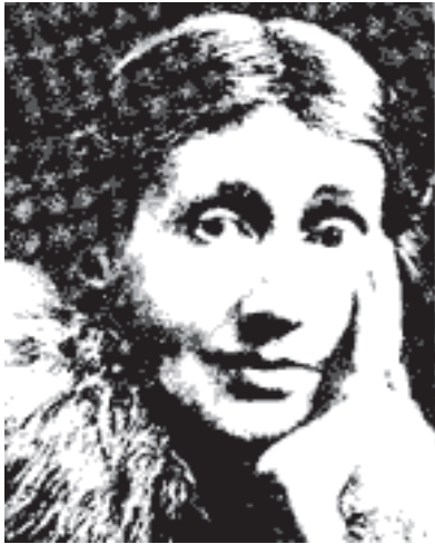
ဗာဂျီးနီးယားဝုဖ် [ Virginia Woolf ] ( ၁၈၈၂ - ၁၉၄၁ )