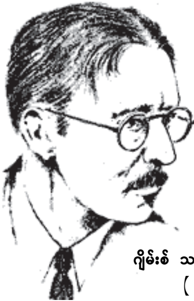
ဂျိမ်းစ် သာဘာ [ James Thurber ] ( ၁၈၉၄ - ၁၉၆၁ )