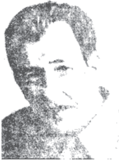
ဖရန့်စ် ကလိုင်း [ Franz Kline ] ( ၁၉၁၀ - ၁၉၆၂ )