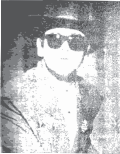
အယ်လ်တန်ဂျွန် [ Elton John ] ( ၁၉၄၄ - )

□ မြတ်သျှ ပေါ့ပဲအဆိုတော်၊ စန္ဒရားသမား၊ သီချင်းရေးသူ။