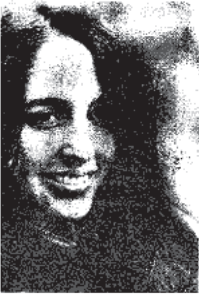
ဂျိုအန် ဘီးဇ် [ Joan Baez ] ( ၁၉၄၁ - )