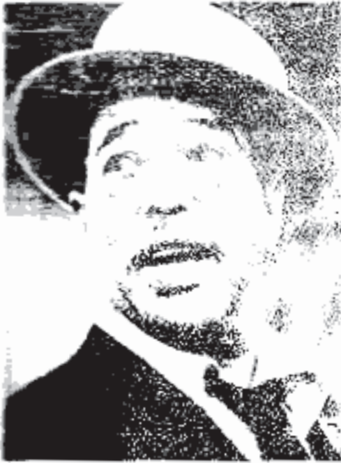
ဂျူ အယ်လင်တန် [ Duke Ellington ] ( ၁၈၉၉ - ၁၉၇၄ )

□ အမေရိကန်လူမည်း ဂျပ်စ် စန္ဒရာသမား၊ ဝိုင်းခေါင်းဆောင် နှင့် တေးရေးသူ။