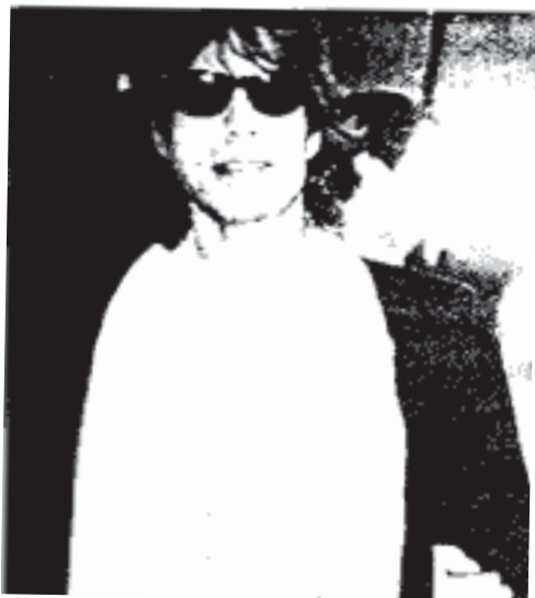
မစ် ဂျက်ဂါ [ Mick Jagger ] ( ၁၉၄၃ - )

□ မြိတိသျှ ရော့ခ်အဆိုတော်နှင့် သီချင်းရေးသူ။