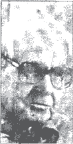
ဟင်နရီ မိုး [ Henry Moore ] ( ၁၉၉၈ - ၁၉၉၆ )