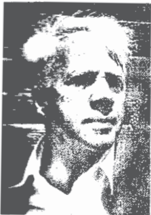
ရောဘတ်ဖရော့စ် [ Robert Frost ] ( ၁၈၇၄ - ၁၉၆၃ )