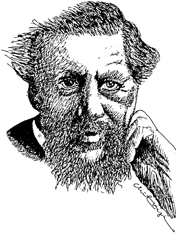
ဆာ အက်ဒွင် အာနိုး [၁၈၃၂-၁၉၀၄]