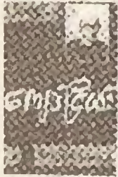
ပထမအကြိမ် ၁၂၊ ဇူလိုင်လ ၁၊ ၁၉၅၀ ရွှေပြည်တန်ခိုးအုပ်စုတိုက်