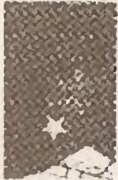
တတိယအကြိမ် ၁၉၅၀ အောင်စစ်သည်စာပေ