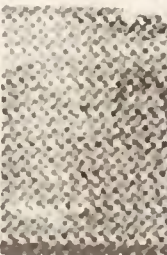
တက္ကသိုလ်အကြိမ် မိခင်ဘဝ၊ ၁၉၅၁ စာအုပ်ရေး အဖွဲ့ဝင်တိုက်