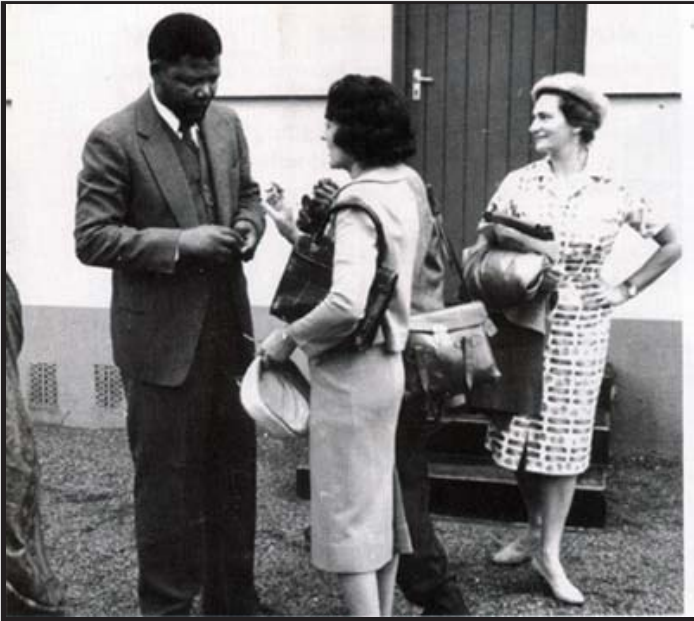
တရားရုံးအပြင် ဘက်၌ ရုယ်ဖွဲ့ နှင့်အတူ။