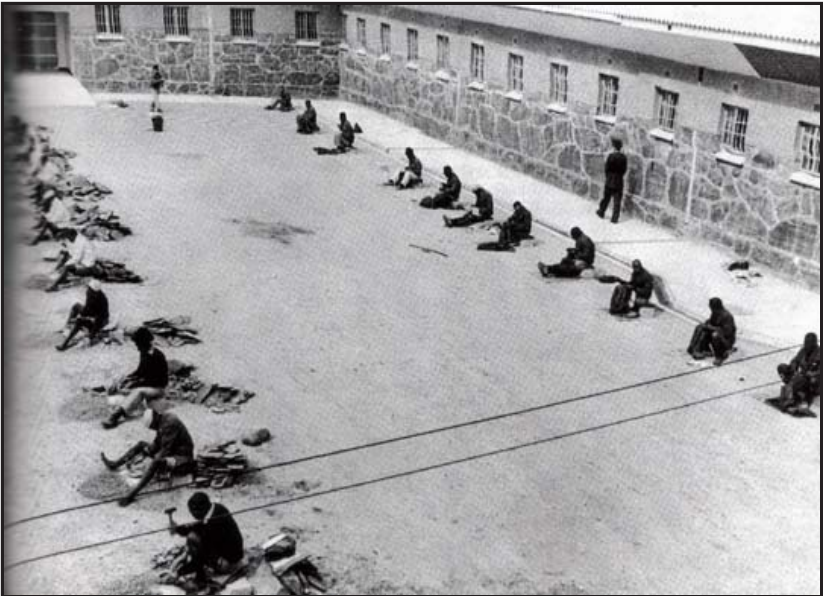
ရော်ဘင်ကျွန်း ထောင်ဝင်း။