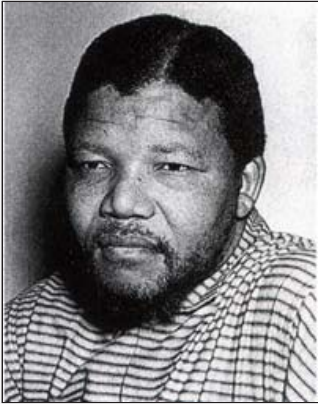
၁၉၆၂၊ ပြည်ပမှ ပြန်လာပြီး နောက် ပုန်းကွယ်နေစဉ်။