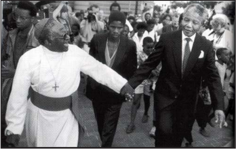
ပိုဏ်းချုပ်ဘုန်းတော်ကြီး တူးတူးနှင့်။