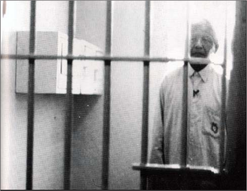
ထောင်နန်းစံကာလ (၂၇) နှစ်မှာ (၁၈) နှစ်လုံးလုံးနေခဲ့ရသော အကျဉ်းတိုက်ခန်း