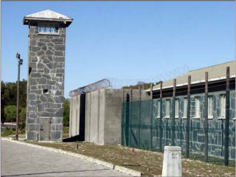
ရော်ဘင်ကျွန်း အကျဉ်းထောင်။