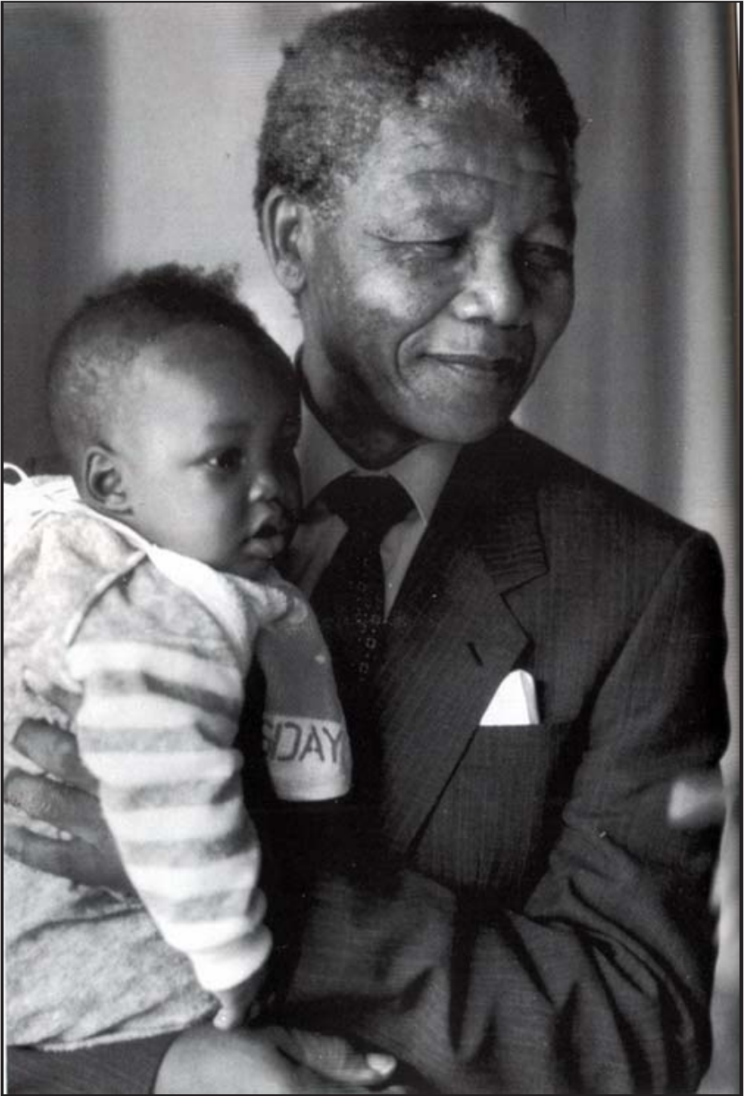
ကျနော်မြေး ဘမ်ဘာတာနှင့်အတူ။