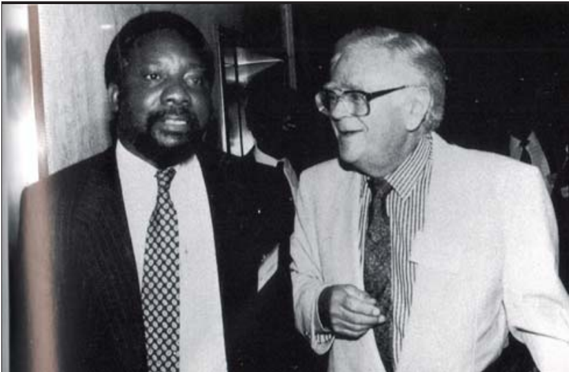
ဂျိုဟန်နစွဘာ့ဂ်မြို့တွင် စီရင်းလ်ရာမာဖိုးစားနှင့် ဂျိုးဆလိုဗိုတို့၊ အခြေခံ ဥပဒေသစ် ရေးဆွဲရေး ပဏာမပြင်ဆင်မှု ဆွေး နွေးပွဲများအတွင်း။