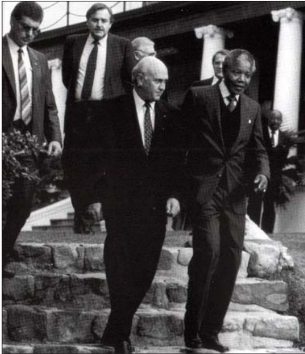
အက်ဖ်ဒဗလူ့ ဒီကလပ်နှင့်။