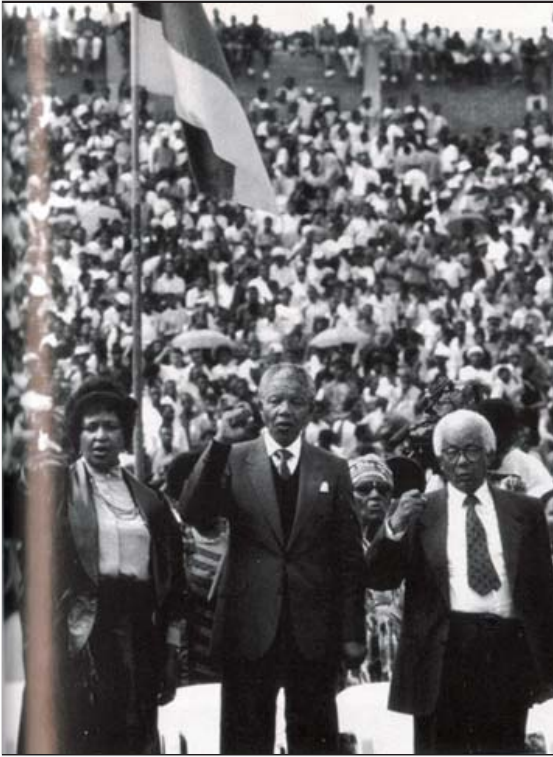
၁၉၉၀ ခု၊ ဝေါလ်တာ၊ ဝင်နီ တို့နှင့် အတူ။