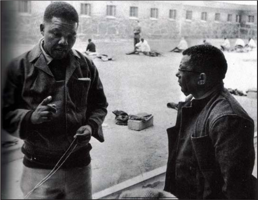
၁၉၆၆၊ ထောင်ဝင်းအတွင်း ဝေါလ်တာနှင့်အတူ။