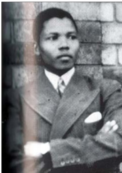
မင်ဒဲလား (၁၉) နှစ်သားအရွယ်။

၁၉၅၂ ဂျီဟန်နစ္စဘာဂ်မြို့တွင် အော်လီဗာနှင့်အတူ တောင် အာဖရိက၏ ပထမဆုံး လူမည်း ရှေ့နေရုံးဖွင့်စဉ်။