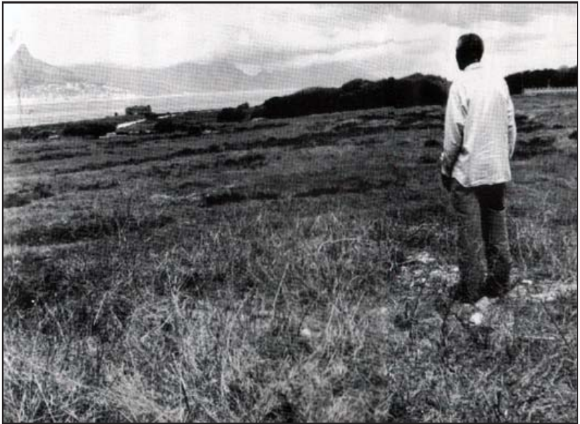
ရော်ဘင်ကျွန်းနဲ့ ကိတ်တောင်းမြို့ကို စားပွဲ ပင်လယ်အော်က ခြားထားသည်။ အဝေးတွင် စားပွဲတောင်ကို မြင်နိုင်သည်။