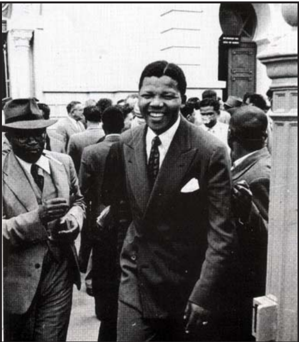
တရားရုံးအပြင်ဘက်၌ မိုးဖက်ကိုတာနီနှင့် အတူ အောင်ပွဲရချိန်။ အစိုးရက စွဲချက်ရုပ်သိမ်းလိုက် ကြောင်း ခုလေးတင်ကြား လိုက်ရသည်။ သို့သော် အောင်ပွဲက ခဏသာ ခံသည်။ (၃) လအကြာ ၁၉၅၉ ခုထဲတွင် ကျနော် တို့ (၂၉) ယောက် နောက် တခါ တရားရုံးတင်ခံရ သည်။