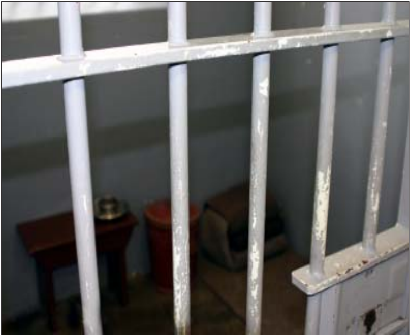
မင်ဒဲလား အကျဉ်းတိုက်ခန်း။