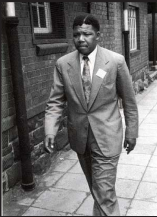
၁၉၅၆၊ အခြေအနေ တင်း မာနေချိန်။

၁၉၅၆၊ နိုင်ငံတော်ပုန်ကန် မှု တရားရုံးတင်စစ်ဆေး မှု။ တရားခံများကို ဂျီဟန် နစ္စဘာဂ်မှ ပရိတိုးရီးယား သို့ နေ့စဉ် ဘတ်စ်ကား များဖြင့် ပို့ဆောင်ရုံးထုတ် သည်။