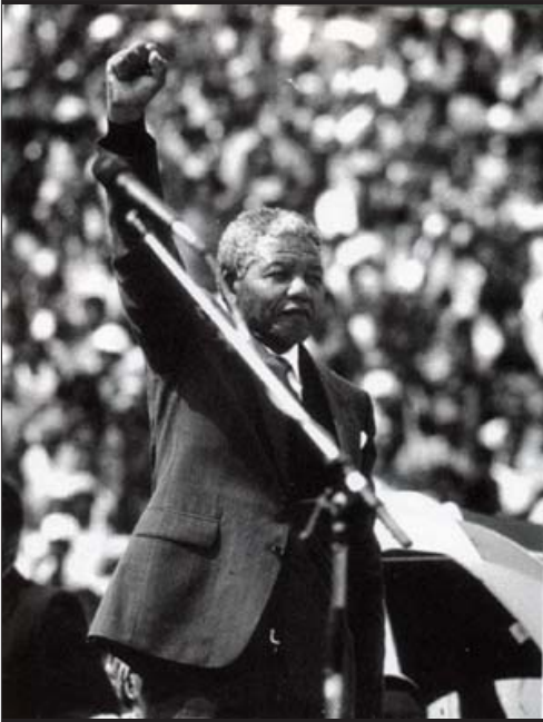
၁၉၉၀၊ ဖေဖော်ဝါရီလ၊ လွတ်လပ်ပြီ။