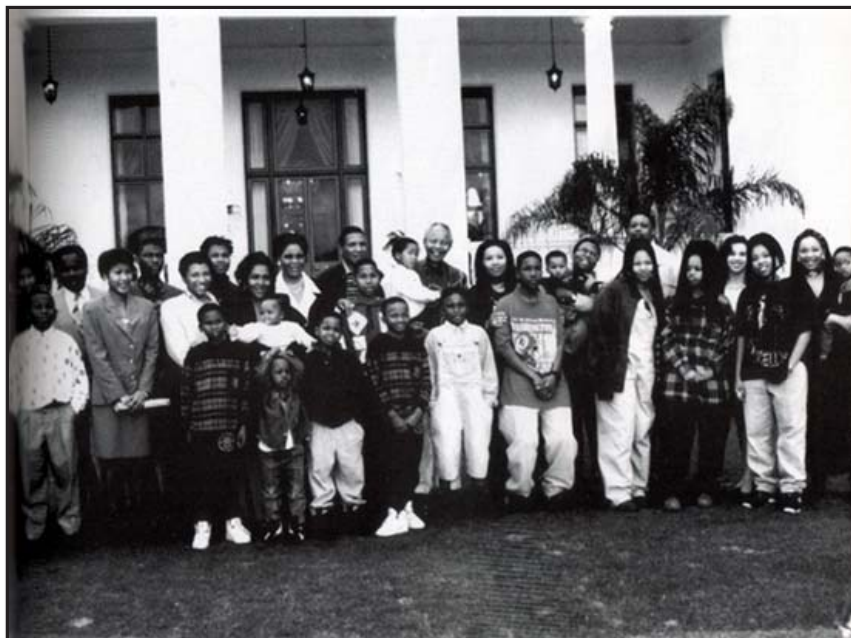
ကျနော် မိသားစု။