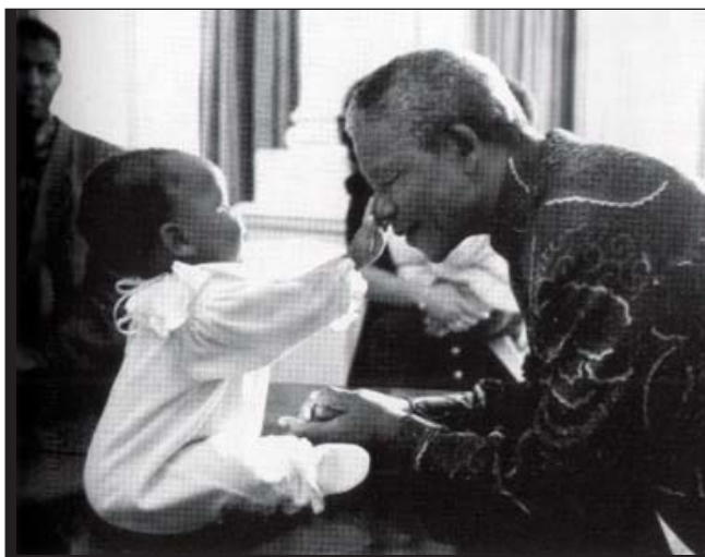
၁၉၉၄ စက်တင် ဘာဗွီ ကျနော် မြစ်မနှင့် အတူ။