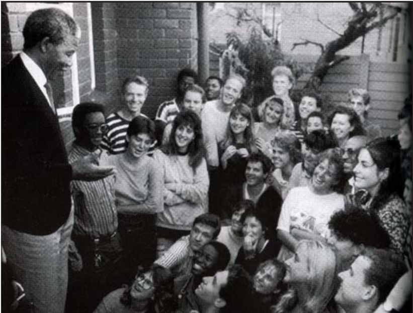
အော်လန်နို နေအိမ်မှာ။