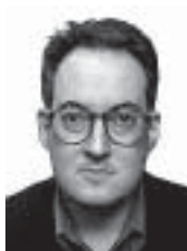
ရက်ချ်မန်း