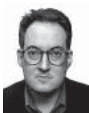
ရက်ချ်မန်း