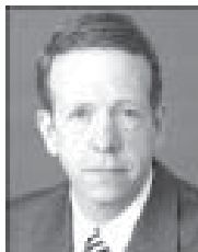
တွမ်ကယ်ရှီးသား