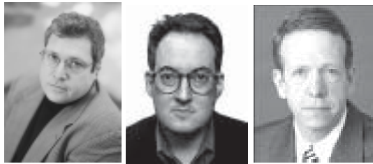
ရောဘတ်ကာဂန်