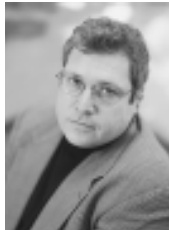
ရောဘတ်ကာဂန်