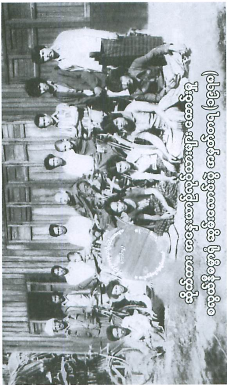
(၁၉၅၅) ၂၆ ဇူလိုင်လတွင် မြန်မာနိုင်ငံတော် အစိုးရမှ အဖွဲ့ခွဲပေးသော မြန်မာ့အလင်းစာမဂ္ဂဇင်း အဖွဲ့ဝင်များနှင့်အတူ ဝမ်းကျောင်းတိုက်တွင် ရိုက်ကူးခဲ့သော ဓာတ်ပုံ