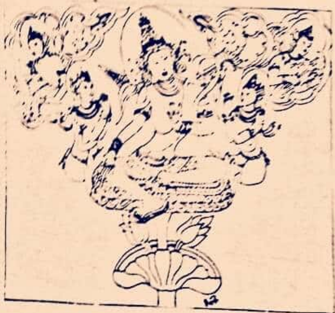
Avalokitesvara seated on lotus