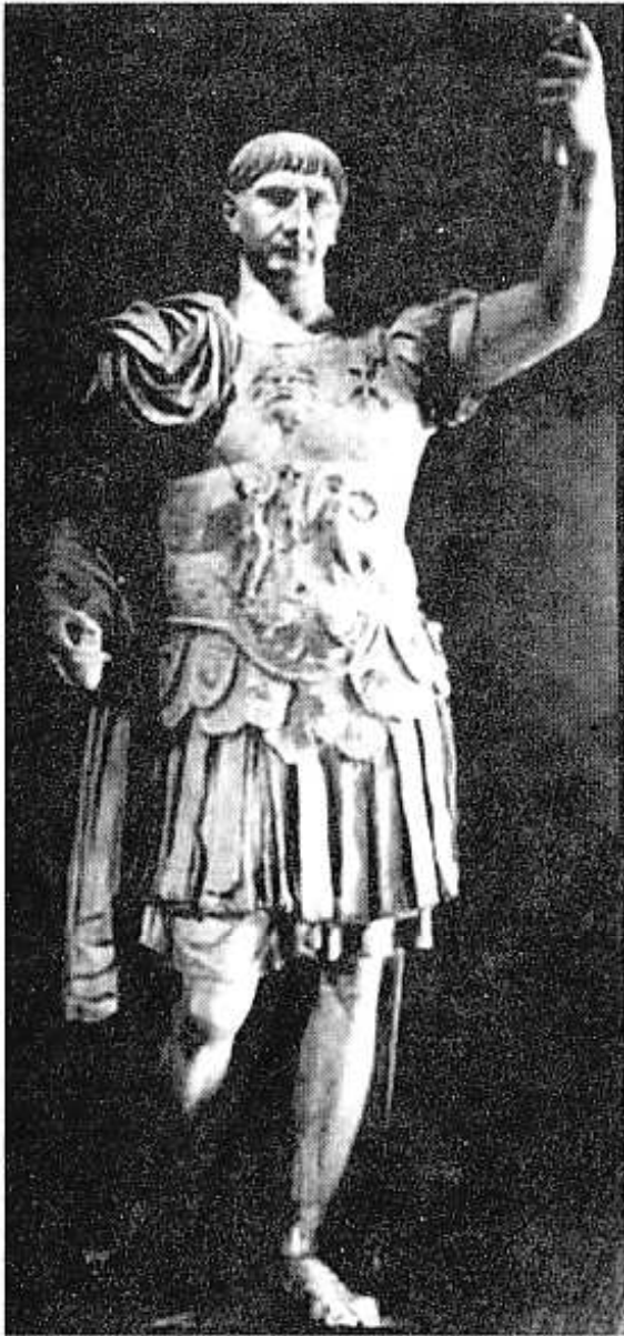
ဂျူးလီးယပ်စ်ဆီဆာ