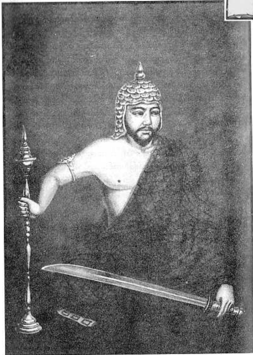
အသောက မောရိယ မဟာရာဇာ