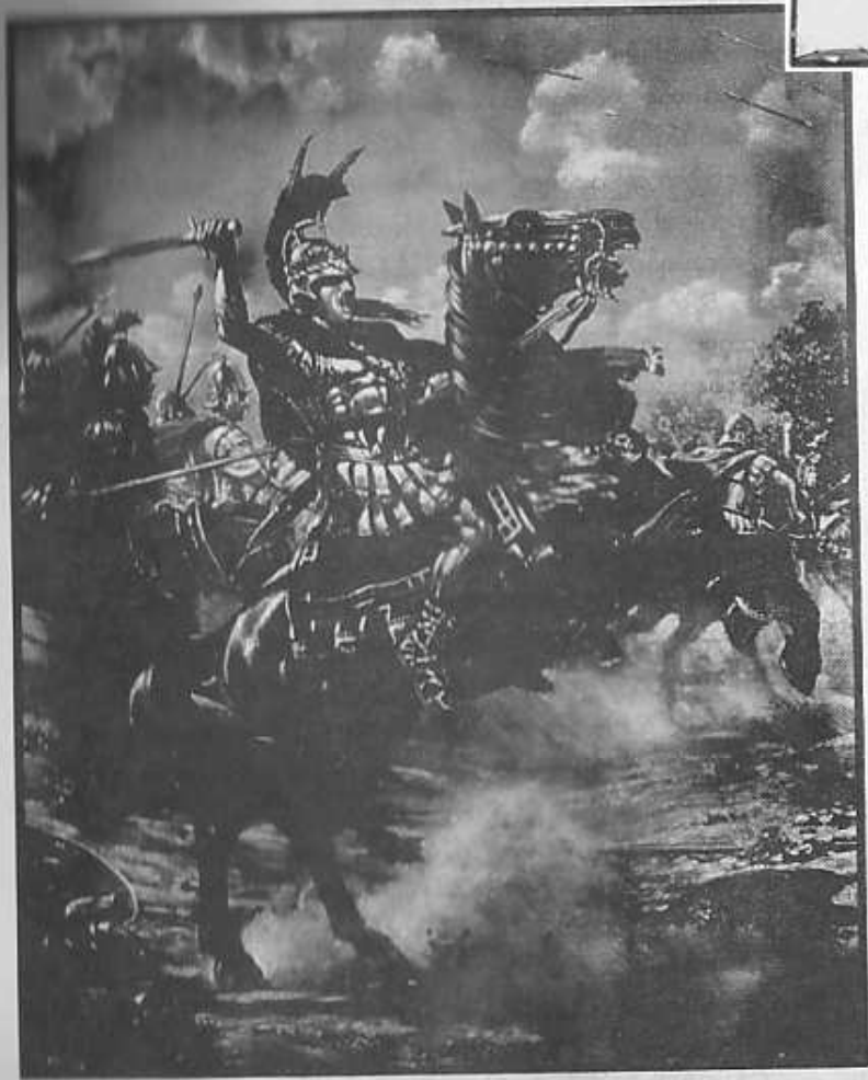
မဟာခံသော အလက်ဇန္ဒာ