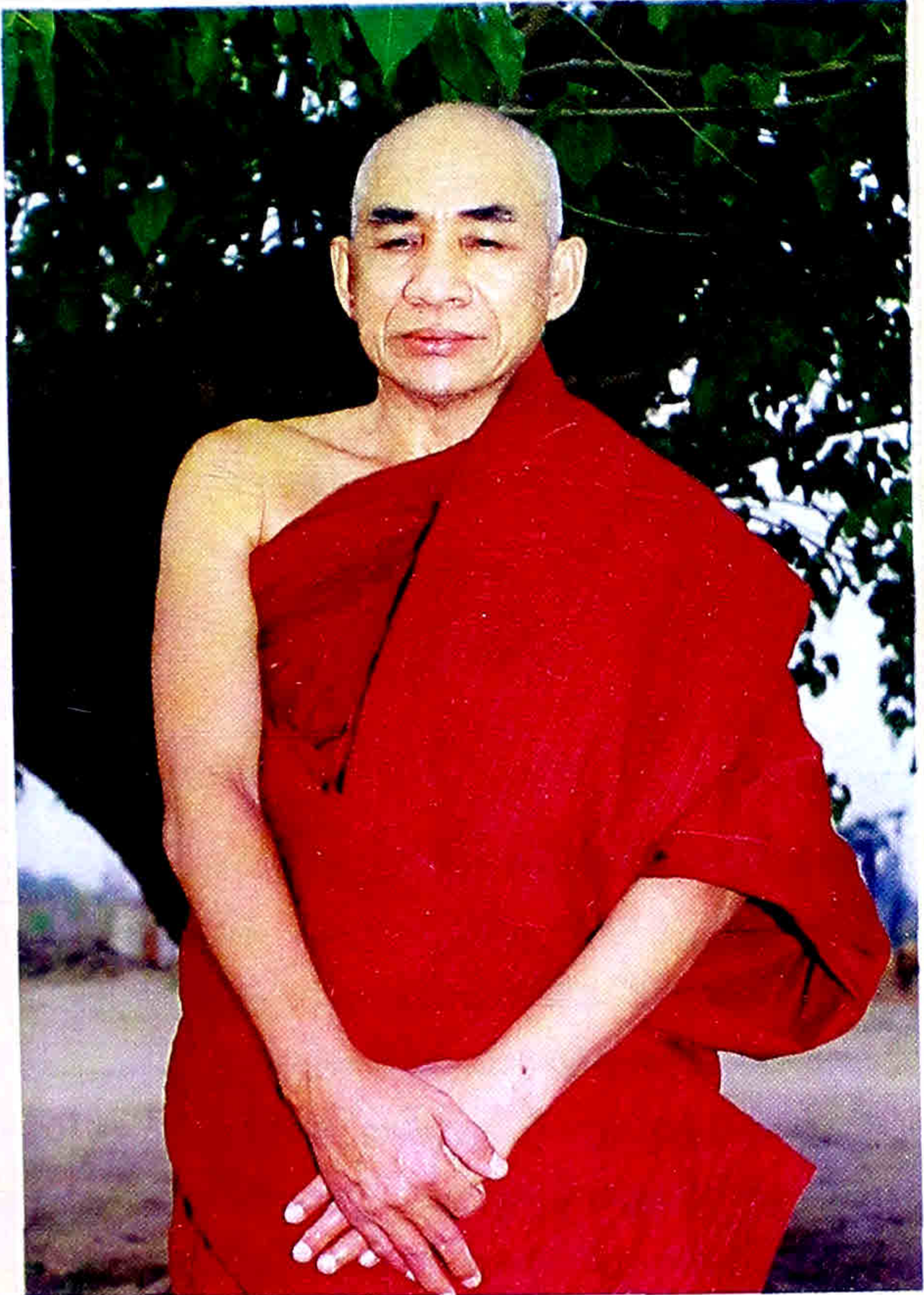
မဟာဗောဓိမြိုင်ဆရာတော် ဝနဝါသီဥေယျဓမ္မသာမိထေရ်