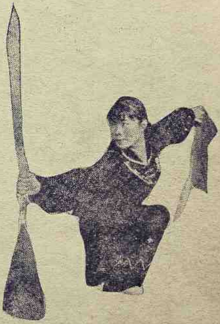
အင်အားပြည့်ရန် လိုက်ကြပြီ

“ငါစကားပြောတာ လောကြီးသွားပြီလား” ဟူ၍ ဖြစ် သည်။