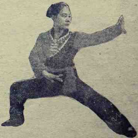
မထင်မှတ်သောတိုက်ပွဲ

ဝမ်ရှောင်း မျက်မှောင်ကြွတ်လျက် စဉ်းစားလိုက်၏။ ပြီးမှ တစ်တစ်ခုကို စိတ်ဆုံးဖြတ်လိုက်ဟန်ဖြင့်- “ကောင်းတယ်၊ ခင်ဗျားရှဲ့အကြံဟာမဆိုးဘူး၊ ကျုပ်ကြီးစား ကြည့်မယ်၊ အောင်မြင်ပါစေလို့ ဆုတောင်းပေးပေါ့ဗျာ” ဝမ်ရှောင်းစကားဆုံးသည်နှင့် မြင်းတောင်းရွှေမှ လှည့်ထွက် လိုက်သည်။ သို့သော် သူချက်ချင်းသတိတခုရသည်။ ဝါးလုံးရှည်ကို မေးမည် ဟု ကြံစည်ပြီးမှ မမေးတော့ပဲ စားသောက်ဆိုင်ထဲသို့ ပြန်ဝင်ခဲ့သည်။ သည်တခါအဝင်တွင် သူမည်သူ့ ကိုမျှ မတိုက်မိတော့ပါ။ အဘယ်ကြောင့် ဆိုသော်- အဝင် အထွက်မှာထက် အတွင်းမှာက လူပိုစည်းကား နေ သောကြောင့် ဖြစ်သည်။