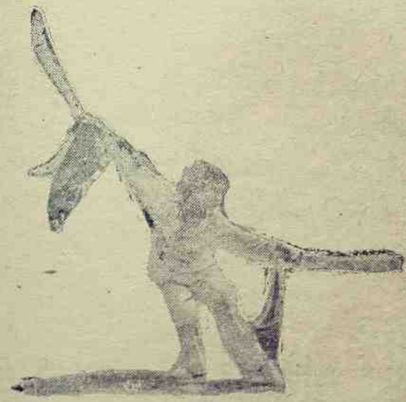
နောက်မှနှင့် အသင်လွဲခြင်း

အပြင်း ပြန်လည် မောင်းနှင်သွားသော သရဲညီနောင်တို့၏ မြင်းများနှင့် လှည်းကိုကြည့်ယင်၊ ဝမ်ရှောင်း စဉ်းစား နေမိ သည်။