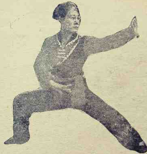
မထင်မှတ်သော စကားတရပ်

ဝမ်ရှောင်၊ ရင်တွေတဖုန်းဒုန်း၊ ခုန်သွားရသည်။