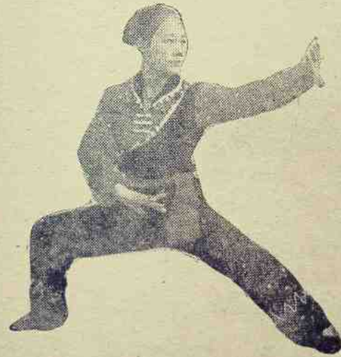
ဒုတိယအကြိမ်လာသောအခါ