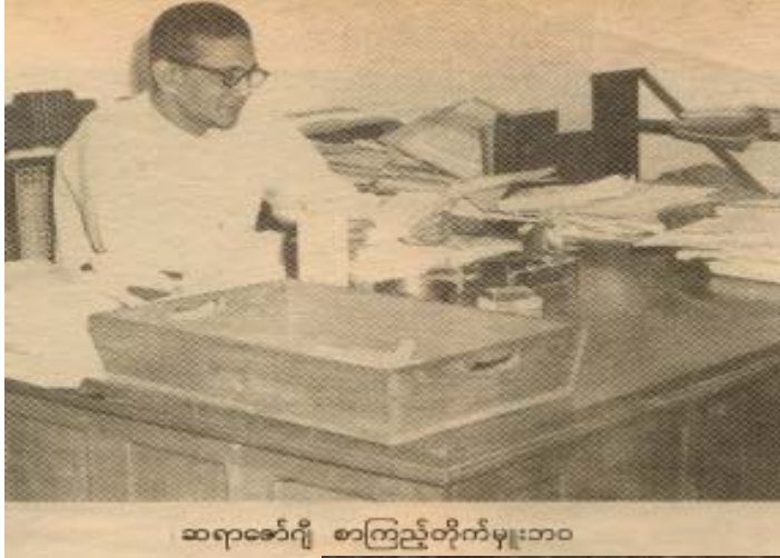
ဆရာဇော်ဂျီ စာကြည့်တိုက်မှူးဘဝ