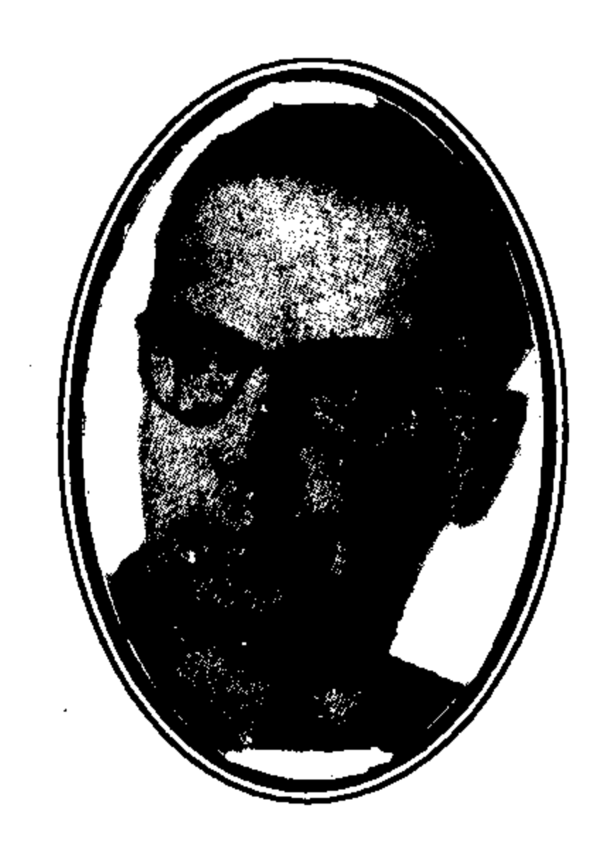
ယူဂိုစလပ်ဗီးယား အမျိုးသား စာရေးဆရာ အန်ဒရစ် [ ၁၈၉၂– ] Ivo Andric, [1892- ]

ယူဂိုစလပ်ဗီးယားနိုင်ငံသား အန်ဒရစ်သည် ၁၉၆၁ ခုနှစ်တွင် ကမ္ဘာကျော် နိုဗဲစာပေဆု အချီးအမြှင့်ကို ခံရသည်။