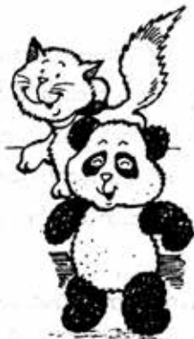
ပန်းထွဲပြည်စာအုပ်တိုက်

ဒါပေမယ့် စွန်စုတ်ကလေးကတော့ တက်ဒီကလေးအပေါ် ဘယ်တော့မှ အပြစ်မမြင်၊ အပြစ်မတင်ပါဘူး။ ။