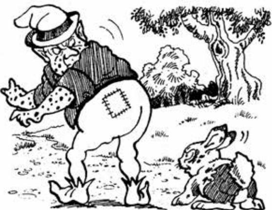
ယုန်လှည့်စာအုပ်တိုက်

ဘော့ပဲတေးဟာ မှင်စာပြောက်ကျားလေး ခုလိုပြောလာတာကို မယုံဘူးပေါ့ကွယ်။ ဒါကြောင့် ထပ်ပြီး