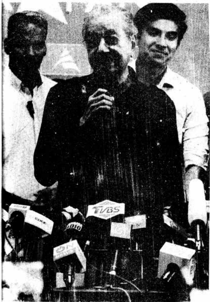
အောင်ပွဲခံစကားပြောနေသည့် ဝန်ကြီးချုပ် ဟောင်းယာဖိုဟာမက်