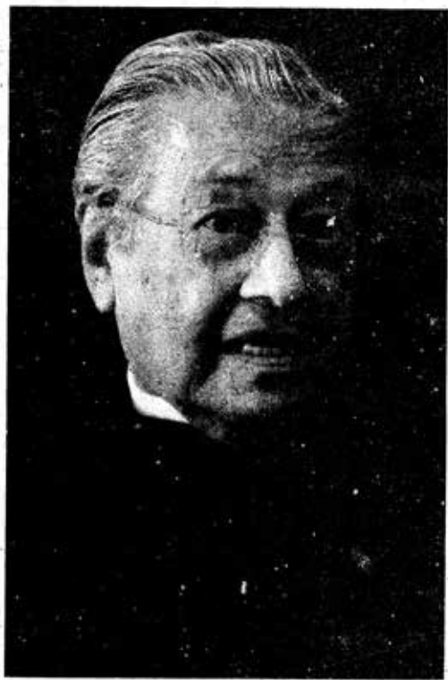
ရွေးကောက်ပွဲအောင်နိုင်ခဲ့သည့် လူဆိုခြေတက် ဝန်ကြီးချုပ်သစ် မဟာသီယာမိုဟာမက်