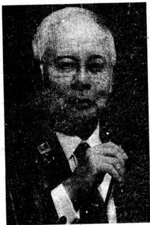
ထွက်တော်မူ နန်းကခွာသည် ဝန်ကြီးချုပ်ဟောင်း နာကျင်ရာစစ်