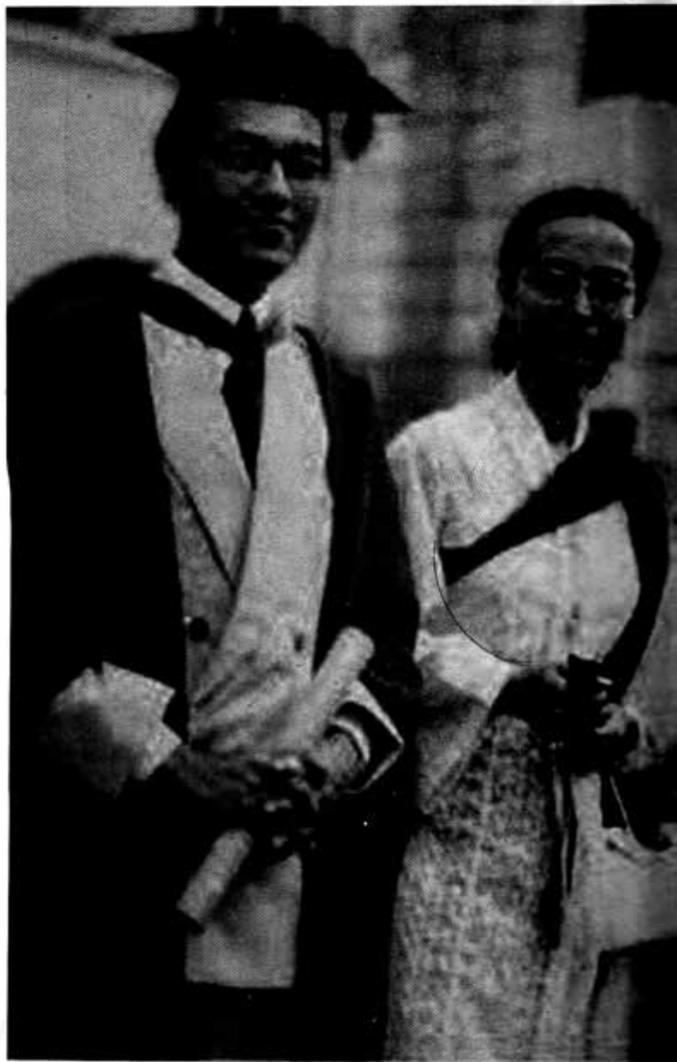
မဟာသီယာဘွဲ့ယူစဉ်